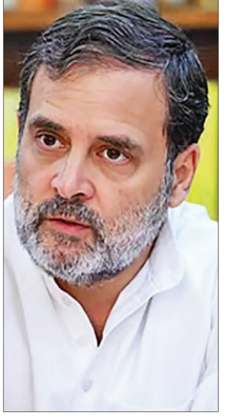
ହେବାକୁ ଯାଉଛି । କର୍ତ୍ତୃତ୍ୱରେ ମଧ୍ୟ ସିଦ୍ଧହେବା ଏବଂ ଶିବକ୍ରମାଳରେ ମଧ୍ୟ ଏମିତି ଛକାପଞ୍ଜା ହୋଇଥିଲା ।

ଗ୍ରହଣ ନୁହେଁ । ରାଜୁଲଙ୍କ ପକ୍ଷରୁ କୁହାଯାଇଥିଲା ଯେ ଦେଶ୍ୱେରୀୟାଙ୍କୁ ମୁଖ୍ୟମନ୍ତ୍ରୀ ହେଲେ ସତ୍ୟଶର୍ମାଙ୍କୁ ମନ୍ତ୍ରମଣ୍ଡଳରେ ଗୁରୁତ୍ୱପୂର୍ଣ୍ଣ ଦାୟିତ୍ୱ ମିଳିବ । କିନ୍ତୁ ସେ ମାନିବାକୁ ପ୍ରସ୍ତୁତ ନୁହଁନ୍ତି । ଅନ୍ୟପକ୍ଷରେ ଦେଶ୍ୱେରୀୟାଙ୍କୁ ନେଇ ମଧ୍ୟ ହାଇକମାଣ୍ଡ ଚିନ୍ତାରେ ଅଛନ୍ତି । ତାଙ୍କୁ ମୁଖ୍ୟମନ୍ତ୍ରୀ କରାଗଲେ ରାଜ୍ୟରେ ପୁଣି ଦୁଇଟି ଉପନିର୍ବାଚନ ହେବ । ଦେଶ୍ୱେରୀୟାଙ୍କ ଲୋକସଭା ସାମ୍ପଦ ଥିବାରୁ ମୁଖ୍ୟମନ୍ତ୍ରୀ ହେଲେ ତାଙ୍କୁ ବିଧାନସଭାକୁ ନିର୍ବାଚିତ ହେବାକୁ ପଡ଼ିବ । ପୁଣି ସେ ଲୋକସଭା ସଭ୍ୟ ପଦରୁ ଇସ୍ତଫା ଦେବେ । ତେଣୁ ଉଭୟ ଲୋକସଭା ଏବଂ ବିଧାନସଭା ଆସନରେ ସାମି ନିର୍ବାଚନ ହେବ । ଏହାପରେ ହାଇକମାଣ୍ଡ ଦେଶ୍ୱେରୀୟାଙ୍କୁ ବୁଝାଉଛନ୍ତି । କିନ୍ତୁ ସେ ମୁଖ୍ୟମନ୍ତ୍ରୀ ହେବାକୁ ଜିଏ ଧରିଥିବାରୁ ହାଇକମାଣ୍ଡ ଅତୁଆରେ ପଡ଼ିଯାଇଛନ୍ତି । କେରଳରେ କର୍ତ୍ତୃତ୍ୱ ଲାଭ କରି ପରିସ୍ଥିତି ସୃଷ୍ଟି