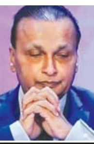
ଏକକାଳୀନ ମୁମ୍ବାଇର ୧୭ଟି ସ୍ଥାନରେ ଯାଞ୍ଚ

■ ମୁମ୍ବାଇ, ୯।୫ (ଏକେନି): ଏକ ଘଟଣାକ୍ରମେ କେନ୍ଦ୍ରୀୟ ଚଳଚ୍ଚିତ୍ରକାରୀ ଏକେନି (ସିବିଆଇ) ଶନିବାର ୨୭ ହଜାର କୋଟି ଟଙ୍କାର ଠକେଇ ମାମଲାର ଅନୀଲ ଅମ୍ବାନୀଙ୍କ ଲିଭାଏବ୍ ସହିତ ଗୁପ୍ତ ସହିତ କଡ଼ିତ କମ୍ପାନୀଗୁଡ଼ିକ ଉପରେ ଚଢ଼ଢ଼ କରିଛି। ଚଳଚ୍ଚିତ୍ରକାରୀ ସଂଘ ମୁମ୍ବାଇର ୧୭ଟି ସ୍ଥାନରେ ଏକକାଳୀନ ଚଢ଼ଢ଼ କରିଥିଲା, ଯାହା ବ୍ୟାଙ୍କ ଠକେଇ ଏବଂ ଅନ୍ୟତ୍ର ପାଣି ସ୍ଥାନାନ୍ତର କରିବା ମାମଲା ସହିତ ଜଡ଼ିତ। ସିବିଆଇର ଏହି କାର୍ଯ୍ୟାନୁଷ୍ଠାନ ରିଲାଏନ୍ସ ଗ୍ରୁପ୍ ତିନି କମ୍ପାନୀ ରିଲାଏନ୍ସ ଟେଲିକମ୍ ଲିମିଟେଡ୍, ରିଲାଏନ୍ସ କମ୍‌ସିଆଲ୍ ପାଇନାନ୍ସ ଲିମିଟେଡ୍ ଏବଂ ରିଲାଏନ୍ସ ହୋମ୍ ପାଇନାନ୍ସ ଲିମିଟେଡ୍ ସହିତ ଜଡ଼ିତ। ସିବିଆଇ ସମେତ କରୁଛି, ବ୍ୟାଙ୍କଗୁଡ଼ିକରୁ ଉପାଧିକାରୀ ଟଙ୍କା ଅନ୍ୟତ୍ର ସ୍ଥାନାନ୍ତର