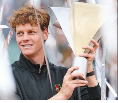
ଜିତିବାର ସୌଭାଗ୍ୟ ଲାଭ କରିଛନ୍ତି । ପୂର୍ବରୁ ନୋଭାକ ଡେକୋଭିଚ ଓ ରାଫେଲ ନାଡାଲ କ୍ରମାଗତ ୪ଟି ମାଷ୍ଟରସ୍ ଜିତି ଏହି ରେକର୍ଡର ଅଧିକାରୀ ରହିଥିଲେ ।

ମାଦ୍ରିଦ, ୪୫ (ଏକେଡ଼ି): ବିଶ୍ଵର ଏକ ନମ୍ବର ଟେନିସ ଖେଳାଳି ଜାନିକ ସିନର କ୍ୟାରିୟର ପ୍ରଥମଥର ଲାଗି ମାଦ୍ରିଦ ଓପନ୍ ଟାଇଟଲ ଜିତିଛନ୍ତି । ଗତକାଲି ରାତିରେ ଅନୁଷ୍ଠିତ ପୁରୁଷ ସିଙ୍ଗଲ୍ ପାଇନାଲରେ ସିନର ୬-୧, ୬-୨ ସିଟାସକ୍ସ ସେଟ୍ରେ ବିଶ୍ଵର ୩ ନମ୍ବର ଖେଳାଳି କର୍ମାନ୍ନର ଆଲେକ୍ସକାଣ୍ଡର କେରେଭାକୁ ହରାଇ ଚାମ୍ପିଅନ ହୋଇଛନ୍ତି । ଏହି ମ୍ୟାଚ୍ ଜିତିବାକୁ ସିନରଙ୍କୁ ମାତ୍ର ୫୮ ମିନିଟ୍ ସମୟ ଲାଗିଥିଲା । ଇଟାଲୀର ସିନରଙ୍କ ଏହା କ୍ରମାଗତ ପଞ୍ଚମ ମାଷ୍ଟର-୧୦୦୦ ଟାଇଟଲ୍ । ଏଥିପୂର୍ବରୁ ସେ ଚଳିତ ବର୍ଷ ଇଣ୍ଡିଆନ ଓପେନ୍, ମିଆମି ଓ ମୋଣ୍ଟେ କାର୍ଲୋରେ ବାଜିମାଡ୍ କରିଥିଲେ । ସେହିଭଳି ୫ ମାସ ତଳେ ଫ୍ରେଞ୍ଚ ଓପେନ୍ରେ ଚାମ୍ପିଅନ ହୋଇଥିଲେ । ପକ୍ଷରେ ବିଶ୍ଵର ପ୍ରଥମ ପୁରୁଷ ଟେନିସ ଖେଳାଳି ଭାବେ ୨୪ ବର୍ଷୀୟ ସିନର କ୍ରମାଗତ ୫ଟି ମାଷ୍ଟର-୧୦୦୦ ଟ୍ରଫି