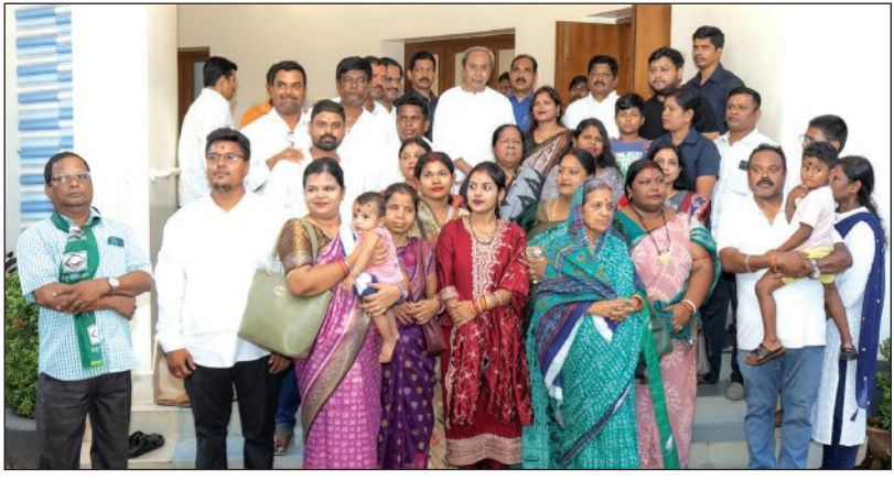
କେନ୍ଦ୍ରୀୟ ଲିଙ୍ଗ ଆନନ୍ଦପୁର ମୁନିସିପାଲିଟିର ବିଭେଦି କାର୍ଯ୍ୟକ୍ରମରେ ଓ ଆନନ୍ଦପୁର ବିଧାନସଭା ଅଧିବେଶନ ସମୟରେ ବିଭେଦି ସଭାପତି ନବୀନ ପଟ୍ଟନାୟକଙ୍କ ସାକ୍ଷାତ କରୁଛନ୍ତି ।