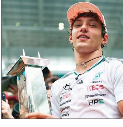
ମିଆମି, ୪୫ (ଏକେଡ଼ି): ବିଶ୍ଵର ପ୍ରଥମ ଡ୍ରାଇଭର ଭାବେ ଇଟାଲୀର କିମି ଆଣ୍ଡୋନେଲି ଏଠାରେ

ଅନୁଷ୍ଠିତ ମିଆମି ଓପେନ୍ ଗ୍ରାଁ ଚାମ୍ପିଅନ ହୋଇଛନ୍ତି । ଏହା ପକ୍ଷରେ ସେ ବିଶ୍ଵର ପ୍ରଥମ ଖେଳାଳି ଭାବେ ପୋଲ ପୋଲିସନ ହାସଲ କରିବା ପରେ ଟାଇଟଲ ଜିତିବାରେ ସମର୍ଥ ହୋଇ ରେକର୍ଡ ପ୍ରତିଷ୍ଠା କରିଛନ୍ତି । ମସିଡିଲ୍ ପକ୍ଷରୁ ପ୍ରତିନିଧିତ୍ଵ କରୁଥିବା କିମି ଓ ଜର୍ଜ୍ ରସେଲ ଗତ ୪ଟି ପର୍ଯ୍ୟୁଟି ଖାନ୍ ରେସ୍ରେ ପୋଲ ପୋଲିସନ ହାସଲ କରିବା ସହ ଚାମ୍ପିଅନ ହୋଇଛନ୍ତି । କିନ୍ତୁ ଏଠାରେ ଅନୁଷ୍ଠିତ ଷ୍ଟିପ୍ ରେସ୍ରେ ମ୍ୟାକ୍ଲରେନ୍ଡର୍ ଡ୍ରାଇଭର ଲାଣ୍ଡୋ ନୋରିସ୍ ଓ ଓସ୍ବାର ପିଆସ୍ଟି ପ୍ରଥମ ଦୁଇଟି ସ୍ଥାନରେ ରହିଥିଲେ । ଚଳିତ ସିନରରେ ମସିଡିଲ୍ ଏହି ଭଲଖେରେ କୌଣସି ସପକ୍ଷତା ପାଇ ପାରି ନାହିଁ ।