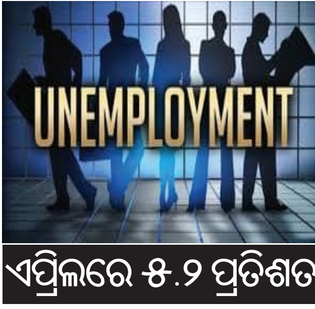
ଏପ୍ରିଲରେ ୫.୨ ପ୍ରତିଶତ

ନୂଆଦିଲ୍ଲୀ, ୧୭।୫ (ଏକେନି): ସମ୍ପ୍ରତି ଦେଶରେ ଭାରତରେ ବେକାରୀ ହାରରେ ବୃଦ୍ଧି ଘଟିଛି। ବେକାରୀ ହାର ବର୍ତ୍ତମାନ ୬ ମାସର ସର୍ବାଧିକ ହାରରେ ପହଞ୍ଚିଛି। ଏପ୍ରିଲ ମାସରେ ବେକାରୀ ହାର ୫.୨%ରେ ପହଞ୍ଚିଛି। କେନ୍ଦ୍ର ଶ୍ରମ ବଳ ସର୍ବୋଚ୍ଚ ଅନୁପାତ, ସହରାଞ୍ଚଳ ମହିଳାମାନଙ୍କ ମଧ୍ୟରେ ବେକାରୀ ହାର ଏକ ବର୍ଷ ମଧ୍ୟରେ ସହୁରା କମ୍ ରହିଥିଲା। ଦେଶରେ ୧୫ ବର୍ଷ ଏବଂ ତତ୍ତ୍ୱରୁ ବୟସର ଲୋକଙ୍କ ପାଇଁ ବେକାରୀ ହାର ଏପ୍ରିଲରେ ୫.୨%କୁ ବୃଦ୍ଧି ପାଇଛି, ଯାହା ଗତ ୬ ମାସ ମଧ୍ୟରେ ସର୍ବାଧିକ ହୋଇ ପାର୍ଚ୍ଚରେ ଏହି ହାର ୫.୧% ଥିଲା। ପୂର୍ବରୁ, ୨୦୨୫ ଅକ୍ଟୋବରରେ ବେକାରୀ ହାର ୫.୨% ରେକର୍ଡ କରାଯାଇଥିଲା। କେନ୍ଦ୍ର ପରିଷ୍ଟାପନ ଏବଂ କାର୍ଯ୍ୟକ୍ରମ ରୂପାୟନ ମନ୍ତ୍ରାଳୟ ଦ୍ୱାରା ପ୍ରକାଶିତ ପରିସ୍ଥିତି ଲେବର ଫୋର୍ସ ସର୍ବୋଚ୍ଚ ଅନୁପାତ, ସହରାଞ୍ଚଳରେ