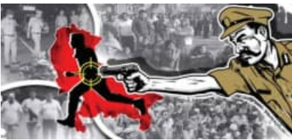
ବାଲେଶ୍ୱର, ଜଗତସିଂହପୁର ଓ ଜୟପୁରରେ ଏନ୍‌କାଉଣ୍ଟର ହୋଇପାରେ ବୋଲି ସୂଚନା ମିଳିଛି। ମାତ୍ର ବେଲଗାମ୍ ଅପରାଧୀଙ୍କୁ ନିୟନ୍ତ୍ରଣ ପାଇଁ ପୁଲିସର ଏନ୍‌କାଉଣ୍ଟର ନିଶନ କେତେ ସଫଳ ହେବ ତ ପୁଲିସର ମନିଷ ଛବିକୁ କେତେ ଝଟକାଇବ, ତାହାକୁ ନେଇ ଏବେ ବି ସନ୍ଦେହ ରହିଛି।

କରିବାକୁ ଟାର୍ଗେଟ୍ ଦିଆଯାଇଛି। ଏହି କ୍ରମରେ ଗତ ଝାରସୁଗୁଡ଼ା, ବ୍ରହ୍ମପୁର ଓ ସମ୍ବଲପୁରରେ ଏନ୍‌କାଉଣ୍ଟର ଆରମ୍ଭ ହୋଇଛି; ଏହାପରେ ନୟାଗଡ଼, ରାଉରକେଲା, ବାଲେଶ୍ୱର, ଜଗତସିଂହପୁର ଓ ଜୟପୁରରେ ଏନ୍‌କାଉଣ୍ଟର ହୋଇପାରେ ବୋଲି ସୂଚନା ମିଳିଛି। ମାତ୍ର ବେଲଗାମ୍ ଅପରାଧୀଙ୍କୁ ନିୟନ୍ତ୍ରଣ ପାଇଁ ପୁଲିସର ଏନ୍‌କାଉଣ୍ଟର ନିଶନ କେତେ ସଫଳ ହେବ ତ ପୁଲିସର ମନିଷ ଛବିକୁ କେତେ ଝଟକାଇବ, ତାହାକୁ ନେଇ ଏବେ ବି ସନ୍ଦେହ ରହିଛି।