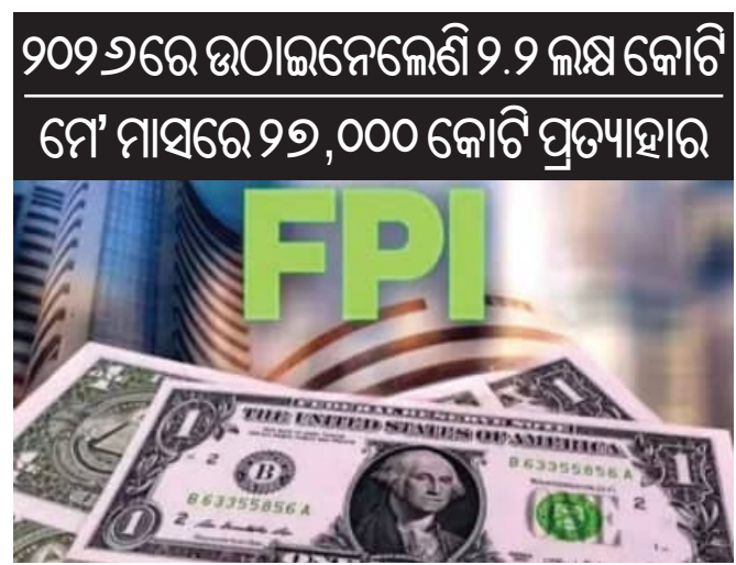
୨୦୨୬ରେ ଉଠାଇନେଲେଣି ୨.୨ ଲକ୍ଷ କୋଟି ମେ' ମାସରେ ୨୭,୦୦୦ କୋଟି ପ୍ରତ୍ୟାହାର

ନୂଆଦିଲ୍ଲୀ, ୧୭।୫ (ଏକେନି): ବୈଶ୍ୱିକ ଅର୍ଥନୈତିକ ଅନିଶ୍ଚିତତା ଏବଂ ଭୁ-ରାଜନୈତିକ ଚିନ୍ତା ମଧ୍ୟରେ ବିଦେଶୀ ଫୋର୍ଟପୋଲିଓ ନିବେଶକ (ଏଫପିଆଇ) ମାନେ ଭାରତୀୟ ସେକ୍ଟର ବଜାରରୁ କ୍ରମାଗତ ଭାବେ ନିଜର ପୁଞ୍ଜି ପ୍ରତ୍ୟାହାର କରିବାରେ ଲାଗିଛନ୍ତି।