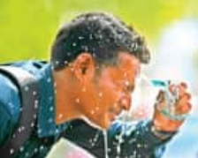
୨୦-୨୪ ଅସହ୍ୟ ହେବ ତାତି ସାଙ୍ଗକୁ ଗୁରୁଗୁଳି

■ ଭୁବନେଶ୍ୱର, ୧୭।୫ (ସମ୍ବାଦ): ରାଜ୍ୟରେ ତାପମାତ୍ରା ବଢ଼ିବାରେ ଲାଗିଛି। ଲଗାତାର ଭାବେ ରାଜ୍ୟକୁ ଗରମ ଶୁଷ୍କ ବାୟୁ ପ୍ରବାହ ସହ ଉପକୂଳବର୍ତ୍ତୀ ଜିଲ୍ଲା ଜଳାୟବାସପୂର୍ଣ୍ଣ ବାୟୁର ପ୍ରବାହ ହେଉ ଗୁରୁଗୁଳି ମଧ୍ୟ ଅସହ୍ୟ ହେଉଛି। ରବିବାର ରାଜ୍ୟର ୧୧ ଡିଗ୍ରୀ ଉପରେ ତାପମାତ୍ରା ୪୦ ଡିଗ୍ରୀ କିମ୍ବା ଏହାଠାରୁ ଅଧିକ ରେକର୍ଡ ହୋଇଥିବା ବେଳେ ୪୨.୯ ଡିଗ୍ରୀ ସହ ବୌଦ୍ଧରେ ରାଜ୍ୟର ସବୁଠୁ ଅଧିକ ତାପମାତ୍ରା ରେକର୍ଡ ହୋଇଛି। ସେହିପରି ଅନୁଗୁଳା ଓ ସୋନପୁରରେ ତାପମାତ୍ରା ୪୨.୧ ଓ ୪୨.୯ ଡିଗ୍ରୀ ଲେଖାଏଁ ରେକର୍ଡ ହୋଇଛି।