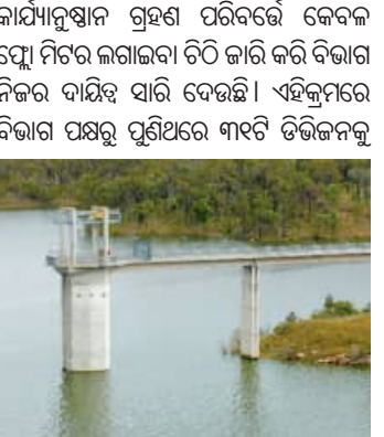
ବିଭାଗ ପକ୍ଷରୁ ଚିଠି ଲେଖାଯାଇଛି। ଆସନ୍ତା ଜୁନ ୩୦ ତାରିଖ ପୂର୍ବା ଯେଉଁ ଶିଳ୍ପ ସଂସ୍ଥାଗୁଡ଼ିକ ଏହି ନିର୍ଦ୍ଦେଶ ପ୍ରାପ୍ତ ହେବ ସେମାନେ ଆଜିରୁ ବିଭାଗୀୟପୋର୍ଟାଲ୍‌ସହ ସଂଯୋଗାଳନ କରିବାକୁ ବାଧ୍ୟ ହେବେ।

■ ଭୁବନେଶ୍ୱର, ୧୭।୫ (ସମ୍ବାଦ): ରାଜ୍ୟରେ ଶିଳ୍ପ ସଂସ୍ଥାମାନେ ଚୁକ୍ତିନାମାଠାରୁ ଯଥେଷ୍ଟ ଅଧିକ ଜଳ ସଂଗ୍ରହ କରୁଛନ୍ତି। କେଉଁଠି ନଦୀ ଶାଖାରେ ଜଳଚଳେ ଖୋଳ କରି ପାଣି ଉଠାଯାଇଛି ତ କେଉଁଠି ପୁଣି କାରଖାନା ପରିସରରେ ଅନୁମତିଠାରୁ ଅଧିକ ଅତିରାଜ୍ୟ ନଳକୂଅ ଖନନ ହୋଇଛି। ଅନ୍ୟପକ୍ଷରେ କେତେକ ଶିଳ୍ପ ସଂସ୍ଥା ବାରମ୍ବାର ତାରିକ୍ ସତ୍ତ୍ୱେ ଯେଉଁଠି ନଳକାଳ ପାଣି ଟିକସ ପାଳି ଚାଲିଛି। କ୍ଷେତ୍ରରେ କାର୍ଯ୍ୟ କରୁଥିବା ପ୍ରଶାସନର ବିରକ୍ଷ ଅଧିକାରୀଙ୍କଠାରୁ କନିଷ୍ଠତମ ଅଧିକାରୀ ଏ ସମ୍ପର୍କରେ ଅବଗତ ଥିଲେ ବି କୌଣସି କାର୍ଯ୍ୟାନୁଷ୍ଠାନ ଗ୍ରହଣ କରାଯାଇନାହିଁ। ବିଭିନ୍ନ ମହଲରେ ବାରମ୍ବାର ଅଭିଯୋଗ, ଉଦ୍‌ବେଗ ସତ୍ତ୍ୱେ ଜଳସମ୍ପଦ ବିଭାଗ ପକ୍ଷରୁ କିଛି ଦୃଷ୍ଟାନ୍ତମୂଳକ