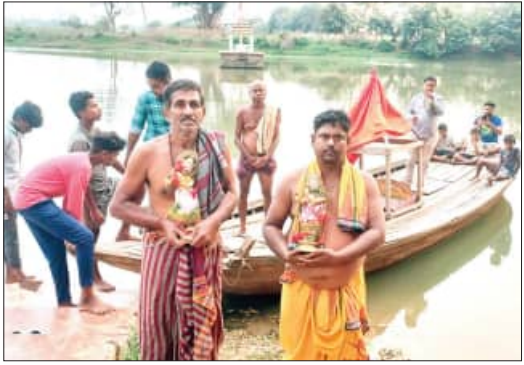
ଦିଆଯାଇ ଅର୍ଥିକ ବ୍ୟବସ୍ଥା ହୋଇଥାଏ । ଦେବୋତ୍ତର ବିଭାଗ ପକ୍ଷରୁ ଏହି ନିଲାମ କାର୍ଯ୍ୟ ବନ୍ଦ କରାଯାଇଥିବାରୁ ଅର୍ଥିକ ବ୍ୟବସ୍ଥାରେ ବିଭାଗ ହେବା ଯୋଗୁଁ ଚନ୍ଦନ ଯାତ୍ରା ସଠିକ୍ ଭାବେ ହୋଇପାରି ନଥିବା ଦେଖାଯାଇଛି । ଅପରପକ୍ଷରେ, ଚନ୍ଦନଯାତ୍ରାର କିଛି ଦିନ ପୂର୍ବରୁ ମାହାଙ୍ଗା ବିଧାୟକ ବୁଦ୍ଧକ୍ଷେତ୍ର ଚନ୍ଦନ ଯାତ୍ରା ମହୋତ୍ସବ ଚଳିତ ବର୍ଷ ସଠିକ୍ ଭାବେ ହୋଇ ପାରିନାହିଁ । ରବିବାର ଶ୍ରୀଜୀଉଙ୍କ ଚନ୍ଦନଯାତ୍ରାର ଶେଷ ଦିନ ହୋଇଥିଲା ବେଳେ ଗ୍ରନ୍ଥବୋର୍ଡ଼ ପକ୍ଷରୁ କେବଳ ପରମ୍ପରା ବଞ୍ଚାଇବା ପାଇଁ ଅତ୍ୟନ୍ତ ନିରାଡ଼ମ୍ବରରେ ପ୍ରଭୁ ମଦନମୋହନ ଚନ୍ଦନ ଯୋଗରାରେ ଚାପ ଖେଳ ଫେରିଯାଇଥିବା ଆଶଙ୍କା ରହିଛି । ବୁଦ୍ଧକ୍ଷେତ୍ରର ପ୍ରସିଦ୍ଧ ଚନ୍ଦନଯାତ୍ରାକୁ ହାତୀ ଏଭଳି ବନ୍ଦ କରିବା ପଛରେ କି ରହସ୍ୟ ରହିଛି ତାହା ତଦନ୍ତ ସାପେକ୍ଷ ବୋଲି ଉକ୍ତ ମହଲରେ ଦାବି ହୋଇଛି ।

ନିଶ୍ଚିତକୋଇଲି ବୁଦ୍ଧକ୍ଷେତ୍ର ପାଠରେ ଥିବା ଶ୍ରୀ ଶ୍ରୀ ବଳଦେବଜୀଉଙ୍କ ଚନ୍ଦନଯାତ୍ରା ଚଳିତ ବର୍ଷ ଫିକା ପଢ଼ିଲେ । ଏ ବର୍ଷ ଚନ୍ଦନଯାତ୍ରା ମହୋତ୍ସବ ଅନୁଷ୍ଠିତ ହୋଇ ନଦୀକୂଳରୁ ଉଚ୍ଚ ମହଲରେ ଚାପ ଅବତୋଷଣ ପ୍ରକାଶ ପାଇଛି । ଅପରପକ୍ଷରେ ଶ୍ରୀ ବଳଦେବଜୀଉଙ୍କ ପରିଚାଳନା କମିଟି ଦାୟିତ୍ୱରେ ଥିବା କାମ ତଳା ଗ୍ରନ୍ଥ ବୋର୍ଡ଼ ରହିଥିବାରୁ ଏ ବର୍ଷ ଚନ୍ଦନଯାତ୍ରାରେ କେବଳ ଶ୍ରୀଜୀଉଙ୍କ ପରମ୍ପରା କିଲିକି ରକ୍ଷା କରାଯିବ ବେନେଇ ଗ୍ରନ୍ଥବୋର୍ଡ଼ ଉଦ୍ୟମ କରୁଥିବା ଦେଖିବାକୁ ମିଳିଛି । ଚଳିତ ବର୍ଷ ଦୋଳଯାତ୍ରା ପୂର୍ବରୁ କେତେକ ନ୍ୟସ୍ତସାଥୀ ବ୍ୟକ୍ତି ଶ୍ରୀଜୀଉଙ୍କ ଗ୍ରନ୍ଥ ବୋର୍ଡ଼ ନାମରେ ବିଭିନ୍ନ ଅଭିଯୋଗ କରିବା ପରେ ଦେବୋତ୍ତର ବିଭାଗ ପକ୍ଷରୁ ଗ୍ରନ୍ଥବୋର୍ଡ଼ ଭାଙ୍ଗିଦିଆଯାଇ ପୁରୁଣା ବୋର୍ଡ଼କୁ କାମଚଳା ଭାବେ ରଖାଯାଇଛି । ଫଳରେ ଚନ୍ଦନ ମହୋତ୍ସବରେ ଖର୍ଚ୍ଚ ହେବା ପାଇଁ ଅର୍ଥିକ ବ୍ୟବସ୍ଥା ସଠିକ୍ ଭାବେ ହୋଇ ନ ପାରିବାରୁ ଏବର୍ଷ ଚନ୍ଦନଯାତ୍ରା ମହୋତ୍ସବର ଅବସ୍ଥା ଏଭଳି ହୋଇଛି । ଚନ୍ଦନଯାତ୍ରା ପୂର୍ବରୁ ଗ୍ରନ୍ଥବୋର୍ଡ଼ ପକ୍ଷରୁ ଶ୍ରୀଜୀଉଙ୍କର କିଛି ସ୍ଥାବର ଅସ୍ଥାବର ସମ୍ପତ୍ତିକୁ ନିଲାମ ଆକାରରେ