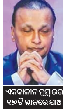
ଏକକାଳୀନ ମୁମ୍ବାଇର ୧୭ଟି ସ୍ଥାନରେ ଚଢ଼ତ

ତଦନ୍ତରୁ ଏହା ମଧ୍ୟ ଜଣାପଡିଛି ଯେ, ଅନେକ ମଧ୍ୟସ୍ତରୀୟ କମ୍ପାନୀଗୁଡ଼ିକ ସମାନ ଠକେଇ କାର୍ଯ୍ୟ କରୁଥିଲେ। ଏହା ସେଲ୍ କମ୍ପାନୀଗୁଡ଼ିକର ନେତୃତ୍ୱ ଏବଂ ସହଯୋଗୀ କାରବାର ବିଷୟରେ ସିବିଆଇର ସହଯୋଗୀ ଅନୁଗାମୀ କମ୍ପାନୀଗୁଡ଼ିକର ନେତୃତ୍ୱ କରାଯାଇଥିଲା, ଯେଉଁମାନଙ୍କର ଆକାଉଣ୍ଟ ପାଣି ଅନ୍ୟତ୍ର ସ୍ଥାନାନ୍ତର ପାଇଁ ବ୍ୟବହୃତ ହୋଇଥିଲା। ଚଢ଼ତ ସମୟରେ, ଏକେନ୍ସି ଅନେକ ଗୁରୁତ୍ୱପୂର୍ଣ୍ଣ କାର୍ଯ୍ୟକ୍ରମ ଏବଂ ଆର୍ଥିକ ରେକର୍ଡ୍ ଜବତ କରିଛି। ସିବିଆଇ କହିଛି ଯେ ସର୍ବାଧିକମାନ କ୍ଷେତ୍ରରେ ବ୍ୟାଙ୍କ ଏବଂ ଭାରତୀୟ ଜାତୀୟ ବାମା ନିଗମର ଅଧିକାରୀ ଆଧାରରେ ଅନିଲ ଅମ୍ବାନୀ ଗ୍ରୁପ୍ ବିରୁଦ୍ଧରେ ୭ଟି ମାମଲା ଚଳାଇଥିଲା।