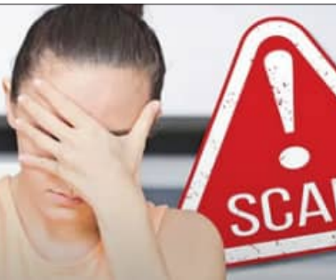
ମେସେଜି ଆସ୍ତରେ କଥା ହେବାକୁ ବାଧ୍ୟ କରୁଛନ୍ତି।

ଏହି ରିପୋର୍ଟରୁ ଜଣାପଡିଛି ଯେ ଅଧିକ ଲୋକମାନେ ଯୁବକମାନଙ୍କ ଠକେଇ ଠକେଇ ଶିକାର ହେବାର ସମ୍ଭାବନା କମ୍ ରହିଛି। ଅପରପକ୍ଷେ ୪୯% ଯୁବକ ଏହି ଠକେଇ ଶିକାର ହେଉଥିଲେ ମଧ୍ୟ କେବଳ ୩୬% ଅଧିକ ଲୋକ ଏହାର ଶିକାର ହୋଇଥିଲେ। ଏଥିରେ ସବୁଠାରୁ ବଡ଼ ବିପଦ ହେଉଛି, ଯେତେବେଳେ ଯୁବବର୍ଗ ପ୍ରଥମ ଥର ପାଇଁ ଏକ ଚାକିରି ବିଜ୍ଞାପନ ଦେଖିଥାନ୍ତି କିମ୍ବା ଯେତେବେଳେ ଜଣେ ଅଜଣା ବ୍ୟକ୍ତି ତାଙ୍କୁ ଚାକିରି ପ୍ରସ୍ତାବ ପଠାଇଥାନ୍ତି। ସେତେବେଳେ ସେମାନେ ଠକେଇ ଜାଲରେ ପିସିସାଧାଆନ୍ତି।