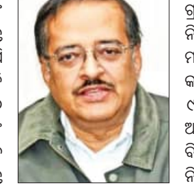
କୋଲକାତା, ୯।୫ (ଏକେନି): ହୁଇ ଦକ୍ଷିଣ