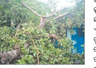
ଯୋଗୁଁ ନୂଆପାଟଣା ମଝିଆଁ ନିକଟ ପୁରୁଣା ପୋଖରୀ ହୁଡ଼ାରେ ଥିବା ଏକ ପୁରୁଣା ବରଗଛ

ତିରିଗିଆ, ୭।୫ (ସମ୍ପାଦକ): ଗୁରୁବାର ଅପରାହ୍ନରେ ତିରିଗିଆ ରୁକ୍ରେ ବିଭିନ୍ନ ଅଞ୍ଚଳରେ କାଳବେଶିଖାର ପ୍ରଭାବ ଦେଖିବାକୁ ମିଳିଛି । ପ୍ରକଳ ବର୍ଷା ଓ ପବନ ଯୋଗୁଁ ନୂଆପାଟଣା ଗ୍ରାମରେ ଏକ ବିରାଟ ଗଛ ଘର ଉପରେ ଭାଙ୍ଗି ପଡ଼ିଥିବା ବେଳେ ଏଥିରୁ ପରିବାର ଲୋକେ ଅଳ୍ପକେ ବର୍ତ୍ତମାନ ରହିଛନ୍ତି । ଘଟଣାରେ କୌଣସି ଧନକ୍ଷତି ନ ଘଟି ହୋଇ ନ ଥିଲେ ସୁଦ୍ଧା ବହୁତ ପରିମାଣର ସମ୍ପତ୍ତି କ୍ଷୟ ହୋଇଥିବା ଜଣାପଡ଼ିଛି । ସୂଚନା ଅନୁଯାୟୀ, ଅପରାହ୍ନରେ ହୋଇଥିବା ଝଡ଼ବର୍ଷା