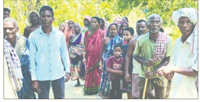
ଫାପୁଲ୍ ଦଳିତ ସାହି ବାସିନ୍ଦା ଏହାକୁ ସହିତ ରୁଚ୍ଚ ଜବରଦଖଲ ହଟାଇବା ପ୍ରତିବାଦ କରି ରାସ୍ତା ଅବରୋଧ କରିବା ପାଇଁ ଦାବି କରିଛନ୍ତି । ଅଭିଯୋଗରୁ

ନିଶ୍ଚିନ୍ତକୋଇଲି ରୁକ୍ ଅଧୀନସ୍ଥ କଳମିଶ୍ର ପଞ୍ଚାୟତ ୧୨ ନମ୍ବର ଖାର୍ଡି କେଣ୍ଡୁରା ଭଗବାନପୁର ଗ୍ରାମ ଦଳିତ ସାହିକୁ ଯାଇଥିବା ରାସ୍ତାଟି ଏବେ ଜବରଦଖଲକାରୀଙ୍କ ଦଳଦଳରେ ରହିଛି । ରାସ୍ତାକୁ ଜବରଦଖଲ କରିଥିବା ପ୍ରଭାବଶାଳୀ ଲୋକମାନଙ୍କଠାରୁ ଏହାକୁ ଉଦ୍ଧାର ପାଇଁ ନିଶ୍ଚିନ୍ତକୋଇଲି ତହସିଲଦାରଙ୍କ ନିକଟରେ ବାରମ୍ବାର ଅଭିଯୋଗ କରାଯାଇଥିଲେ ମଧ୍ୟ କୌଣସି ପଦକ୍ଷେପ ଗ୍ରହଣ କରାଯାଇନାହିଁ । ଫଳରେ