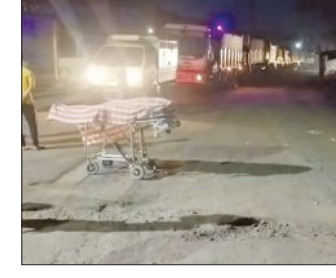
ଗାଡ଼ି ବିରୋଧରେ ଦୁର୍ଘଟଣା କାର୍ଯ୍ୟାନୁଷ୍ଠାନ ଦାବିରେ ସ୍ଥାନୀୟ ଜନସାଧାରଣ ଉତ୍ସାହ ହୋଇ ପ୍ରକାଶକ ଶବ୍ଦକ ବଜାରରେ ହତୁମାନ ମିତର ସମ୍ମୁଖରେ ଶୁକଟକ-ନରସିଂହପୁର ଏକତ୍ର ଗାଡ଼ି ଚାଲି ପାଇଁ ଦାବି କରିଛନ୍ତି । ଏ ଫାକ୍ତୁରୀରେ ତିରିଗିଆ ଥାନାରେ ମାମଲା (ନଂ ୧୩୩୧/୨୨) ରୁଜୁ କରିଥିଲେ । ଅଧିକାରୀ ରାସ୍ତା ନିର୍ମାଣ କ୍ଷତିପୂରଣ ଏବଂ ଦୁର୍ଘଟଣା ଘଟାଇଥିବା

ତିରିଗିଆ, ୭।୫ (ସମ୍ପାଦକ): ତିରିଗିଆ ଥାନା ଅନ୍ତର୍ଗତ ଗୋହିରିମୁଣ୍ଡା ଛକରେ ଏକ ମର୍ତ୍ତ୍ୟୁଦ ସହ ଦୁର୍ଘଟଣାରେ ଜଣେ ଯୁବ ବ୍ୟବସାୟୀଙ୍କ ମୃତ୍ୟୁ ଘଟିଛି । ମୃତକ ଜଣକ