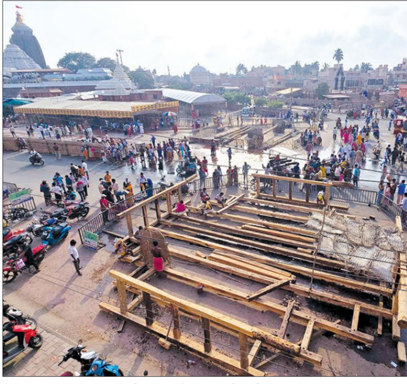
ରଥଖଳା: ଦଣ୍ଡରେ ଲାଗିଲା ପାର୍ଶ୍ୱ ମୁହାଣ, ନିରାଡ଼ି

ରାଜନଗର, ୨୯।୫ (ସମ୍ବିଧ): ଆତ୍ମ ଗୋଟାଇବା ବେଳେ ଦଳିଦେଲା ହାତୀ ମୃତ୍ୟୁର ଖବର ଜଣାଇବାକୁ ଲୋକମାନଙ୍କୁ ଆଶ୍ଚର୍ଯ୍ୟ କରିଥିଲା।