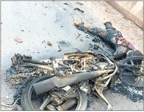
କିଛି ସମୟରେ ଚାଳକ ଚାଳକ ଚଳିଥିବା ଅବସ୍ଥାରେ ଅନ୍ୟ ଜଣଙ୍କ ମୃତ୍ୟୁ

ଦୁର୍ଘଟଣାରେ ଦୁଇଜଣ ଲୋକଙ୍କ ମୃତ୍ୟୁ ଘଟିଥିଲା ଏବଂ ଅନ୍ୟ ଚାଳକଙ୍କୁ ମଧ୍ୟ ଆଘାତ ଘଟିଥିଲା।