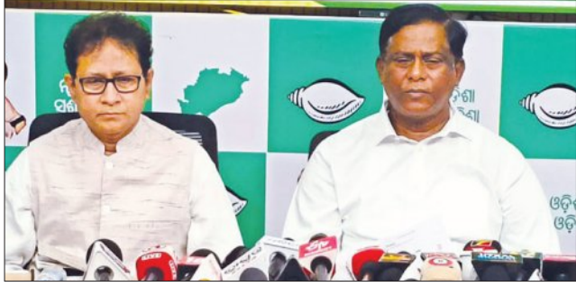
ରାଜ୍ୟରେ ରବିଧାନ ସଂଗ୍ରହ ସମ୍ପୂର୍ଣ୍ଣ ବିପର୍ଯ୍ୟୟ: ବିଜେଡି