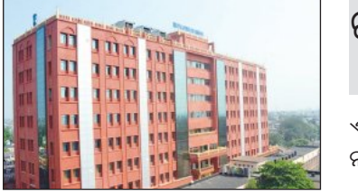
ଦାକ୍ଷିଣ୍ୟ ନେଇ ଗିରଫ ଖଣ୍ଡପାଠ ଏପରି କହିବା ସହ ଆବେଦନକାରୀଙ୍କୁ ବ୍ୟାଙ୍କର କଠୋର ଆଇନ ପ୍ରକ୍ରିୟାକୁ ସାମାଜିକ ଆଖିରେ ଦେଇଛନ୍ତି। ଚାଷୀଙ୍କ ପ୍ରାର୍ଥନାକୁ ଗ୍ରହଣ କରି ହାଇକୋର୍ଟ ମାମଲାର ଅନ୍ତ ଘଟାଇଛନ୍ତି। ‘କାତାଘି କୃଷକ କମିଶନ’ର ରିପୋର୍ଟକୁ ଉଲ୍ଲେଖକରି ଅଧିକାରୀଙ୍କୁ ଶୁଣିବା ପାଇଁ ସମ୍ପୂର୍ଣ୍ଣ ସମ୍ପୂର୍ଣ୍ଣ ସମୟ ପ୍ରଦାନ କରିବାକୁ ନିର୍ଦ୍ଦେଶ ଦେଇଛନ୍ତି।

ଚାଷୀଙ୍କୁ ସମ୍ପୂର୍ଣ୍ଣ ରଣ ରାଶି ଶୁଣିବା ପାଇଁ ଧ୍ୟାନ ସମୟ ପ୍ରଦାନ କରିବାକୁ ହାଇକୋର୍ଟ ନିର୍ଦ୍ଦେଶ ଦେଇଛନ୍ତି। ସେ ଏହି ଟଙ୍କାକୁ ୪ଟି ସମାନ କିଣ୍ଡିରେ ପରିଶୋଧ କରିବେ। ତାଙ୍କୁ ପ୍ରଥମ କିଣ୍ଡି ୧୦ ଲକ୍ଷ ଟଙ୍କା, ଦ୍ୱିତୀୟ କିଣ୍ଡି ୧୫ ଲକ୍ଷ ଟଙ୍କା, ତୃତୀୟ କିଣ୍ଡି ୧୫ ଲକ୍ଷ ଟଙ୍କା, ଚତୁର୍ଥ କିଣ୍ଡି ୧୫ ଲକ୍ଷ ଟଙ୍କା ଦେବାକୁ ନିର୍ଦ୍ଦେଶ ଦେଇଛନ୍ତି। ପ୍ରକାଶ ଥାଇଛି ଗଞ୍ଜାମ ଜିଲ୍ଲାର ଆବେଦନକାରୀ ଚାଷୀ କୃଷି କାର୍ଯ୍ୟ ପାଇଁ ଷ୍ଟେଟ୍ ବ୍ୟାଙ୍କ ଅଫ୍ ଇଣ୍ଡିଆ ବ୍ରହ୍ମପୁର ଶାଖାରୁ ରଣ ନେଇଥିଲେ। ସୁଧ-ମୂଳନିଶାନ୍ତ ବର୍ତ୍ତମାନ ଚାଳକ ମୋଟ ୧୪ଲକ୍ଷ ୬୦ହଜାର ଟଙ୍କା ବାକି ରହିଛି। ଆର୍ଥିକ ଅନାଟନ ଯୋଗୁଁ ସେ ସମୟ ଅନୁସାରେ କିଣ୍ଡି ଶୁଣିପାରିନଥିଲେ। ପଠକରେ ବ୍ୟାଙ୍କ ତାଙ୍କ ସମ୍ପର୍କିତ ଜବତ ପ୍ରକ୍ରିୟା ଆରମ୍ଭ କରିଥିଲା। ଏହାକୁ ଚ୍ୟାଲେଞ୍ଜ କରି ସେ ହାଇକୋର୍ଟଙ୍କ ଚାଲି ଶୁଣିବା ପାଇଁ ଷ୍ଟେଟ୍ ବ୍ୟାଙ୍କ ଯୋଗାଡ଼ କରି ଶୁଣିବା ପାଇଁ କିଛି ସମୟ ମାଗିଥିଲେ। ହାଇକୋର୍ଟ ଏଥିପାଇଁ ଅନୁମତି ପ୍ରଦାନ କରିଛନ୍ତି।