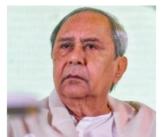
‘ସରକାର ରାଜ୍ୟକୁ ଅପରାଧୀଙ୍କ ହାତକୁ ଟେକି ଦେବା ପରି ଲାଗୁଛି’

■ ଭୁବନେଶ୍ୱର, ୧୯।୫ (ସମ୍ପାଦକ): ବୁଦ୍ଧପୁର ସହରେ ଦିନକତଳେ ଜଣେ ଯୁବକ ଓ ଯୁବତୀଙ୍କୁ ରାଷ୍ଟ୍ର ଉପରେ ମରଣାନ୍ତକ ଆକ୍ରମଣ ଘଟଣାକୁ ନେଇ କଠା ପ୍ରତିକ୍ରିୟା ପ୍ରକାଶ କରିଛନ୍ତି ବିରୋଧୀବଳ ନେତା ନବୀନ ପଟ୍ଟନାୟକ। ଓଡ଼ିଶାରେ ବିଜେପି ଶାସନ ନୁହେଁ, ବରଂ ଗୁଣ୍ଡାଋଜ ଚାଲିଛି ବୋଲି ସାମାଜିକ ଗଣମାଧ୍ୟମ ‘ଏକ୍ସ’ରେ ଘୋର ପ୍ରକାଶ କରିଛନ୍ତି ନବୀନ। ନବୀନ କହିଛନ୍ତି ଯେ ବୁଦ୍ଧପୁରର ବିଦ୍ ରାଷ୍ଟ୍ରରେ ଜଣେ ଯୁବକ ଏବଂ ମହିଳାଙ୍କୁ ସର୍ବସମ୍ମୁଖରେ ଅତି ନିର୍ମମ ଭାବେ ପିଟି ପିଟି ମରଣାନ୍ତକ ଆକ୍ରମଣ କରାଯିବାର ଦୃଶ୍ୟ ଅତ୍ୟନ୍ତ ଅମାଣ୍ଡଳ୍ୟ ଯୋଗୁଁ ଗୁଣ୍ଡାଋଜ ଚାଲିଛି। ସାରା ଓଡ଼ିଶାବାସୀଙ୍କୁ ଏହା ଆତଙ୍କିତ କରିବାର ବିଚଳିତ କରିଛି। ଲାଗୁଛି ବିଜେପି ଅତ୍ୟନ୍ତ ଖର୍ବକାତର।