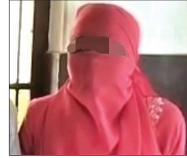
ସହ ଅଧ୍ୟାୟ ଗାଧାରେ ଗାଳିଗୁଲକ କରିଥିଲେ। ନାବାଳିକା ଓ ତାଙ୍କ ବାପାଙ୍କ ପାଖକୁ ଏତଲା ରଖିବା ବଦଳରେ ଅଭିଯୋଗ ବଦଳାଇବାକୁ

ପାଖରେ ନ୍ୟାୟ ପାଇଁ ହାରଣ ହୋଇଥିଲେ। କିନ୍ତୁ, ଆନର ଜଣେ ମହିଳା ସରକାରଙ୍କୁ ଚାଲି ଚାଲି ନାବାଳିକାକୁ ଧମକତମ ଦେବା