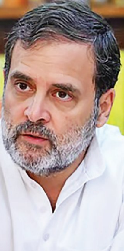
ହେବାକୁ ଯାଉଛି । କର୍ତ୍ତାକର ମଧ୍ୟ ସିଦ୍ଧପେୟା ଏବଂ ଶିବକୃପାଳଙ୍କ ମଧ୍ୟରେ ଏପିଡି ଛଳାପକ୍ଷା ହୋଇଥିଲା ।

ଗ୍ରହଣୀୟ ନୁହେଁ । ରାଜ୍ୟକୁ ପକ୍ଷରୁ କୁହାଯାଇଥିଲା ଯେ ବେଶ୍ଟଗୋପାଳ ମୁଖ୍ୟମନ୍ତ୍ରୀ ହେଲେ ସତ୍ୟଶିଖରଙ୍କୁ ମନ୍ତ୍ରିମଣ୍ଡଳରେ ଗୁରୁତ୍ୱପୂର୍ଣ୍ଣ ଦାୟିତ୍ୱ ମିଳିବ । କିନ୍ତୁ ସେ ମାନିବାକୁ ପ୍ରସ୍ତୁତ ନୁହଁନ୍ତି । ଅନ୍ୟପକ୍ଷରେ ବେଶ୍ଟଗୋପାଳଙ୍କୁ ନେଇ ମଧ୍ୟ ହାଇକମାଣ୍ଡ ଚିନ୍ତାରେ ଅଛନ୍ତି । ତାଙ୍କୁ ମୁଖ୍ୟମନ୍ତ୍ରୀ କରାଗଲେ ରାଜ୍ୟରେ ପୁଣି ଦୁଇଟି ଉପନିର୍ବାଚନ ହେବ । ବେଶ୍ଟଗୋପାଳ ଲୋକସଭା ସାଂସଦ ଥିବାରୁ ମୁଖ୍ୟମନ୍ତ୍ରୀ ହେଲେ ତାଙ୍କୁ ବିଧାନସଭାକୁ ନିର୍ବାଚିତ ହେବାକୁ ପଡ଼ିବ । ପୁଣି ସେ ଲୋକସଭା ସଭ୍ୟ ପଦରୁ ଇସ୍ତଫା ଦେବେ । ତେଣୁ ଉଭୟ ଲୋକସଭା ଏବଂ ବିଧାନସଭା ଆସନରେ ସାଜି ନିର୍ବାଚନ ହେବ । ଏହାପରେ ହାଇକମାଣ୍ଡ ବେଶ୍ଟଗୋପାଳଙ୍କୁ ବୁଝାଇଛନ୍ତି । କିନ୍ତୁ ସେ ମୁଖ୍ୟମନ୍ତ୍ରୀ ହେବାକୁ ଜିଏ ଧରିଥିବାରୁ ହାଇକମାଣ୍ଡ ଅତୁଆରେ ପଡ଼ିଯାଇଛନ୍ତି । କେରଳରେ କର୍ତ୍ତାକର ଭଳି ପରିସ୍ଥିତି ସୃଷ୍ଟି