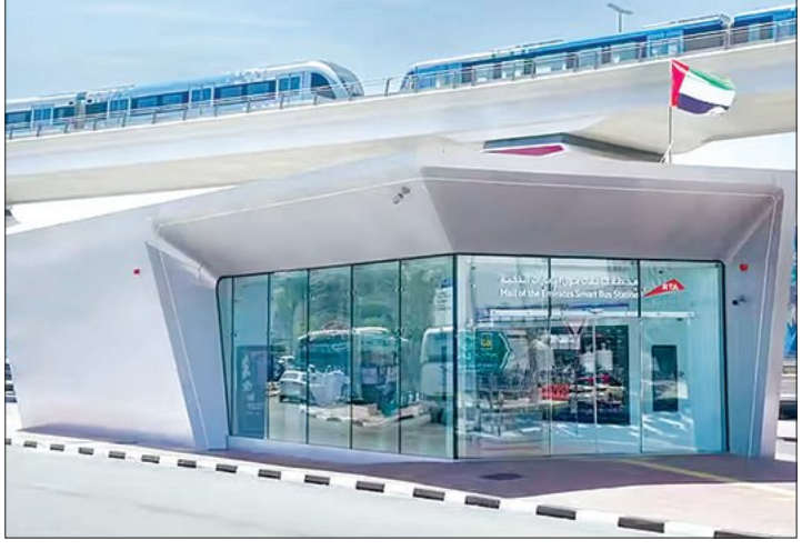
ଉପକ୍ରମଣା ବିଷୟରେ ସୂଚନା ପ୍ରଦାନ କରୁଥିବା ଏଆଇ ଚାଳିତ ସ୍ମାର୍ଟ ବସ୍ ସେସନର ଉଦ୍ଘାଟନ କରାଯାଇଛି। ଏହା ଦ୍ୱାରା ଦୁବାଇର ପ୍ରଥମ ଏଆଇ ଚାଳିତ ସ୍ମାର୍ଟ ବସ୍ ସେସନର ଉଦ୍ଘାଟନ ହେବ।

■ ଦୁବାଇ, ୧୧ମ (ଏକେଡି): ଦୁବାଇରେ ଦୁବାଇ ଆଇ ଏକ ବଡ଼ ସମ୍ପର୍କ ହାସଲ କରିଛି। ଦୁବାଇର ରୋଡ୍ ଆଣ୍ଡ ଟ୍ରାନ୍ସପୋର୍ଟ ଅଥରିଟି ପକ୍ଷରୁ ମଲ୍ ଅଫ୍ ଦି ଏମିରେଟ୍ସ ଠାରେ ବିଶ୍ୱର ପ୍ରଥମ ସମ୍ପୂର୍ଣ୍ଣ ଏଆଇ ଚାଳିତ ସ୍ମାର୍ଟ ବସ୍ ସେସନର ଉଦ୍ଘାଟନ କରାଯାଇଛି। ଏହି ଅତ୍ୟାଧୁନିକ ସେସନରେ କୃତ୍ରିମ ବୁଦ୍ଧିମତା (ଏଆଇ) ଏବଂ ୨୪ ଘଣ୍ଟା ଡିଜିଟାଲ୍ ସେବାର ବ୍ୟବସ୍ଥା ରହିଛି। ଏହି ସେସନଟି ଆଧୁନିକ ବୈଷୟିକ ଜ୍ଞାନକୌଶଳରେ ସଜ୍ଜିତ। ଏହାର ବିଶେଷତ୍ୱ ମଧ୍ୟରେ ଏଆଇ କମ୍ପାନୀର ଓ ମନିଟରିଂ ରହିଛି। ସେସନରେ ଏଆଇ-ଚାଳିତ କମ୍ପାନୀର ଲଗାଯାଇଛି। ଏହା ଭିତ୍ତି ନିୟନ୍ତ୍ରଣ କରିବା ସହ ଯାତ୍ରୀଙ୍କ ଯାତାୟତ ଏବଂ ସୁରକ୍ଷା ଉପରେ ନଜର ରଖିବା ସହ ସେସନର ଉପଯୋଗ କରିବାକୁ ଯୋଗ୍ୟ କରିବାକୁ ଯୋଜନା କରାଯାଇଛି। ଏହା ଦ୍ୱାରା ଦୁବାଇର ପ୍ରଥମ ଏଆଇ ଚାଳିତ ସ୍ମାର୍ଟ ବସ୍ ସେସନର ଉଦ୍ଘାଟନ ହେବ। ଏହା ଦ୍ୱାରା ଦୁବାଇର ପ୍ରଥମ ଏଆଇ ଚାଳିତ ସ୍ମାର୍ଟ ବସ୍ ସେସନର ଉଦ୍ଘାଟନ ହେବ। ଏହା ଦ୍ୱାରା ଦୁବାଇର ପ୍ରଥମ ଏଆଇ ଚାଳିତ ସ୍ମାର୍ଟ ବସ୍ ସେସନର ଉଦ୍ଘାଟନ ହେବ।