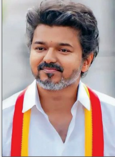
ରାଜ୍ୟପାଳ ଦୁଇ ଥର ବିଜୟକୁ ରାଜଭବନରୁ ଫେରାଇଦେଇଥିଲେ। ଏହାକୁ ନେଇ ରାଜ୍ୟ ଓ...

ଚେନ୍ନାଇ, ୮।୫ (ଏକେନ୍ଦ୍ରି): ସିନେମା ପରଦାର ଲୋକପ୍ରିୟ ନାୟକ ଜନନାୟକ ସାଜିଥିବା 'ତାମିଲନାଡୁରେ ବିଜୟ ଅଭିଯାନ' (ଟିଭିକେ) ମୁଖ୍ୟ ବିଜୟ ତାମିଲନାଡୁର ସିନେମା ଆରୋହଣ କରିବାକୁ ଯାଉଛନ୍ତି।