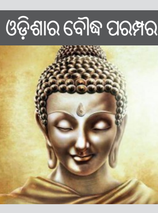
ଓଡ଼ିଶାର ବୌଦ୍ଧ ପରମ୍ପରା

ଧାରେ ଧାରେ ଏହି ଅଞ୍ଚଳକୁ ପ୍ରବେଶ କରି ସାରିଥିଲା ଏବଂ ଅଶୋକଙ୍କ ଆକ୍ରମଣ ବେଳକୁ ଲୋକମାନଙ୍କର ଧାର୍ମିକ ଭାବନା ତଥା ସାମାଜିକ ସଂରଚନାକୁ ପ୍ରଭାବିତ କରିସାରିଥିଲା । ମାତ୍ର ପ୍ରିୟଦର୍ଶୀ ଅଶୋକଙ୍କ ଶାସନ କାଳରେ ହିଁ ବୌଦ୍ଧ ଧର୍ମର ବିଭିନ୍ନ ସଂପ୍ରଦାୟ ସେମାନଙ୍କର ଆଚାର୍ଯ୍ୟ ମାନଙ୍କର ସମୃଦ୍ଧ ତଥା ବ୍ୟବସ୍ଥିତ ପ୍ରଚାର ପ୍ରସାର ଯୋଗୁଁ କଳିଙ୍ଗରେ ଏହା ଉଲ୍ଲେଖନୀୟ ଅଗ୍ରଗତି ହାସଲ କରିଥିଲା । ଅଶୋକଙ୍କ ଭାଇ ତିସ (ତିଷ୍ୟ) କଳିଙ୍ଗକୁ ତାଙ୍କର ଅବସର ନେବା ସ୍ଥାନ ଭାବେ ବାଛି ଥିଲେ ଏବଂ ସମ୍ରାଟ ତାଙ୍କ ପାଇଁ ଏଠାରେ 'ଭୋଜକଗିରି' ବିହାର ନାମରେ ଏକ ବିଶାଳ ବୌଦ୍ଧବିହାର ନିର୍ମାଣ କରିଥିଲେ । ଏହି ତଥା ଅନୁସ୍ମୃତିର କିଛି ଅନୁଗ୍ରହଣ ହୋଇଥିଲା । ମହାସଂହିକ ଆଚାର୍ଯ୍ୟ ମହାଦେବ ମଧ୍ୟ କଳିଙ୍ଗ ଆସିଥିଲେ । ତାହାର ଅଙ୍କନାତ୍ମକ ପରେ ଧୂତିକ ମଧ୍ୟ କଳିଙ୍ଗ ଆସିଥିଲେ । ସେ ଥିଲେ ସର୍ବାସ୍ଥିତ ଶାଖାର ଦୁଇ ବିଖ୍ୟାତ ଆଚାର୍ଯ୍ୟ ମଧ୍ୟାନ୍ତିକ ଓ ଉତ୍ତରପୁସ୍କର ଆଧ୍ୟାତ୍ମିକ ଉତ୍ତରାଧିକାରୀ । ସେ ତାଙ୍କର ସମଗ୍ର