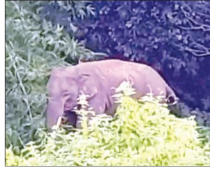
ଆଖପାଖ ସାହିରେ ଘର ଚାଟି-ବାଟି ଭାଙ୍ଗି ଧାନ ବଖାରି ଓ ଚାଉଳ ଖାଇଯାଇଛି। ରାତିରେ ହାତୀ ଭୟରେ ଲୋକେ ଶୋଇପାରୁ ନାହାନ୍ତି। ଚାନ୍ଦିପୁର ବିଏ ନିକଟସ୍ଥ ବାସିନ୍ଦା କହିଛନ୍ତି, ଗତକାଳ ରାତିରେ ଆମ ଚାଟି ଭାଙ୍ଗିଯାଇଛି।

ଗୋଟିଏ ଦନ୍ତା ହାତୀ ଗତ ଦୁଇ ଦିନ ହେଲା ଚାନ୍ଦିପୁର ଅଞ୍ଚଳରେ ଉପଦ୍ରବ ସୃଷ୍ଟି କରିଛି। କେତେବେଳେ ସ୍କୁଲ ଭିତରେ ପଶି ଝାଡ଼ି ଭାଙ୍ଗି ତ କେତେବେଳେ କାହା ଘର ଚାଟି। ଏମିତି ଚାନ୍ଦିପୁର ରାସ୍ତାରେ ବୁଲି ବୁଲି ବେକାରୁମି ଧରିଯାଇଛି ଦନ୍ତା ହାତୀ। ହାତୀଟି ଏବେ ଚାନ୍ଦିପୁରର କାଳୁ ଜଙ୍ଗଲ ଭିତରେ ପଶିଯାଇଥିବା ବେଳେ ମଝିରେ ମଝିରେ ଝାଡ଼ିଜଙ୍ଗଲକୁ ମଧ୍ୟ ଚାଲିଯାଉଥିବା ଜଣାପଡ଼ିଛି। ଲୋକେ ଭୟଭୀତ ଥିବାବେଳେ ବନ ବିଭାଗ କର୍ମଚାରୀ ହାତୀକୁ ଖୋଜିବାରେ ଲାଗିଛନ୍ତି। କାଳୁ ଜଙ୍ଗଲ ସହ ଚାନ୍ଦିପୁର ବେକାରୁମି ନିକଟ ଝାଡ଼ି ଜଙ୍ଗଲରେ ହାତୀକୁ ଖୋଜା ଯାଉଛି। ହାତୀଟି ଏହା ହେଲେ ବାହାରିବ। ସ୍ଥାନୀୟ ସ୍ତ୍ରୀରୁ ମିଳିଥିବା ସୂଚନା ଅନୁସାରେ, ହାତୀଟି ଚାନ୍ଦିପୁର ଓ ଆଖପାଖ ସାହିରେ ଘର ଚାଟି-ବାଟି ଭାଙ୍ଗି ଧାନ ବଖାରି ଓ ଚାଉଳ ଖାଇଯାଇଛି। ରାତିରେ ହାତୀ ଭୟରେ ଲୋକେ ଶୋଇପାରୁ ନାହାନ୍ତି। ଚାନ୍ଦିପୁର ବିଏ ନିକଟସ୍ଥ ବାସିନ୍ଦା କହିଛନ୍ତି, ଗତକାଳ ରାତିରେ ଆମ ଚାଟି ଭାଙ୍ଗିଯାଇଛି।