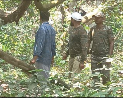
ପିଲାମାନେ ତରଳ କାନ୍ଥରେ ଘର ଚାଟି-ବାଟି ଭାଙ୍ଗି ଧାନ ବଖାରି ଓ ଚାଉଳ ଖାଇଯାଇଛି। ରାତିରେ ହାତୀ ଭୟରେ ଲୋକେ ଶୋଇପାରୁ ନାହାନ୍ତି। ଚାନ୍ଦିପୁର ବିଏ ନିକଟସ୍ଥ ବାସିନ୍ଦା କହିଛନ୍ତି, ଗତକାଳ ରାତିରେ ଆମ ଚାଟି ଭାଙ୍ଗିଯାଇଛି।

ହାତୀ ଆଗ୍ରାମ ମାର୍ଗେଣା ସୋର ହୋଇ ଏପକ୍ଷ ଅସିଛି। ଜଙ୍ଗଲ ଅତ୍ୟନ୍ତ ଘଷ ଓ ବିସ୍ତୃତ ଥିବାରୁ ହାତୀକୁ ଡାକ କରିବାରେ ସମୟ ଲାଗୁଛି। ଆମ ଚିମ୍ପି ଦିନ-ରାତି ନକର ରଖିଛନ୍ତି। ସେ ସମୟ ସମୟରେ ବାହାରକୁ ବାହାରିବ। ତାପରେ ହାତୀକୁ ସୁରକ୍ଷିତ ଭାବେ ଜଙ୍ଗଲକୁ ଫେରାଇବା ପାଇଁ ଆମେ ଚେଷ୍ଟା କରୁଛୁ। ବନ ବିଭାଗ ପକ୍ଷରୁ ସ୍ଥାନୀୟ ଲୋକଙ୍କୁ ସହାୟା ଯୋଗ୍ୟ ପରେ ଜଙ୍ଗଲ ଓ ବିଏ ଅଞ୍ଚଳକୁ ନ ଯିବାକୁ ପରାମର୍ଶ ଦିଆଯାଇଛି। ପ୍ରାଣ ବିଶେଷତ୍ୱ ମତରେ ଦନ୍ତା ହାତୀମାନେ ସାଧାରଣତଃ ଦଳରୁ ଅଲଗା ହୋଇ ଖାଦ୍ୟ ସମ୍ପାଦନେ ଜନସମୂହ ମୁହାଁ ହୋଇଥାନ୍ତି। ଚାନ୍ଦିପୁର ଅଞ୍ଚଳରେ କାଳୁ, ଧାନ ଓ ଚାଉଳ ସହଜରେ ମିଳୁଥିବାରୁ ହାତୀଟି ଏଠାରେ ରହିଯାଇଛି। ଉଦ୍ଘୋଷିତ କଲେ ହାତୀ ଝିମ୍ସ ହୋଇପାରେ। ତେଣୁ ଲୋକେ ସତରତ ରହିବା ଉଚିତ।