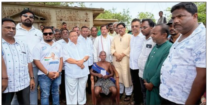
ପ୍ରକାଶ କରିଛନ୍ତି ପ୍ରତିନିଧି ଦଳ। ସେହିପରି ପୂର୍ବତନ ପିପିସି ସଭାପତି କହନେବ ଜେନା ମଧ୍ୟ ଏହି ଘଟଣାକୁ ପ୍ରଶ୍ନମଧ୍ୟ ଗଭୀର ଭାବେ ତଦନ୍ତ କରନ୍ତୁ ଏବଂ ମୃତକ ପରିବାରକୁ

ଫିଲ୍ମିଂ ଉପରେ ପୁଲିସକୁ ଆକ୍ରମଣ; ୩ ପୁଲିସ ଗୁରୁତର ଫିଲ୍ମିଂ ଉପରେ ପୁଲିସକୁ ଆକ୍ରମଣ; ୩ ପୁଲିସ ଗୁରୁତର