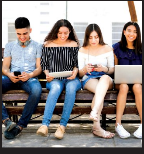
ମୃତ୍ୟୁ ସହିତ କଡ଼ିତ ଶବ୍ଦ ହେଉଛି 'ଜେଡ୍'। ହେଲେ 'ଏହା ଜେନ୍ ଜେଡ୍‌ଙ୍କ ମଧ୍ୟରେ ହୁଏ ହୁଏ ପାଗଳ ହୋଇଯିବ।

ନଚେତ୍ ଲକ୍ଷ୍ୟ ଅନୁଭବ କଲେ ସେମାନେ ବ୍ୟବହାର କରନ୍ତି। ଅନ୍ୟପେଟ 'କ୍ଲିନ୍' ଶବ୍ଦର ଅର୍ଥ ଶାନ୍ତି ବୋଲି ବାଣୀଥିଲେ ସେମାନେ ଏହାକୁ ଆମ୍ବିଶ୍ୱାସ ଲାଗି ବ୍ୟବହାର କରନ୍ତି। କୌଣସି ଜିନିଷ ପ୍ରତି ଆକର୍ଷିତ ହେବା ଲାଗି 'ରିଜ୍' କହନ୍ତି। ତେବେ 'ହାଇକ୍'କୁ ଆରମ୍ଭ କରୁଥିବା ବ୍ୟକ୍ତି ପାଇଁ ସେମାନେ ବ୍ୟବହାର କରନ୍ତି। ଏଭଳି ଆତ୍ମୀ ଅନେକ ଶବ୍ଦ ଅଛି, ଯାହାକୁ ଜେନ୍ ଜେଡ୍ ସର୍ବପ୍ରମରେ ବ୍ୟବହାର କରୁଛନ୍ତି।