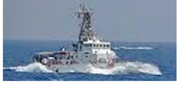
ଆବାହାନ ଆକର୍ଡ୍ ସହ ଯୋଡ଼ିବାକୁ ମଧ୍ୟ ପ୍ରୟାସ କରୁଛନ୍ତି । ଏହି ସାମିତ ଆକ୍ରମଣ ପରେ ବର୍ତ୍ତମାନ ପାଇଁ ପରିସ୍ଥିତି ଶାନ୍ତ ପଡ଼ିଛି ।

ଆମେରିକାର ସୁକ୍ଷ୍ମବିମାନକୁ ଟାର୍ଗେଟ୍ କରିବା ପରେ ଆମେରିକା ସେନା ଜବାବା କାର୍ଯ୍ୟାନୁଷ୍ଠାନ ସ୍ୱରୂପ ସେହି ଲକ୍ଷ୍ୟକୁ ସମ୍ପୂର୍ଣ୍ଣ ଭାବେ ଉଡ଼ାଇ ଦେଇଛି । ପେଶାବର ସୁତ ଅନୁଯାୟୀ, ଏହି ଆକ୍ରମଣ ସାମିତ ଥିଲା ଏବଂ ଏହାଦ୍ୱାରା ଭରାନ ସହ ଚାଲିଥିବା ଶାନ୍ତି ଆଲୋଚନା ବା ଅସ୍ତ୍ରବିରତି ଶେଷ ହୋଇନାହିଁ । ଏହି ସାମରିକ ଚିତ୍କାର ମଧ୍ୟରେ ଆମେରିକା ରାଷ୍ଟ୍ରପତି ତୋନାକୁ ଟ୍ରମ୍ପ ନିଜର ସୋସିଆଲ ମିଡ଼ିଆ ପ୍ଲାଟଫର୍ମରେ ଏକ ବଡ଼ ବୟାନ ଦେଇଛନ୍ତି । ସେ ଭରାନର ସମସ୍ତ ସମ୍ପୂର୍ଣ୍ଣ ଯୁଦ୍ଧନିୟମକୁ 'ପରମାଣୁ ଧୁଳି' ବୋଲି ଅଭିହିତ କରିଛନ୍ତି । ସେ କହିଛନ୍ତି ଯେ, ଶାନ୍ତି ରୁକ୍ତ ପାଇଁ ଭରାନକୁ ନିଜର ସମସ୍ତ ଯୁଦ୍ଧନିୟମ ନଷ୍ଟ କରିବାକୁ ହେବ କିମ୍ବା ଅନ୍ତର୍ଜାତୀୟ ନିରାକ୍ଷଣରେ ଏହାକୁ ଆମେରିକା ହାତକୁ ହସ୍ତାନ୍ତର କରିବାକୁ ପଡ଼ିବ । ସେ ଏହି ଶାନ୍ତି ପ୍ରକ୍ରିୟାକୁ