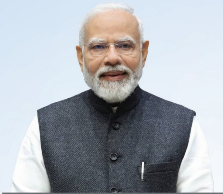
ଶ୍ରୀ ନରେନ୍ଦ୍ର ମୋଦୀ ମାନ୍ୟବର ଭାରତର ପ୍ରଧାନମନ୍ତ୍ରୀ