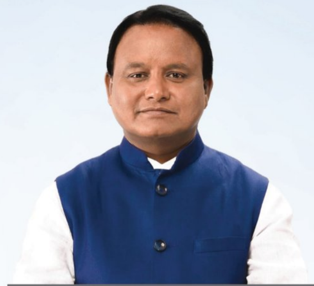
ଶ୍ରୀ ମୋହନ ଚରଣ ମାଝୀ ମାନ୍ୟବର ମୁଖ୍ୟମନ୍ତ୍ରୀ, ଓଡ଼ିଶା