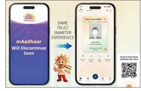
ନୂଆ ଆଧାର ଆପ୍ ଲାନ୍ଚ ହେବା ପରେ ପୁରୁଣା ଆପ୍ ବନ୍ଦ ହେବ ।

କେବଳ ଆବଶ୍ୟକୀୟ ସୂଚନାକୁ ଏକ ସୁରକ୍ଷିତ କ୍ୟୁଆର୍ କୋଡ୍ ମାଧ୍ୟମରେ ସେୟାର କରିପାରିବେ । ପୂର୍ବରୁ କେବଳ ଓଡିପି ଉପରେ ନିର୍ଭର କରିବାକୁ ପଡୁଥିବା ବେଳେ ଏବେ ସୁରକ୍ଷା ପାଇଁ ଏଥିରେ ଓଡିପି ସହିତ ମୁଖ୍ୟ ଟିକ୍ଟର୍ (ପ୍ରେମ୍‌ଅପ୍ରେକ୍‌ସେନ୍) ଏବଂ କ୍ୟୁଆର୍ କୋଡ୍ ଯାଞ୍ଚ ଅତିରିକ୍ତ ଭାବେ ଯୋଡ଼ାଯାଇଛି । ଗ୍ରାହକମାନେ ନିଜର ଆକ୍ରମିତ ଟିକ୍ଟର୍, ମୁଖ ଏବଂ ଆଖିର ସ୍କାନ ତଥ୍ୟକୁ ନିଜ ଆପ୍ ମାଧ୍ୟମରେ ଲକ୍ କିମ୍ବା ଅନଲକ୍ କରିପାରିବେ । ଏହାଦ୍ୱାରା ଅନ୍ୟ କେହି ଏହାର ଅପବ୍ୟବହାର କରିପାରିବେ ନାହିଁ । ଏହି ପରିବର୍ତ୍ତନ ସହିତ ସରକାରଙ୍କ ପକ୍ଷରୁ ଜନସାଧାରଣଙ୍କ ପାଇଁ ମାରଣ ଆଧାର ଦଲିଲ ଅପଡେଟ୍ ସେବାକୁ ବୃଦ୍ଧି କରାଯାଇଛି । ପୂର୍ବରୁ ଏହି ସେବା ୨୦୨୬ ଜୁନ ୧୫ ପର୍ଯ୍ୟନ୍ତ ମାରଣୀ ଥିବା ବେଳେ ଏବେ ଏହାକୁ ୨୦୨୬ ଜୁନ ୧୫ ପର୍ଯ୍ୟନ୍ତ ପର୍ଯ୍ୟନ୍ତ ବଢ଼ାଇ ଦିଆଯାଇଛି । ଗ୍ରାହକମାନେ ମାଲ୍-ଆଧାର ପୋର୍ଟାଲକୁ ଯାଇ ନିଜର ପରିଚୟ ଏବଂ ଠିକଣା ପତ୍ର ମାରଣୀରେ ଅପଡେଟ୍ କରିପାରିବେ ।