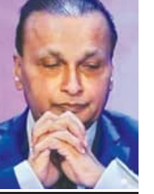
ଏକକାଳୀନ ମୁମ୍ବାଇର ୧୭ଟି ସ୍ଥାନରେ ଯାଞ୍ଚ

■ ମୁମ୍ବାଇ, ୯।୫ (ଏକେନି): ଏକ ଘଟଣାକ୍ରମେ କେନ୍ଦ୍ରୀୟ ଚଳଚ୍ଚିତ୍ର ନିର୍ଦ୍ଦେଶକ ସିବିଆଇ ଶନିବାର ୨୭ ହଜାର କୋଟି ଟଙ୍କାର ଠକେଇ ମାମଲାର ଅନୀଲ ଅମ୍ବାନୀଙ୍କ ଠିକାସବୁ ଏଡିଏ ଗ୍ରୁପ୍ ସହିତ ଜଡ଼ିତ କମ୍ପାନୀଗୁଡ଼ିକ ଉପରେ ଚଢ଼ଉ କରିଛି । ଚଳଚ୍ଚିତ୍ର ନିର୍ଦ୍ଦେଶକ ସିବିଆଇ ୧୭ଟି ସ୍ଥାନରେ ଏକକାଳୀନ ଚଢ଼ାଉ କରିଥିଲା, ଯାହା ବ୍ୟାଙ୍କ ଠକେଇ ଏବଂ ଅନ୍ୟତ୍ର ପାଣି ସ୍ଥାନାନ୍ତର କରିବା ମାମଲା ସହିତ ଜଡ଼ିତ । ସିବିଆଇର ଏହି କାର୍ଯ୍ୟାନୁଷ୍ଠାନ ଠିକାସବୁ ଗ୍ରୁପ୍ ତିନି କମ୍ପାନୀ ଠିକାସବୁ ଟେଲିକମ୍ ଲିମିଟେଡ୍, ଠିକାସବୁ କମ୍‌ସିଆଲ୍ ପାଲନାନ୍ ଲିମିଟେଡ୍ ଏବଂ ଠିକାସବୁ ହୋମ୍ ପାଲନାନ୍ ଲିମିଟେଡ୍ ସହିତ ଜଡ଼ିତ । ସିବିଆଇ ସନ୍ଦେହ କରୁଛି ଯେ, ବ୍ୟାଙ୍କଗୁଡ଼ିକରୁ ଉଠାଯାଇଥିବା ଟଙ୍କା ଅନ୍ୟତ୍ର ସ୍ଥାନାନ୍ତର