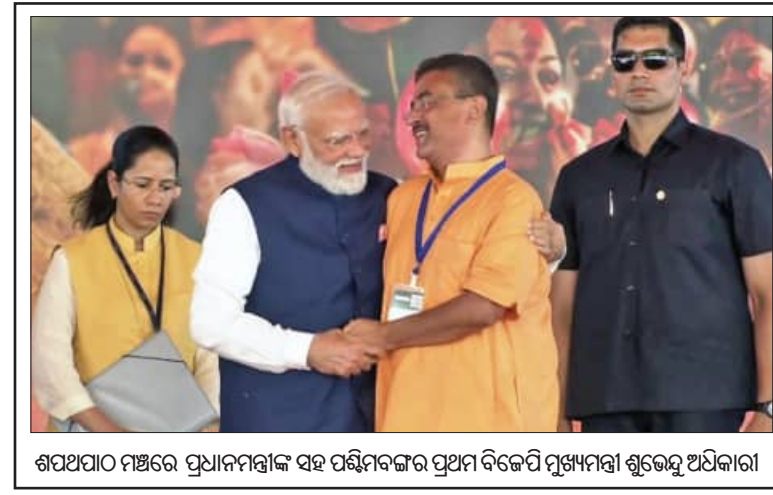
ଶପଥପାଠ ମଧ୍ୟରେ ପ୍ରଧାନମନ୍ତ୍ରୀଙ୍କ ସହ ପଶ୍ଚିମବଙ୍ଗର ପ୍ରଥମ ବିଜେପି ମୁଖ୍ୟମନ୍ତ୍ରୀ ଶୁଭେନ୍ଦୁ ଅଧିକାରୀ

୮ ବିଲିୟନ ଡଲାରରୁ ଅଧିକ ଅର୍ଥ ଠୋକାଉଛନ୍ତି । ଶ୍ରମିକ ବହିଷ୍କୃତ ହେବା ପାକିସ୍ତାନରୁ ଅର୍ଥନୀତି ପାଇଁ ଏକ ବଡ଼ ଝଟକା ସାଧ୍ୟତା ହୋଇଛି । ଯୁଏଏ ଏହି ବିଷୟରେ କୌଣସି ସ୍ପଷ୍ଟ ସୂଚନା ଦେଇ ନଥିବା ବେଳେ ପାକିସ୍ତାନ ଏହାକୁ ଏକ ବଡ଼ ଧରଣର ବହିଷ୍କାର ବୋଲି ମାନିବାକୁ ମନା କରିଛି । ତେବେ ଉପସାହାରୀୟ ଅଞ୍ଚଳରେ ବହୁଥିବା ଅସ୍ଥିତରା ମଧ୍ୟରେ ଏହି ଘଟଣା ଦୁଇ ଦେଶର ସମ୍ପର୍କରେ ପାର୍ଟ ସୃଷ୍ଟି କରିଛି ।