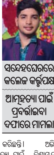
ସମ୍ବେଦରେ କଲେଜ କର୍ତ୍ତୃପକ୍ଷ ଆତ୍ମହତ୍ୟା ପାଇଁ ପ୍ରବର୍ତ୍ତାଇବା ଦତ୍ତାରେ ମାମଲା

ପ୍ରବର୍ତ୍ତାଇବା ଭଳି ସମ୍ବନ୍ଧ ଦତ୍ତାରେ ଏକ ମାମଲା ରୁଜୁ କରିଛି। ଏହାସହ ସାଲ୍‌ସିପିକ୍ ଟିମ୍ ସହାୟତାରେ ଘଟଣାସ୍ଥଳରେ ତଦନ୍ତ କରିଛି। ଭୁମର ଉଚ୍ଚତା, ଓସାର, ଚଟାଣଠାରୁ ପ୍ୟାନ ଉଚ୍ଚତା ଓ ଅନ୍ୟାନ୍ୟ ମାତ୍ରତ୍ୱ କରିଛି। ଏଥିସହ ହଷ୍ଟେଲ ଅନ୍ତେବାସୀ, ଝୁଲଣା ଅବସ୍ଥାରେ ଉଚ୍ଚତା ସମୟରେ ଉପସ୍ଥିତ ଥିବା କର୍ତ୍ତୃପକ୍ଷ ଓ ସହପାଠୀଙ୍କ ବୟାନ ରେକର୍ଡ କରିଛି। ବିଶ୍ୱାସକ ମୃତଦେହ ବ୍ୟବହାର କରିବା ପରେ ପରିବାରଲୋକଙ୍କୁ ହସ୍ତାନ୍ତର କରିଛି।