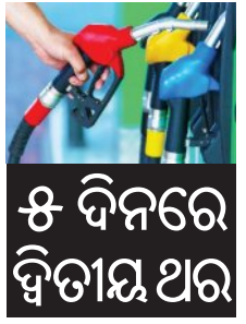
୫ ଦିନରେ ଦ୍ୱିତୀୟ ଥର

■ ନୂଆଦିଲ୍ଲୀ, ୧୯।୫ (ଏକ୍ସପ୍ରେସ୍): ଗତ ଶୁକ୍ରବାର ଦେଶବ୍ୟାପୀ ତେଲ ଦରରେ ୩ ଟଙ୍କା ବୃଦ୍ଧି ହେବାର ଠିକ୍ ୫ ଦିନ ପରେ, ସୋମବାର ତେଲ କମ୍ପାନୀଗୁଡ଼ିକ ପୁଣିଥରେ ପେଟ୍ରୋଲ ଏବଂ ଡିଜେଲ ଦର ବଢ଼ାଇଛନ୍ତି। ତଳିତ ସମ୍ବାହରେ ଦିନିକି ଦିନ ପାଇଁ ତେଲ ଦର ଲିଟର ପିଛା ପ୍ରାୟ ୯୦ ପଇସା ପର୍ଯ୍ୟନ୍ତ ବୃଦ୍ଧି ପାଇଛି। ଦିଲ୍ଲୀରେ ପେଟ୍ରୋଲ ଲିଟର ପିଛା ୮୬ ପଇସା ବଢ଼ି ୯୮.୬୪ ଟଙ୍କା ଏବଂ ଡିଜେଲ ୯୧ ପଇସା ବଢ଼ି ୯୧.୫୮ ଟଙ୍କା ହୋଇଛି। କୋଲକାତାରେ ପେଟ୍ରୋଲ ଦର ସବୁଠାରୁ ଅଧିକ ୯୬ ପଇସା ବୃଦ୍ଧି ପାଇ ୧୦୯.୬୦ ଟଙ୍କା ଏବଂ ଡିଜେଲ ୯୪ ପଇସା ବଢ଼ି ୯୬.୦୬ ଟଙ୍କା ହୋଇଛି। ସେହିପରି ଚେନ୍ନାଇରେ ପେଟ୍ରୋଲ ୮୨ ପଇସା ବୃଦ୍ଧି ସହ ୧୦୪.୪୯ ଟଙ୍କା ଏବଂ ଡିଜେଲ ୮୬ ପଇସା ବୃଦ୍ଧି ପାଇ ୯୬.୧୧ ଟଙ୍କା ହୋଇଛି। ଏହା ସହିତ ଦିଲ୍ଲୀରେ ସିଏନଡି ଦର ମଧ୍ୟ କିଲୋଗ୍ରାମ ପିଛା ୨ ଟଙ୍କା ବୃଦ୍ଧି ପାଇ ୮୬ ଟଙ୍କାରେ ପହଞ୍ଚିଛି। ସେହିଭଳି ଭୁବନେଶ୍ୱରରେ ପେଟ୍ରୋଲ ଦର ଲିଟର ପିଛା ୧୦୫ ଟଙ୍କା ୨୬ ପଇସା ବୃଦ୍ଧି ପାଇଛି।