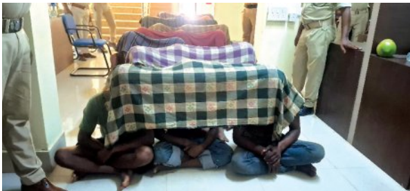
ବସ୍ତାରେ ଶବ ପୁରାଇ ଜଙ୍ଗଲରେ ଘୋଡ଼ିଥିଲେ ୧୦ ଦିନ ପରେ ଜଙ୍ଗଲରୁ ହାତ ଓ ପାଉଁଶ ଜବତ ୨୫ ଅଭିଯୁକ୍ତ ଗିରଫ; ତାଳମୁଣ୍ଡି ପୁରୁଷଗୂନ୍ୟ

■ ତିରିଆ/ବଡ଼ମୁ, ୧୯।୫ (ସମ୍ପାଦକ): ଗୁଣିଗାରେଡ଼ି ସନ୍ଦେହରେ ଯୁବକଙ୍କୁ ଗାଁ ଦାଣ୍ଡରେ ହାଣି ଖଣ୍ଡଖଣ୍ଡ କରିଦେଲେ। ପରେ ପ୍ରମାଣ ଲୁଚାଇବା ପାଇଁ ଖଣ୍ଡଖଣ୍ଡିତ ମୃତଦେହକୁ ବସ୍ତାରେ ପୁରାଇ ଜଙ୍ଗଲ ଭିତରେ ଢାଳିଦେଲେ। ଖାଲି ସେତିକି ନୁହେଁ, ଅଧାପୋଡ଼ା ମୃତଦେହର ଅବଶିଷ୍ଟ ଏବଂ ହାତ ଓ ପାଉଁଶକୁ ସେହି ଜଙ୍ଗଲ ମଧ୍ୟରେ ମାଟି ତଳେ ଘୋଡ଼ିଦେଲେ। କଟକ ଜିଲ୍ଲା ଅଧୀନ ବଡ଼ମୁ ବ୍ଲକ୍ ମାଣିଆବନ୍ଧ ଥାନା ଅଧୀନ ତାଳମୁଣ୍ଡି ଗ୍ରାମରେ ଏପରି ଏକ ନୃଶଂସ ହତ୍ୟାକାଣ୍ଡ ଘଟିଛି। ଗତ ୧୦ ତାରିଖରେ ଏହି ଲୋମଟାକୁରା ହତ୍ୟାକାଣ୍ଡ ଘଟିଥିବା ବେଳେ ଆଜି ପଦାକୁ ଆସିଛି। ଏହି ଘଟଣାରେ