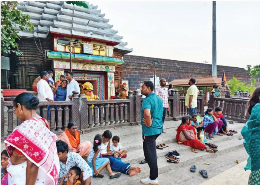
ଲିଙ୍ଗରାଜ ମନ୍ଦିରରେ ଶୁଖାଳୁ ବ୍ୟବସ୍ଥା ଓ ମନ୍ଦିର ଆଗରେ ସୌନ୍ଦର୍ଯ୍ୟ କରଣ ସହିତ ପିଲବା ପାର୍କି ସୌନ୍ଦର୍ଯ୍ୟକରଣ ନେଇ ଏକାମ୍ରୁ ଏହିପ୍ରକାର ପ୍ରକଳ୍ପର ପରିଚଳନା କରାଯାଇଥିଲା। ଏହି ପ୍ରକଳ୍ପ ମଧ୍ୟରେ

ଲିଙ୍ଗରାଜ ମନ୍ଦିରକୁ ଲାଗିକୋଟା ଖାଣ୍ଡ ମଧ୍ୟ ରହିଛି। ହେଲେ ଯିଏ ଯେଉଁଠି ପାଇଲ ଯେଠାରେ କୋଟାକୁ ରଖିବା ସହିତ ସିଂହଦ୍ୱାରାକୁ ଲାଗିଥିବା ବାହାର ବେଢ଼ା ପାଖ ବି ଏବେ ପାଲଟି ଯାଇଛି ଚପଳ ଖାଣ୍ଡ। ମନ୍ଦିର ଆଗରେ ସିମ୍ପତି କ୍ୟାମେରା ଲାଗିବା ସହିତ ପୁଲିସ ମଧ୍ୟ ସିଂହଦ୍ୱାରା ଆଗରେ ପୁରୁଣା ଦଉଛି। ହେଲେ ଏହାର ପ୍ରତିବାଦ କେହି ଜଣେ ବି କଲୁନାହାନ୍ତି। ଏଥିସହିତ ମନ୍ଦିର ପରିସରକୁ ଗାଡ଼ି ନିଷେଧ ରହିଥିବା ବେଳେ ଏବେ ଧାଡ଼ି ଧାଡ଼ି ହୋଇ ଦୁଇ ଚକିଆ ପାର୍କି ହଉଛି। ଚକରେ ଏହି ସବୁକୁ ଦେଖି ସ୍ଥାନୀୟ ଲୋକଙ୍କ ସମେତ ଶୁଖାଳୁମାନେ ଶୋଭା ପ୍ରକାଶ କରିଛନ୍ତି।