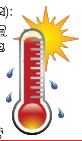
୪୫ ଡିଗ୍ରୀ ତାପମାତ୍ରା