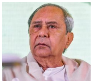
ସରକାର ରାଜ୍ୟକୁ ଅପରାଧୀଙ୍କ ହାତକୁ ଟେକି ଦେବା ପରି ଲାଗୁଛି

■ ଭୁବନେଶ୍ୱର, ୧୯।୫ (ସମ୍ପାଦକ): ବୁଦ୍ଧପୁର ସହରରେ ଦିନକତଳେ ଜଣେ ଯୁବକ ଓ ଯୁବତୀଙ୍କୁ ରାଷ୍ଟ୍ରା ଉପରେ ମରଣାନ୍ତକ ଆକ୍ରମଣ ଘଟଣାକୁ ନେଇ କଡ଼ା ପ୍ରତିକ୍ରିୟା ପ୍ରକାଶ କରିଛନ୍ତି ବିରୋଧୀବଳ ନେତା ନବୀନ ପଟ୍ଟନାୟକ। ଓଡ଼ିଶାରେ ବିଜେପି ଶାସନ ନୁହେଁ; ବରଂ ଗୁଣ୍ଡାରାଜ ଚାଲିଛି ବୋଲି ସାମାଜିକ ଗଣମାଧ୍ୟମ 'ଏକ୍ସ'ରେ ଷୋଭା ପ୍ରକାଶ କରିଛନ୍ତି ନବୀନ। ନବୀନ କହିଛନ୍ତି ଯେ ବୁଦ୍ଧପୁରର ବିଦ୍ଵ ରାଷ୍ଟ୍ରାରେ ଜଣେ ଯୁବକ ଏବଂ ମହିଳାଙ୍କୁ ସର୍ବସମ୍ପତ୍ତିରେ ଅତି ନିର୍ମମ ଭାବେ ପିଟି ପିଟି ମରଣାନ୍ତକ ଆକ୍ରମଣ କରାଯିବାର ଦୃଶ୍ୟ ଅତ୍ୟନ୍ତ ଅନାଚାର୍ୟ। ସାରା ଓଡ଼ିଶାବାସୀଙ୍କୁ ଏହା ଆତଙ୍କିତ ଓ ବିତଳିତ କରିଛି। ଲାଗୁଛି ବିଜେପି