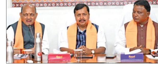
ପଞ୍ଚାୟତ ନିର୍ବାଚନ ପୂର୍ବରୁ ସଙ୍ଗଠନ ସୁଦୃଢ଼ ଲକ୍ଷ୍ୟ

■ ଭୁବନେଶ୍ଵର, ୧୮।୫ (ଏନିଆ): ସଂଗଠନ ଓ ସରକାର ମଧ୍ୟରେ ଉତ୍ତମ ସମନ୍ୱୟ ରଖି ସାହାଯ୍ୟରେ ଲୋକଙ୍କ ସମସ୍ୟାର ସମାଧାନ ଓ ସେମାନଙ୍କ ସମର୍ଥନ ପ୍ରାପ୍ତ କରିବା ସହଜ ହୋଇପାରିବ। ରାଜ୍ୟ ସରକାର ଯେଉଁ ଉନ୍ନୟନମୂଳକ କାର୍ଯ୍ୟକ୍ରମ, କଲ୍ୟାଣକାରୀ ଯୋଜନା ପ୍ରଣୟନ କରିଛନ୍ତି, ତାହାକୁ ତୃଣମୂଳସ୍ତରରେ ପହଞ୍ଚାଇବାକୁ ନିଶ୍ଚାର ସହ କାର୍ଯ୍ୟ କରା। ସୋମବାର ରାଜ୍ୟ ବିଜେପି କାର୍ଯ୍ୟାଳୟରେ ଅନୁଷ୍ଠିତ ବିଜେପି କୋର୍ କମିଟି ବୈଠକରେ ଏପରି ୫ ମନ୍ତ୍ର ଦେଇଛନ୍ତି ବିଜେପି କାଡ଼ାୟ ସଭାପତି ନିର୍ଦ୍ଦିନ ନବାନ।