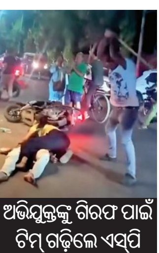
ଅଭିଯୁକ୍ତଙ୍କୁ ଗିରଫ ପାଇଁ ଟିମ୍ ଗଢ଼ିଲେ ଏସପି

■ ବ୍ରହ୍ମପୁର, ୧୮।୫ (ଏନିଆ): ରାସ୍ତା ଉପରେ ଗାଳିଗୋରୁକୁ ପିଟିବା ପରି କାଠ ପାଲିଆରେ ଯୁବକଙ୍କୁ ନିଷ୍ଠୁକ ମାଡ଼। ଜଣେ ଯୁବକ ସମ୍ପୃକ୍ତ ଯୁବକଙ୍କୁ ରକ୍ଷା କରିବା ପାଇଁ ଉଦ୍ୟମ କରି ବି ବିପଦ ହେଉଛି। ସ୍ଥାନୀୟ ଗିରି ରୋଡ଼ ଅଞ୍ଚଳର ଏହି ଘଟଣାର ବିଡ଼ିଓ ସାରା ରାଜ୍ୟରେ ଆଲୋଚନା ସୃଷ୍ଟି କରିଛି। ଆଉ ପାହାରେ ବୁଲୁ ପାହାରେ ବସିଥିଲେ ବା ଅଜାଗାରେ ମାଡ଼ିବିଏ ହୋଇଥିଲେ ବାଲିଆ ପରି ଆଉ ଗୋଟିଏ ଘଟଣାର ପୁନରାବୃତ୍ତି ହେବା ଏକ ପ୍ରକାର ନିଶ୍ଚିତ ଥିଲା। ବାଲିଆ ଯୋମରଞ୍ଜନ ସାଇକ୍ଲ ପିଟିପିଟି ହତ୍ୟା କରିବା ପରି ବ୍ରହ୍ମପୁର ସହରରେ ଘଟିଥିବା ଏହି ଘଟଣା ରାଜ୍ୟର ତଳମୁହାଁ ଆଇନଶୁଖିଲା ପରିସ୍ଥିତିକୁ ଦର୍ଶାଇଛି। ବିଡ଼ିଓଙ୍କୁ ହେଉଛି ପୁଲିସର ମିଳିତ ଛବିକୁ ତଳମୁହାଁ କରିବା ପାଇଁ 'ମିଶନ ଏକ୍ସକାର୍ଡ'କୁ ବି ଅପରାଧୀ ଖାତିର କରୁ ନ ଥିବା ପ୍ରମାଣିତ ହୋଇଛି।