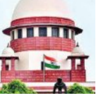
ୟୁଏପିଏ ମାମଲାରେ ବି ଜାମିନ ମିଳିପାରିବ

■ ନୂଆଦିଲ୍ଲୀ, ୧୮।୫ (ଏନିଆ): କଠୋର ଦେଆଇନ କାର୍ଯ୍ୟକଳାପ (ନିଷ୍ଠେଧ) ଆଇନ (ୟୁଏପିଏ) ଅନ୍ତର୍ଗତ ମାମଲାଗୁଡ଼ିକରେ ମଧ୍ୟ ଅଭିଯୁକ୍ତଙ୍କୁ ଜାମିନ ମିଳିପାରିବ। ଏହି ମାମଲାରେ 'ଜାମିନ ଏକ ନିୟମ ଏବଂ ଜେଲ ଏକ ବ୍ୟତିକ୍ରମ' ବୋଲି ସୁପ୍ରିମ କୋର୍ଟ ପୂର୍ବରୁ ନିର୍ଦ୍ଦିଷ୍ଟ କରିଥିବା ଆଇନଗତ ନୀତି ମଧ୍ୟ ପ୍ରଯୁଜ୍ୟ। ଦ୍ଵିତୀୟ ଶ୍ରେଣୀ ଏବଂ ଜାମିନ ମାମଲାରେ ଭାରତୀୟ ସମ୍ବିଧାନ ଦ୍ଵାରା ପ୍ରଦତ୍ତ ଅଧିକାରକୁ କୌଣସି ନାଗରିକଙ୍କୁ ବଞ୍ଚିତ