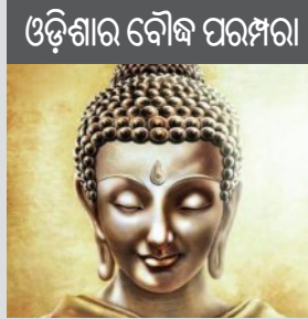
ଓଡ଼ିଶାର ବୌଦ୍ଧ ପରମ୍ପରା

ଅଶୋକଙ୍କ ଅଭିଲେଖଗୁଡ଼ିକୁ ସାଧାରଣ ଭାବେ ଦୁଇଗୋଟି ଶ୍ରେଣୀରେ ବିଭକ୍ତ କରାଯାଇପାରେ। ଗୋଟିଏ ହେଲା ଯେଉଁଗୁଡ଼ିକ ପଥର ଚଟାଣ ଉପରେ ଖୋଦିତ ଏବଂ ଅନ୍ୟଟି ହେଉଛି ପଥର ତିଆରି କରାଯାଇଥିବା ଖୋଦିତ। ସେହିଭଳି ପଥର ଚଟାଣରେ ଖୋଦିତ ଶିଳାଲେଖଗୁଡ଼ିକ ମଧ୍ୟ ତିନିଗୋଟି ଭାଗରେ ବିଭକ୍ତ - ଶିଳା ଲିପି, କ୍ଷୁଦ୍ର ଶିଳା ଲିପି ଓ ଗୁମ୍ଫା ଲେଖ।