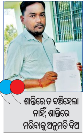
ଶାନ୍ତିରେ ତ ସଞ୍ଚିହେଲା ନାହିଁ, ଶାନ୍ତିରେ ମରିବାକୁ ଅନୁମତି ଦିଅ