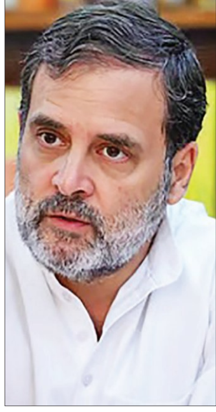
ହେବାକୁ ଯାହା ଲକ୍ଷ୍ୟକରେ ମଧ୍ୟ ସିଦ୍ଧହେଉଛି ଏବଂ ଶିବକ୍ରମର ମଧ୍ୟରେ ଏପରି ଛକାପଞ୍ଜା ହୋଇଥିଲା ।

କିନ୍ତୁ ରାଜ୍ୟରେ ଖପଟା ପାଇଁ କେହି ଏପରି କୋର ଧରିଛନ୍ତି ଯେ ହାଇକମାଣ୍ଡ ନିଷ୍ପତ୍ତି ନେଇ ପାରୁ ନାହାଣି । ମିଳିଥିବା ସୂଚନା ଅନୁଯାୟୀ କେରଳରେ ମୁଖ୍ୟମନ୍ତ୍ରୀ ହେବାଲାଗି କଂଗ୍ରେସର ଅନେକ ଦାବିଦାର ଥିଲେ ମଧ୍ୟ ଏବେ ହୁଇ ଜଣଙ୍କୁ ନେଇ ବେଶି ଚର୍ଚ୍ଚା ଚାଲିଛି । ଏମାନେ ହେଲେ କେସି ବେଣ୍ଟୋପାଳ ଏବଂ ଭିଟ୍ଟି ସତ୍ୟନାଥ । ଏହି ଦିଗରେ ଅନ୍ୟତମ ବରିଷ୍ଠ ନେତା ରମେଶ ଚେନ୍ନିଲ୍ଲା ଥିଲେ ମଧ୍ୟ ତାଙ୍କୁ ବାଚସ୍ପତି କରିବା ଲାଗି ହାଇକମାଣ୍ଡ ଆଶ୍ୱାସନା ଦେଇଛନ୍ତି । ଆଶ୍ୱାସନା ପାଇବା ପରେ ସେ ଏବେ ନିରବ ରହିଥିବା ବେଳେ ବେଣ୍ଟୋପାଳ ଏବଂ ସତ୍ୟନାଥ ମଧ୍ୟରେ ଛକାପଞ୍ଜା ଚାଲିଛି । ବେଣ୍ଟୋପାଳ ହେଉଛନ୍ତି ଗାନ୍ଧୀ ପରିବାର ଏବଂ ବିଶେଷ କରି ରାହୁଲଙ୍କ ଅତି ବିଶ୍ୱସ୍ତ । କିନ୍ତୁ ବେଣ୍ଟୋପାଳଙ୍କୁ ତାକୁ ବିରୋଧ କରୁଛନ୍ତି ସତ୍ୟନାଥ । ବାମ ସାମ୍ବାଦିତ୍ରୀ ବିରୋଧରେ ଫର୍ଦ୍ଦସି କରିଥିବା ସତ୍ୟନାଥ ସ୍ୱୟଂ କରିଦେଇଛନ୍ତି ଯେ ମୁଖ୍ୟମନ୍ତ୍ରୀ ପଦ ଛଡ଼ା ତାଙ୍କୁ ଅନ୍ୟ କୌଣସି ଦାୟିତ୍ୱ ଗ୍ରହଣ ନୁହେଁ । ରାହୁଲଙ୍କ ପକ୍ଷରୁ କୁହାଯାଇଥିଲା ଯେ ବେଣ୍ଟୋପାଳ ମୁଖ୍ୟମନ୍ତ୍ରୀ ହେଲେ ସତ୍ୟନାଥଙ୍କୁ ମହିମାପୂର୍ଣ୍ଣ ଦାୟିତ୍ୱ ମିଳିବ । କିନ୍ତୁ ସେ ମାନିବାକୁ ପସ୍ତୁତ ନୁହନ୍ତି । ଅନ୍ୟପକ୍ଷରେ ବେଣ୍ଟୋପାଳଙ୍କୁ ନେଇ ମଧ୍ୟ ହାଇକମାଣ୍ଡ ଚିନ୍ତାରେ ଅଛନ୍ତି । ତାଙ୍କୁ ମୁଖ୍ୟମନ୍ତ୍ରୀ କରାଗଲେ ରାଜ୍ୟରେ ପୁଣି ଦୁଇଟି ଉପନିର୍ବାଚନ ହେବ । ବେଣ୍ଟୋପାଳ ଲୋକସଭା ସାମ୍ବଦ ଥିବାରୁ ମୁଖ୍ୟମନ୍ତ୍ରୀ ହେଲେ ତାଙ୍କୁ ବିଧାନସଭାକୁ ନିର୍ବାଚିତ ହେବାକୁ ପଡ଼ିବ । ପୁଣି ସେ ଲୋକସଭା ସଭ୍ୟ ପଦକୁ ଛାଡ଼ିବା ଦେବେ । ତେଣୁ ଉତ୍ତର ଲୋକସଭା ଏବଂ ବିଧାନସଭା ଆସନରେ ସାନି ଉପନିର୍ବାଚନ ହେବ । ଏବଂ ପକ୍ଷରେ ହାଇକମାଣ୍ଡ ବେଣ୍ଟୋପାଳଙ୍କୁ ବୁଝାଉଛନ୍ତି । କିନ୍ତୁ ସେ ମୁଖ୍ୟମନ୍ତ୍ରୀ ହେବାକୁ ଜିଏ ଧରିଥିବାରୁ ହାଇକମାଣ୍ଡ ଅତୁଆରେ ପଡ଼ିଯାଇଛନ୍ତି । କେରଳରେ କର୍ତ୍ତାକର ଭଳି ପରିସ୍ଥିତି ସୃଷ୍ଟି ହେବାରୁ ଯାହା ଲକ୍ଷ୍ୟକରେ ମଧ୍ୟ ସିଦ୍ଧହେଉଛି ଏବଂ ଶିବକ୍ରମର ମଧ୍ୟରେ ଏପରି ଛକାପଞ୍ଜା ହୋଇଥିଲା ।