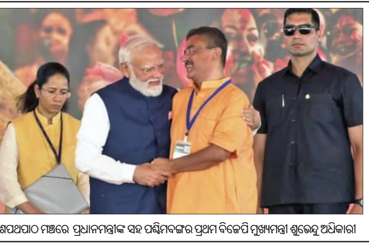
ଶପଥପାଠ ମଧ୍ୟରେ ପ୍ରଧାନମନ୍ତ୍ରୀଙ୍କ ସହ ପଶ୍ଚିମବଙ୍ଗର ପ୍ରଥମ ବିଜେପି ମୁଖ୍ୟମନ୍ତ୍ରୀ ଶୁଭେନ୍ଦୁ ଅଧିକାରୀ

୮ ବିଲିୟନ ଡଲାରରୁ ଅଧିକ ଅର୍ଥ ପଠାଇଥାନ୍ତି। ଶ୍ରମିକ ବହିଷ୍କୃତ ହେବା ପାକିସ୍ତାନରୁ ଅର୍ଥନୀତି ପାଇଁ ଏକ ବଡ଼ ଝଟକା ସାବ୍ୟସ୍ତ ହୋଇଛି। ଯୁଏଏ ଏହି ବିଷୟରେ କୌଣସି ସ୍ପଷ୍ଟ ସୂଚନା ଦେଇ ନଥିବା ବେଳେ ପାକିସ୍ତାନ ଏହାକୁ ଏକ ବଡ଼ ଧରଣର ବହିଷ୍କାର ବୋଲି ମାନିବାକୁ ମନା କରିଛି। ତେବେ ଉପସାହାରୀୟ ଅଞ୍ଚଳରେ ବହୁଥିବା ଅସ୍ଥିରତା ମଧ୍ୟରେ ଏହି ଘଟଣା ହୁଇ ଦେଶର ସମ୍ପର୍କରେ ପାଟ ସୃଷ୍ଟି କରିଛି।