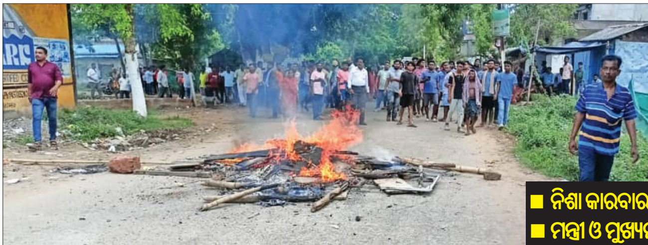
■ ନିଶା କାରବାର ସମ୍ବେହରେ ଦୋକାନ ଭଙ୍ଗାରୁଜା ■ ମହା ଓ ମୁଖ୍ୟମନ୍ତ୍ରୀଙ୍କ କୁଶପୁରଲିକା ଦାହ