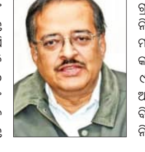
କୋଲକାତା, ୯।୫ (ଏକେନି): ସୁଇ ଦଶନ୍ଧିର ରାଜନୈତିକ ସମାଜର ଶରେ ଏକ ବଡ଼ ପରିବର୍ତ୍ତନର ସଙ୍କେତ ମିଳିଛି। ପଶ୍ଚିମବଙ୍ଗର ପୂର୍ବତନ ମୁଖ୍ୟମନ୍ତ୍ରୀ ମମତା ବାନାର୍ଜୀ ନିଜର ସୋସିଆଲ ମିଡିଆ ପ୍ରୋଫାଇଲ୍ ବଦଳାଇ ପରୋକ୍ଷରେ ନିଜର ପରାଜୟ ସ୍ୱୀକାର କରିଥିବା ଚର୍ଚ୍ଚା ହେଉଛି। ପଶ୍ଚିମବଙ୍ଗ ବିଧାନସଭା ନିର୍ବାଚନରେ ଭାରତୀୟ ଜନତା ପାର୍ଟି (ବିଜେପି) ର ବିପ୍ଳବ ବିଜୟ ପରେ ମଧ୍ୟ ମମତା ବାନାର୍ଜୀ ଇସ୍ତଫା ଦେବାକୁ ମନା କରିଥିଲେ। ମାତ୍ର ଆଜି ସକାଳେ ନିଜର ସୋସିଆଲ ମିଡିଆ ଆକାଉଣ୍ଟ 'ଏକ୍ସ' (ପୂର୍ବରୁ ଟ୍ୱିଟର) ରେ କରିଥିବା ପରିବର୍ତ୍ତନ ଏବେ ସବୁଠି ଆଲୋଚନାର ବିଷୟ ପାଲଟିଛି। ମମତା

କୋଲକାତା, ୯।୫ (ଏକେନି): ଯେଉଁ ଏସ୍‌ଆଇଆର୍କ (ସ୍ୱତନ୍ତ୍ର ଭୋଟର ତାଲିକା ଫର୍‌ଗୋଧନ) ବିବାଦ ମଧ୍ୟରେ ପଶ୍ଚିମ ବଙ୍ଗ ବିଧାନସଭା ନିର୍ବାଚନ ହୋଇଥିଲା, ସେହି ଏସ୍‌ଆଇଆର୍କ ସହ ଏପ୍ରକୃତ ଜଣେ ଅଧିକାରୀଙ୍କୁ ପୁରସ୍କୃତ କରାଯାଇଛି। ରାଜ୍ୟର ପ୍ରଥମ ବିଜେପି ମୁଖ୍ୟମନ୍ତ୍ରୀ ଭାବେ ଶପଥ ଗ୍ରହଣ କରିଥିବା ଶୁଭେନ୍ଦୁ ଅଧିକାରୀ ଆଜି ତାଙ୍କୁ ପୁରସ୍କୃତ କରିଛନ୍ତି। ଏହି ଅଧିକାରୀ ଜଣକ ହେଲେ ୧୯୯୦ ବ୍ୟାଚ୍‌ର ଅଧିକାରୀଙ୍କୁ ଆଇଏସ୍‌ଏସ୍ ସୁରକ୍ଷା ଦେବା ଦଳଙ୍କ ପ୍ରବଳ ବିରୋଧ ମଧ୍ୟରେ ହୋଇଥିବା ଏସ୍‌ଆଇଆର୍କ ପ୍ରକ୍ରିୟା ବେଳେ ଭାରତର ନିର୍ବାଚନ କମିସନ୍‌ରୁ ଗୁପ୍ତା ପର୍ଯ୍ୟବେକ୍ଷକ ଭାବେ ନିଯୁକ୍ତ