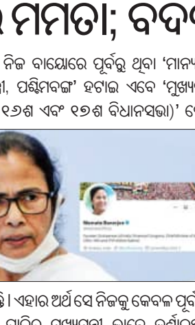
କୋଲକାତା, ୯।୫ (ଏକେନି): ସହର ଅର୍ଥ ସେ ନିଜକୁ କେବଳ ପୂର୍ବତନ ତିନୋଟି ପାଲିର ମୁଖ୍ୟମନ୍ତ୍ରୀ ଭାବେ ଦର୍ଶାଇଛନ୍ତି।

କୋଲକାତା, ୯।୫ (ଏକେନି): ସୁଇ ଦଶନ୍ଧିର ରାଜନୈତିକ ସମାଜର ଶରେ ଏକ ବଡ଼ ପରିବର୍ତ୍ତନର ସଙ୍କେତ ମିଳିଛି। ପଶ୍ଚିମବଙ୍ଗର ପୂର୍ବତନ ମୁଖ୍ୟମନ୍ତ୍ରୀ ମମତା ବାନାର୍ଜୀ ନିଜର ସୋସିଆଲ ମିଡିଆ ପ୍ରୋଫାଇଲ୍ ବଦଳାଇ ପରୋକ୍ଷରେ ନିଜର ପରାଜୟ ସ୍ୱୀକାର କରିଥିବା ଚର୍ଚ୍ଚା ହେଉଛି। ପଶ୍ଚିମବଙ୍ଗ ବିଧାନସଭା ନିର୍ବାଚନରେ ଭାରତୀୟ ଜନତା ପାର୍ଟି (ବିଜେପି) ର ବିପ୍ଳବ ବିଜୟ ପରେ ମଧ୍ୟ ମମତା ବାନାର୍ଜୀ ଇସ୍ତଫା ଦେବାକୁ ମନା କରିଥିଲେ। ମାତ୍ର ଆଜି ସକାଳେ ନିଜର ସୋସିଆଲ ମିଡିଆ ଆକାଉଣ୍ଟ 'ଏକ୍ସ' (ପୂର୍ବରୁ ଟ୍ୱିଟର) ରେ କରିଥିବା ପରିବର୍ତ୍ତନ ଏବେ ସବୁଠି ଆଲୋଚନାର ବିଷୟ ପାଲଟିଛି। ମମତା