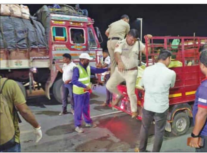
ଟିକ୍ସ କରାଯାଇ ଜରିଆନା କାର୍ତ୍ତବ୍ୟ ବ୍ୟବସ୍ଥା ରହିଛି, ସହର ଭିତରେ ତଥା ରାଜପଥ ଅନ୍ୟକୌଣସି ସ୍ଥାନରେ ସେଭଳି ବ୍ୟବସ୍ଥା ନାହିଁ। ଯେଉଁଥିପାଇଁ କିଲର ଭେଲକିଲ ଏବଂ କୁମ୍ପେ ବଡ଼ିବାରେ ଲାଗିଛି। ସବୁଠାରୁ ଗୁରୁତ୍ୱପୂର୍ଣ୍ଣ କଥା ହେଉଛି ଦିନବେଳା, ବିଶେଷକରି ସନ୍ଧ୍ୟା ସମୟରେ ସହର ଭିତରେ ଦେଇ ଭାରିଯାନ ଚଳାଚଳ କରୁଥିବା ଏଭଳି ଦୁର୍ଘଟଣାମାନେ ଘଟି ଚାଲିଛି ଏବଂ ଲୋକଙ୍କ ପୁଣି ଗଡ଼ୁଛି। ମତ୍ୟ ପ ଗାଡ଼ି ଚାଳକଙ୍କୁ ଟିକ୍ସ କରିବା ପାଇଁ କୌଣସି ବ୍ୟବସ୍ଥା ନ ଥିବାରୁ ଭାରିଯାନ ଚାଳକମାନେ

ଭୁବନେଶ୍ୱର, ୯।୫(ସମିପ) ଶନିବାର ସଞ୍ଚାରେ ଭୁବନେଶ୍ୱର ଦେଇ ଯାଉଥିବା ୧୬ ନମ୍ବର ଜାତୀୟ ରାଜପଥର ପ୍ରାୟ ୧୫ କି.ମି. ଦୂରରେ ଏକ ଦୁର୍ଘଟଣା ଘଟି ଧରକୁ ଧର ମୃତ୍ୟୁ ହୋଇଥିବା ବେଳେ ଅନ୍ୟଜଣେ ଗୁରୁତର ଆହତ ହୋଇଛନ୍ତି। ମୃତକଙ୍କ ପରିଚୟ ନେଇ ପୁଲିସ ଅନୁସନ୍ଧାନ କରୁଥିବା ବେଳେ ଆହତଙ୍କୁ ଚିକିତ୍ସା ନିମନ୍ତେ ଡାକ୍ତରଖାନାରେ ଭର୍ତ୍ତି କରାଯାଇଛି। ତେବେ କେଉଁ ପ୍ରକ୍ ଏବଂ କିଲି ଭାବେ ଏଭଳି ଏକ କାଣ୍ଡ ଘଟିଥିଲା ତାହା ଗଣନା ସେ ନେଇ ପୁଲିସ ପାଖରେ ସୂଚନା ନାହିଁ। କେବଳ ଏହି ଘଟଣା ନୁହେଁ ପରିବହନ ବିଭାଗର କଟକଣା ଅଭାବ ଯୋଗୁଁ ଭୁବନେଶ୍ୱର ଦେଇ ଯାଉଥିବା ଜାତୀୟ ରାଜପଥରେ ଏହିଭଳି ଭାବେ ଦୁର୍ଘଟଣାମାନେ ଘଟି ଚାଲିଛି। ଅପରପକ୍ଷେ କିଲର ଭେଲକିଲଗୁଡ଼ିକୁ ଟିକ୍ସ କରିବା ପୁଲିସ ପାଇଁ କାଠିକର ପାଠ ହୋଇପଡୁଛି। ଯେଉଁଥିପାଇଁ ବାରମ୍ବାର ରାଜଧାନୀ ରାଜପଥରେ ଏଭଳି ଘଟଣାମାନ ନିୟମିତ ଘଟି ଚାଲିଛି।