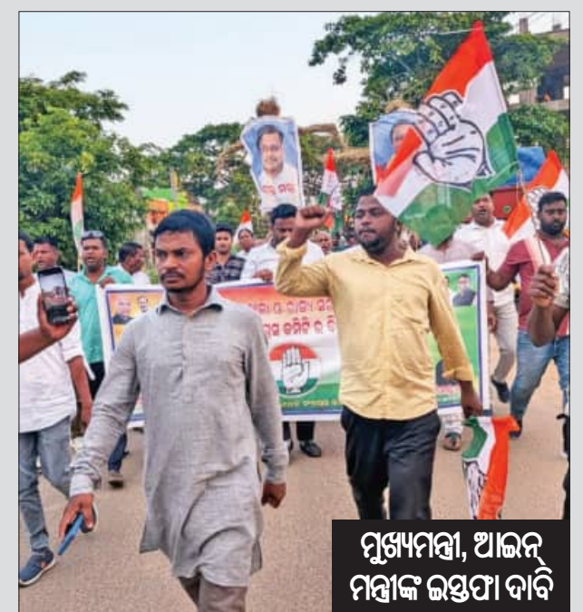
ମୁଖ୍ୟମନ୍ତ୍ରୀ, ଆଇନ ମନ୍ତ୍ରୀଙ୍କ ଲକ୍ଷ୍ୟ ଦାବି