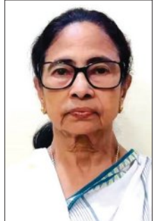
ନିର୍ବାଚନ କମିସନଙ୍କ ଦ୍ୱାରା କରାଯାଇଥିବା ଏହି ପ୍ରକ୍ରିୟାରେ ନକଲି ଏବଂ ମୃତ ଭୋଟରଙ୍କ ନାମ ହଟାଇବା ପାଇଁ ଅଭିଯାନ ଚଳାଯାଇଥିଲା । ସରକାରୀ

କଲିକତା, ୫।୫ (ଏକେନ୍ଦ୍ର): ପଶ୍ଚିମବଙ୍ଗ ବିଧାନସଭା ନିର୍ବାଚନରେ ଏଥର ଏକ ବଡ଼ ଓଲଟପାଲଟ ତଥା ବିପର୍ଯ୍ୟୟ ଦେଖିବାକୁ ମିଳିଛି । ୧୫ ବର୍ଷର ମମତା ବାନାର୍ଜୀଙ୍କ ଶାସନର ଅନ୍ତ ଘଟାଇ ଭାରତୀୟ ଜନତା ପାର୍ଟି (ବିଜେପି) କ୍ଷମତା ଦଖଲ କରିଛି । ତେବେ ଏହି ନିର୍ବାଚନ ପୂର୍ବରୁ ହୋଇଥିବା ଭୋଟର ତାଲିକା ସଂଶୋଧନ (ଏସ୍ଆଇଆର) ଏବେ ଚର୍ଚ୍ଚାର ବିଷୟ ପାଲଟିଛି । ରାଜ୍ୟରେ ପ୍ରାୟ ୯୦ ଲକ୍ଷରୁ ଅଧିକ ଭୋଟରଙ୍କ ନାମ ତାଲିକାରୁ କଟିବା ଚୁଖିମୁଖି କଂଗ୍ରେସ ପାଇଁ ମହଙ୍ଗା ପଡ଼ିଥିବା କୁହାଯାଉଛି ।