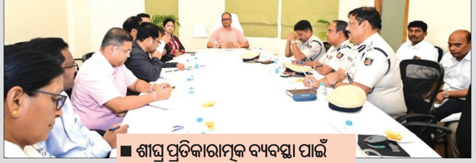
ଶାସନ ପ୍ରତିକାରାତ୍ମକ ବ୍ୟବସ୍ଥା ପାଇଁ ଉନ୍ନୟନ କମିସନରଙ୍କ ନିର୍ଦ୍ଦେଶ ଦାୟିତ୍ୱାଳୀ ଭାବେ ସମାଧାନ ପାଇଁ ଦାୟିତ୍ୱ ନିଆଯିବ ପଦକ୍ଷେପ