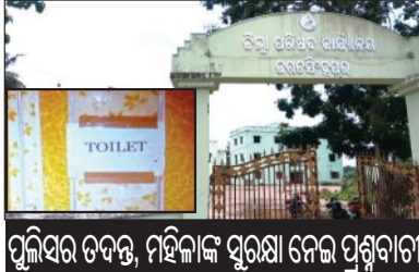
ପୁଲିସର ତଦନ୍ତ, ମହିଳାଙ୍କ ସୁରକ୍ଷା ନେଇ ପ୍ରଶ୍ନବାଚୀ

■ ତିର୍ତ୍ତୋଲ, ୨୮।୫ (ସମ୍ପାଦକ): ତିର୍ତ୍ତୋଲ ବ୍ଲକ ଅନ୍ତର୍ଗତ ସର୍ପିରାସ୍ତିତ ଜିଲ୍ଲା ପରିଷଦ କାର୍ଯ୍ୟାଳୟର ମହିଳା ଶୌଚାଳୟ ଏକ 'ସ୍ତ୍ରୀ କ୍ୟାମ' ଗୁପ୍ତ କ୍ୟାମେରା ଉଦ୍ଧାର