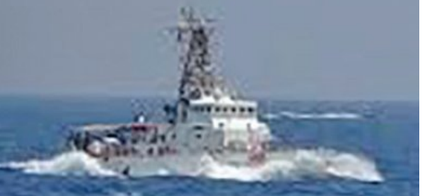
ଆବାହାମ ଆକର୍ଡ୍ ସହ ଯୋଡ଼ିବାକୁ ମଧ୍ୟ ପ୍ରୟାସ କରୁଛନ୍ତି । ଏହି ସାମିତ ଆକ୍ରମଣ ପରେ ଭର୍ମାନ ପାଇଁ ପରିସ୍ଥିତି ଶାନ୍ତ ପଡ଼ିଛି । କତାରରେ ଚାଲିଥିବା ଶାନ୍ତି ଆଲୋଚନା ଜାରି ରହିଥିବା ବେଳେ ହର୍ମୁଜ ପ୍ରଣାଳୀରେ ନିଜର ପ୍ରଭାବ ବଳବତ୍ତର ରଖିବାକୁ ଆମେରିକା ଏହି ଚେତାବନାପୂର୍ଣ୍ଣ ଆକ୍ରମଣ କରିଥିବା ସ୍ପଷ୍ଟ ଜଣାପଡ଼ିଛି ।

ଆମେରିକାର ସୁକ୍ଷ୍ମବିମାନକୁ ଟାର୍ଗେଟ୍ କରିବା ପରେ ଆମେରିକା ସେନା ଜବାବା କାର୍ଯ୍ୟାନୁଷ୍ଠାନ ସ୍ୱରୂପ ସେହି ଲକ୍ଷ୍ୟକୁ ସମ୍ପୂର୍ଣ୍ଣ ଭାବେ ଉଡ଼ାଇ ଦେଇଛି । ଫୋଖାଗନ୍ ସୁତ ଅନୁଯାୟୀ, ଏହି ଆକ୍ରମଣ ସାମିତ ଥିଲା ଏବଂ ଏହାଦ୍ୱାରା ଭରାନ୍ ସହ ଚାଲିଥିବା ଶାନ୍ତି ଆଲୋଚନା ବା ଅସ୍ତବିରତି ଶେଷ ହୋଇନାହିଁ । ଏହି ସାମରିକ ଚିକ୍ତା ମଧ୍ୟରେ ଆମେରିକା ରାଷ୍ଟ୍ରପତି ତୋନାକୁ ଟ୍ରମ୍ପ ନିଜର ସୋସିଆଲ ମିଡିଆ ସ୍ୱାଗତ୍ୟରେ ଏକ ବଡ଼ ବୟାନ ଦେଇଛନ୍ତି । ସେ ଭରାନ୍‌ର ସମସ୍ତ ସମୂହ ଯୁବାନିୟମକୁ 'ପରମାଣୁ ଧୁଳି' ବୋଲି ଅଭିହିତ କରିଛନ୍ତି । ସେ କହିଛନ୍ତି ଯେ, ଶାନ୍ତି ରୁକ୍ତ ପାଇଁ ଭରାନ୍‌ର ନିଜର ସମସ୍ତ ଯୁବାନିୟମ ନଷ୍ଟ କରିବାକୁ ହେବ କିମ୍ବା ଅନ୍ତର୍ଜାତୀୟ ନିରାକ୍ଷଣରେ ଏହାକୁ ଆମେରିକା ହାତକୁ ହସ୍ତାନ୍ତର କରିବାକୁ ପଡ଼ିବ । ସେ ଏହି ଶାନ୍ତି ପ୍ରକ୍ରିୟାକୁ