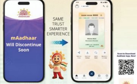
ନୂଆ ଆଧାର ଆପ୍ । ଗ୍ରାହକମାନେ ମାଲ୍-ଆଧାର ପୋର୍ଟାଲକୁ ଯାଇ ନିଜର ପରିଚୟ ଏବଂ ଠିକଣା ପତ୍ର ମାଗଣାରେ ଅପଡେଟ୍ କରିପାରିବେ ।

କେବଳ ଆବଶ୍ୟକୀୟ ସୂଚନାକୁ ଏକ ସୁରକ୍ଷିତ କ୍ୟୁଆର୍ କୋଡ୍ ମାଧ୍ୟମରେ ସେୟାର କରିପାରିବେ । ପୂର୍ବରୁ କେବଳ ଓଡିପି ଉପରେ ନିର୍ଭର କରିବାକୁ ପଡୁଥିବା ବେଳେ ଏବେ ସୁରକ୍ଷା ପାଇଁ ଏଥିରେ ଓଡିପି ସହିତ ମୁଖ୍ୟ ଟିକ୍ସଟ୍ (ଫେସ୍‌ଅପ୍‌ରେସିକେସନ୍) ଏବଂ କ୍ୟୁଆର୍ କୋଡ୍ ଯାଞ୍ଚ ଅତିରିକ୍ତ ସ୍ତର ଯୋଡ଼ାଯାଇଛି । ଗ୍ରାହକମାନେ ନିଜର ଆକ୍ରମିତ ଟିକ୍ସ, ମୁଖ ଏବଂ ଆଖିର ସ୍କାନ ତଥ୍ୟକୁ ନିଜ ଆପ୍ ମାଧ୍ୟମରେ ଲକ୍ କିମ୍ବା ଅନଲକ୍ କରିପାରିବେ । ଏହାଦ୍ୱାରା ଅନ୍ୟ କେହି ଏହାର ଅପବ୍ୟବହାର କରିପାରିବେ ନାହିଁ । ଏହି ପରିବର୍ତ୍ତନ ସହିତ ସରକାରଙ୍କ ପକ୍ଷରୁ ଜନସାଧାରଣଙ୍କ ପାଇଁ ମାଗଣା ଆଧାର ଦଲିଲ ଅପଡେଟ୍‌ସେସ୍‌ସ୍‌ ବୃଦ୍ଧି କରାଯାଇଛି । ପୂର୍ବରୁ ଏହି ସେବା ୨୦୨୨ ଜୁନ ୧୫ ପର୍ଯ୍ୟନ୍ତ ମାଗଣା ଥିବା ବେଳେ ଏବେ ଏହାକୁ ୨୦୨୬ ଜୁନ ୧୫ ତାରିଖ ପର୍ଯ୍ୟନ୍ତ ବଢ଼ାଇ