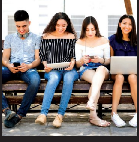
ମୃତ୍ୟୁ ସହିତ କଡ଼ିତ ଶବ୍ଦ ହେଉଛି 'ଡେଡ୍'। ହେଲେ ଏହା ଜେନ୍ ଜେଡ୍‌ଙ୍କ ମଧ୍ୟରେ ହୁଏତ ସାମାଜିକ ହୋଇଯିବ।

ନଚେତ୍ ଲକ୍ଷ୍ୟ ଅନୁଭବ କଲେ ସେମାନେ ବ୍ୟବହାର କରନ୍ତି। ଅନ୍ୟପେଟ 'କ୍ଲିନ୍' ଶବ୍ଦର ଅର୍ଥ ଶାନ୍ତି ବୋଲି ବାଣୀଥିଲେ ସେମାନେ ଏହାକୁ ଆମ୍ବିଶ୍ୱାସ ଲାଗି ବ୍ୟବହାର କରନ୍ତି। କୌଣସି ଜିନିଷ ପ୍ରତି ଆକର୍ଷିତ ହେବା ଲାଗି 'ରିଜ୍' କହନ୍ତି। ତେବେ 'ହାଇଲି'କୁ ଆରମ୍ଭ କରୁଥିବା ବ୍ୟକ୍ତି ପାଇଁ ସେମାନେ ବ୍ୟବହାର କରନ୍ତି। ଏଭଳି ଆତ୍ମୀ ଅନେକ ଶବ୍ଦ ଅଛି, ଯାହାକୁ ଜେନ୍ ଜେଡ୍ ସର୍ବପ୍ରମରେ ବ୍ୟବହାର କରୁଛନ୍ତି।