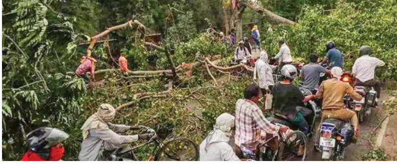
ଦେଶଭିତ୍ତି । ଘୂର୍ଣ୍ଣିତ ବିପର୍ଯ୍ୟୟ ପାଇଁ ଯୁଦ୍ଧ କରି ଶୋକ ପ୍ରକାଶ କରିଛନ୍ତି ରୁଷ ରାଷ୍ଟ୍ରପତି ଭାଦିପିର ପୁଡିନ । ରାଷ୍ଟ୍ରପତି 11 ଟୁପିପା ମୁର୍ଦ୍ଦା ଏବଂ ପ୍ରଧାନମନ୍ତ୍ରୀ ମୋଦୀଙ୍କ ନିକଟକୁ ବାର୍ତ୍ତା ପଠାଇ ଶୋକ ଜଣାଇବା ସହିତ ପ୍ରାଣ ହରାଇଥିବା ବ୍ୟକ୍ତିଙ୍କ ପରିବାର ଓ ବନ୍ଧୁଜନଙ୍କ ପ୍ରତି ସେ ସମବେଦନା ବ୍ୟକ୍ତ କରିଛନ୍ତି ।

ଥାନା । ଘଣ୍ଟାପ୍ରତି ୫୦ରୁ ୧୦୦ କିଲୋମିଟର ବେଗରେ ପ୍ରବାହିତ ଧୂଳିଝଡ଼ ଓ ବଜ୍ରପାତର ସମ୍ମିଳିତ ପ୍ରକୋପରେ ଶତାଧିକ ମୃତ୍ୟୁ ଘଟିଛି । ସହ ଅନେକ କଞ୍ଚାଘର ଲୁଣ୍ଠିତ ପଡ଼ିଛି । କେତେକ ସ୍ଥାନରେ ଘର ଛପର ସହିତ ମଣିଷକୁ ବି ଉଡ଼ାଇ ଦେଇଛି । ବରେଲି ଅଞ୍ଚଳରେ ଘୂର୍ଣ୍ଣିତରେ ଆକ୍ରମଣ ସହ ଛାତ ସହିତ ମଣିଷ ପଦନରେ ଡ଼ିପାଉଥିବା ଦୃଶ୍ୟ ଗଣମାଧ୍ୟମରେ ଭାଇଭାଇ ହେବାରେ ଲାଗିଛି । ଘୂର୍ଣ୍ଣିତରେ ବର୍ତ୍ତମାନ ସୁଦ୍ଧା ୧୧୧ ଜଣ ପ୍ରାଣ ହରାଇଥିବା ଖବର ମିଳିଛି । ମୃତକଙ୍କ ମଧ୍ୟରୁ ଅଧିକାଂଶ ଘର କାଢ଼ି ପଡ଼ି କିମ୍ବା ବଜ୍ରପାତର ଶିକାର ହୋଇଥିବା ଜଣାପଡ଼ିଛି । ରାଜ୍ୟ ମୁଖ୍ୟମନ୍ତ୍ରୀ ଯୋଗୀ ଆଦିତ୍ୟନାଥ ଏହି ଘଟଣାରେ ଗଭୀର ଶୋକ ପ୍ରକାଶ କରିବା ସହ ଆଗାମୀ ୨୪ ଘଣ୍ଟା ମଧ୍ୟରେ ଶତଶ୍ରଦ୍ଧ ପରିବାରକୁ ସହାୟତା ପ୍ରଦାନ କରିବାକୁ ପ୍ରଶ୍ନାବଳୀ ନିର୍ଦ୍ଦେଶ