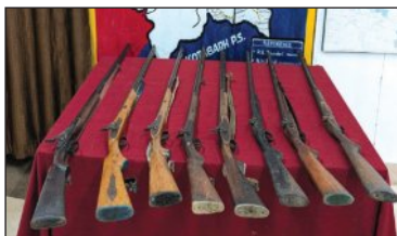
ହୋଇଛି ଶିକାରୀମାନେ ଏହି ବନ୍ଧୁକ ଲୁଚାଇ ରଖିଥିଲେ। ଦୁମୁକ୍ତିବନ୍ଧ ପୂର୍ଣ୍ଣିମା ପର୍ବରେ ଲୁଚାଇ ରଖିଥିଲେ।

ଦୁମୁକ୍ତିବନ୍ଧ/ବାଲିଗୁଡ଼ା, ୧୪।୫ (ସମ୍ବାଦ): କଳ୍ୟାଣ ଦେବଦାସ ଥାନା ଅଧୀନ ସିଲ୍ଲୀ ପଞ୍ଚାୟତର ଉପସଭାରେ ବିଚାରିତା ଜଣାଲୁ ଟ ଦେଶୀ ବନ୍ଧୁକ ଜବତ