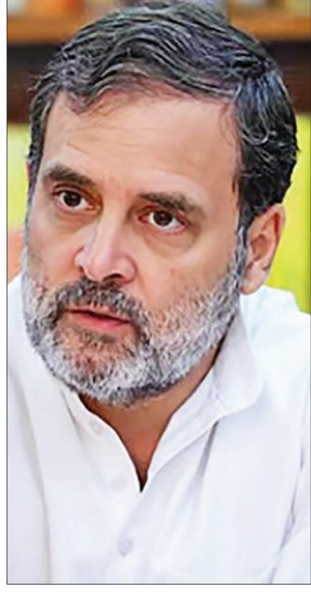
ହେବାକୁ ଯାଉଛି। କର୍ତ୍ତାକର ମଧ୍ୟ ସିଦ୍ଧମେୟା ଏବଂ ଶିବକୁମାରଙ୍କ ମଧ୍ୟରେ ଏପରି ଛକାପଞ୍ଜା ହୋଇଥିଲା।

କିନ୍ତୁ ରାଜ୍ୟରେ ଶପଥ ପାଇଁ କେରଳ ଏପରିକି କୋର ଧରିଛି ଯେ ହାଇକମାଣ୍ଡ ନିଷ୍ପତ୍ତି ନେଇ ପାରୁ ନାହିଁ। ମିଳିଥିବା ସୂଚନା ଅନୁଯାୟୀ କେରଳରେ ମୁଖ୍ୟମନ୍ତ୍ରୀ ହେବାଲାଗି କଂଗ୍ରେସର ଅନେକ ଦାବିଦାର ଥିଲେ ମଧ୍ୟ ଏବେ ହୁଇ ଜଣଙ୍କୁ ନେଇ ବେଶି ଚର୍ଚ୍ଚା ଚାଲିଛି। ଏମାନେ ହେଲେ କେସି ବେଣ୍ଟୋପାଳ ଏବଂ ଜିତି ସତ୍ୟାଗ୍ରହ। ଏହି ଦିଗରେ ଅନ୍ୟତମ ବିବିଧ ନେତା ରମେଶ ଚେନ୍ନିଲ୍ଲା ଥିଲେ ମଧ୍ୟ ତାଙ୍କୁ ବାଚସ୍ପତି କରିବା ଲାଗି ହାଇକମାଣ୍ଡ ଆଶ୍ୱାସନା ଦେଇଛନ୍ତି। ଆଶ୍ୱାସନା ପାଇବା ପରେ ସେ ଏବେ ନିରବ ରହିଥିବା ବେଳେ ବେଣ୍ଟୋପାଳ ଏବଂ ସତ୍ୟାଗ୍ରହ ମଧ୍ୟରେ ଛକାପଞ୍ଜା ଚାଲିଛି। ବେଣ୍ଟୋପାଳ ହେଉଛନ୍ତି ଗାନ୍ଧୀ ପରିବାର ଏବଂ ବିଶେଷ କରି ରାହୁଲଙ୍କ ଅତି ବିଶ୍ୱସ୍ତ। କିନ୍ତୁ ବେଣ୍ଟୋପାଳଙ୍କୁ ତାହା ବିରୋଧ କରୁଛନ୍ତି ସତ୍ୟାଗ୍ରହ। ବାମ ସାମ୍ପ୍ରଦାୟ ବିରୋଧରେ ଫର୍ଦ୍ଦସ କରିଥିବା ସତ୍ୟାଗ୍ରହ ସ୍ୱପ୍ନ କରିଦେଇଛନ୍ତି ଯେ ମୁଖ୍ୟମନ୍ତ୍ରୀ ପଦ ଛଡ଼ା ତାଙ୍କୁ ଅନ୍ୟ କୌଣସି ଦାୟିତ୍ୱ ଗ୍ରହଣ ନୁହେଁ। ରାହୁଲଙ୍କ ପକ୍ଷରୁ କୁହାଯାଇଥିଲା ଯେ ବେଣ୍ଟୋପାଳ ମୁଖ୍ୟମନ୍ତ୍ରୀ ହେଲେ ସତ୍ୟାଗ୍ରହ ମହିମାରେ ଗୁରୁତ୍ୱପୂର୍ଣ୍ଣ ଦାୟିତ୍ୱ ମିଳିବ। କିନ୍ତୁ ସେ ମାନିବାକୁ ପସ୍ତୁତ ନୁହଁନ୍ତି। ଅନ୍ୟପକ୍ଷରେ ବେଣ୍ଟୋପାଳଙ୍କୁ ନେଇ ମଧ୍ୟ ହାଇକମାଣ୍ଡ ଚିନ୍ତାରେ ଅଛନ୍ତି। ତାଙ୍କୁ ମୁଖ୍ୟମନ୍ତ୍ରୀ କରାଗଲେ ରାଜ୍ୟରେ ପୁଣି ଦୁଇଟି ଉପନିର୍ବାଚନ ହେବ। ବେଣ୍ଟୋପାଳ ଲୋକସଭା ସାଂସଦ ଥିବାରୁ ମୁଖ୍ୟମନ୍ତ୍ରୀ ହେଲେ ତାଙ୍କୁ ବିଧାନସଭାକୁ ନିର୍ବାଚିତ ହେବାକୁ ପଡ଼ିବ। ପୁଣି ସେ ଲୋକସଭା ସଭ୍ୟ ପଦରୁ ଇସ୍ତଫା ଦେବେ। ତେଣୁ ଉତ୍ତର ଲୋକସଭା ଏବଂ ବିଧାନସଭା ଆସନରେ ସାମି ଉପନିର୍ବାଚନ ହେବ। ଏହାପରେ ହାଇକମାଣ୍ଡ ବେଣ୍ଟୋପାଳଙ୍କୁ ବୁଝାଉଛନ୍ତି। କିନ୍ତୁ ସେ ମୁଖ୍ୟମନ୍ତ୍ରୀ ହେବାକୁ ଜିଏ ଧରିଥିବାରୁ ହାଇକମାଣ୍ଡ ଅତୁଆରେ ପଡ଼ିଯାଇଛନ୍ତି। କେରଳରେ କର୍ତ୍ତାକର ଭଳି ପରିସ୍ଥିତି ସୃଷ୍ଟି