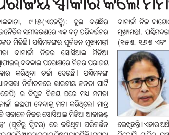
କୋଲକାତା, ୯।୫ (ଏକେନି): ପଶ୍ଚିମବଙ୍ଗର ପୂର୍ବତନ ମୁଖ୍ୟମନ୍ତ୍ରୀ ମମତା ବାନାର୍ଜୀ ନିଜର ସୋସିଆଲ ମିଡିଆ ଆକାଉଣ୍ଟ 'ଏକ୍ସ' (ପୂର୍ବରୁ ଟ୍ୱିଟର) ରେ କଲେ ପରିବର୍ତ୍ତନ କରିଛନ୍ତି। ଏହାର ଅର୍ଥ ଏବେ ନିଜକୁ କେବଳ ପୂର୍ବତନ ତିନୋଟି ପାର୍ଲିମେଣ୍ଟ ମୁଖ୍ୟମନ୍ତ୍ରୀ ଭାବେ ଦର୍ଶାଇଛନ୍ତି।

ଶନିବାର ପଶ୍ଚିମବଙ୍ଗରେ ବିଜେପି ପ୍ରଥମ ମୁଖ୍ୟମନ୍ତ୍ରୀ ଭାବେ ଶୁଭେନ୍ଦୁ ଅଧିକାରୀ ଶପଥ ଗ୍ରହଣ କରୁଥିବା ବେଳେ ମମତାଙ୍କର ଏହି ପଦକ୍ଷେପକୁ 'ପରାଜୟ ସ୍ୱୀକାର' ବୋଲି କୁହାଯାଇଛି। ୨୯୪ ଆସନ ବିଶିଷ୍ଟ ବିଧାନସଭାରେ ବିଜେପି ୨୦୭ଟି ଆସନ ପାଇଥିବା ବେଳେ ତୃଣମୂଳ କଂଗ୍ରେସ ମାତ୍ର ୮୦ଟି ଆସନରେ ସାମିଲ ରହିଛି। ମମତା ବାନାର୍ଜୀ ପୂର୍ବରୁ ନିର୍ବାଚନରେ କୌଣସି ପ୍ରକାର ଚକ୍ରାନ୍ତ ହୋଇଥିବା ଅଭିଯୋଗ କରି ଇସ୍ତଫା ଦେବେ ନାହିଁ ବୋଲି କିଏ ଧରିଥିଲେ। ମାତ୍ର ସୋସିଆଲ ମିଡିଆରେ ଏହି ପରିବର୍ତ୍ତନ ପରେ ରାଜ୍ୟରେ ୧୫ ବର୍ଷର ଟିଏମ୍‌ସି ଶାସନର ଅନ୍ତ ଘଟିଥିବା ଏବେ ସ୍ପଷ୍ଟ ଜଣାପଡ଼ିଛି।