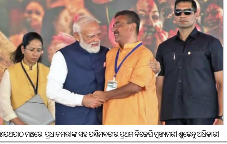
ଶପଥପାଠ ମଧ୍ୟରେ ପ୍ରଧାନମନ୍ତ୍ରୀଙ୍କ ସହ ପଶ୍ଚିମବଙ୍ଗର ପ୍ରଥମ ବିଜେପି ମୁଖ୍ୟମନ୍ତ୍ରୀ ଶୁଭେନ୍ଦୁ ଅଧିକାରୀ

୮ ବିଲିୟନ ଡଲାରରୁ ଅଧିକ ଅର୍ଥ ପଠାଇଥାନ୍ତି। ଶ୍ରମିକ ବହିଷ୍କୃତ ହେବା ପାକିସ୍ତାନରୁ ଅର୍ଥନୀତି ପାଇଁ ଏକ ବଡ଼ ଝଟକା ସାଧ୍ୟ ହୋଇଛି। ଯୁଏଇ ଏହି ବିଷୟରେ କୌଣସି ସ୍ପଷ୍ଟ ସୂଚନା ଦେଇ ନଥିବା ବେଳେ ପାକିସ୍ତାନ ଏହାକୁ ଏକ ବଡ଼ ଧରଣର ବହିଷ୍କାର ବୋଲି ମାନିବାକୁ ମନା କରିଛି। ତେବେ ଉପସାହାରୀୟ ଅଞ୍ଚଳରେ ବହୁଥିବା ଅସ୍ଥିରତା ମଧ୍ୟରେ ଏହି ଘଟଣା ହୁଇ ଦେଶର ସମ୍ପର୍କରେ ପାଟ ସୃଷ୍ଟି କରିଛି।