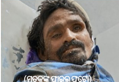
(ମୁତକଙ୍କ ପାଇଲ ପଟୋ)