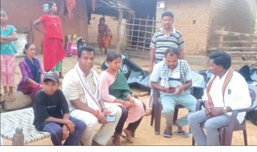
ବୈପାରାଗୁଡ଼ା, ୨୮।୫(ସମିଧ): ଅଧିନିଆ କାଳବୈଶାଖୀ ପ୍ରଭାବରେ ଅସହାୟ ଭାଇ ଭଉଣୀଙ୍କ ଘର ଛାଡ଼ି ନଷ୍ଟ ହୋଇଥିବା ବେଳେ ଉକ୍ତ ପରିବାରକୁ ସାହାଯ୍ୟର ହାତ ବଢ଼ାଇଲେ ଅନାଥ ଦିଆନ। ବୈପାରାଗୁଡ଼ା ବ୍ଲକ ଦଶାବାଡ଼ି ପଞ୍ଚାୟତର ବାଲୁଲିୟତି ଗାଁର ବାପା ମାଆ। ଛେନ୍ଦେଝି ଅଥ ଲକ୍ଷ୍ମୀ ଖୁଲ ଏବଂ ପୁଅ ରାଜେଶ୍ୱର ଖୁଲଙ୍କୁ ସହଯୋଗ କରିଛନ୍ତି କୋଟପାଡ଼ର କଂଗ୍ରେସ ବିଧାନ ସଭା ପାର୍ଟି ଅନାଥ ଦିଆନ। ସୂଚନା ଆଉଁଳ, ମଙ୍ଗଳବାର ଦିନ ବୈପାରାଗୁଡ଼ା ଅଞ୍ଚଳ

କାଳ ବୈଶାଖୀର ପ୍ରଭାବରେ ବ୍ୟାପକ କ୍ଷୟକ୍ଷତି ହୋଇଛି। ବିଶେଷ କରି ବୁଲ୍ ବନ୍ଧାବାଡ଼ି ପଞ୍ଚାୟତର ବାଲୁଲିୟତି ଗାଁର ଅସହାୟ ଅନାଥ ଭାଇ ଭଉଣୀଙ୍କ ଘର ଆକସ୍ମିକ ଛପର ପବନରେ ସମ୍ପୂର୍ଣ୍ଣ ଭଡ଼ିଯାଇ ନଷ୍ଟ ହୋଇଛି। ରାଜସ୍ୱ ନିରୀକ୍ଷକଙ୍କୁ କେବଳ ଜରି ପାଲ ଦିଆଯାଇଛି। ସ୍ୱାୟତ୍ତ ପକ୍ଷରେ କେବଳ ଦେଶୀ ସହାୟତା ସହାୟତା ଲୋକ କାରି ପାଲ ଦେଇ ପ୍ରଶାସନିକ ଅବହେଳା ଦେଖାଯାଇଛି। ଘର ନଷ୍ଟ ପରେ ବେସାହାରା ହୋଇ ପଡିରହିଛନ୍ତି ବୁଲ୍