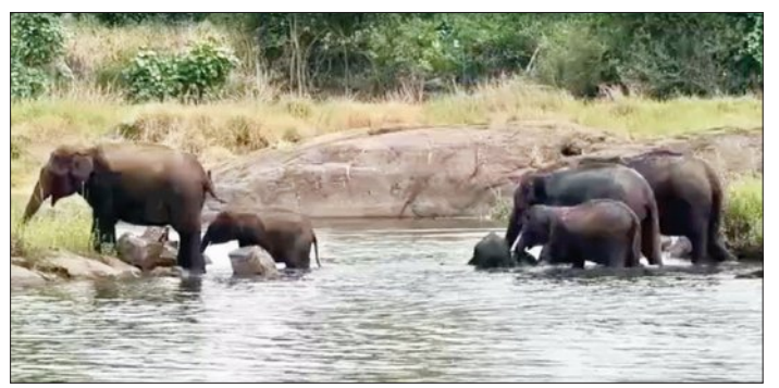
ସମ୍ବଲପୁର : ପ୍ରତ୍ୟକ୍ଷ ଗ୍ରୀଷ୍ମ ପ୍ରବାହରେ ଯୁଯୋପୁରୀ ଅଞ୍ଚଳରେ ପାଣିରେ ହାତୀପଲ।

କାଳବୈଶାଖୀ ବା ଝଡ଼ ବର୍ଷା ପବନ ନ ହୋଇ ମଧ୍ୟ ଗଛରୁ ତାଳ ଭାଙ୍ଗି ପଡ଼ିବା ପଳରେ ଏହି କଳାକୃତି ତୁରମାର ହୋଇଯାଇଛି। ଏଥିରେ ଏପ୍ରଥମେ ମେଟେରିଆଲ ବ୍ୟବହାର ହୋଇଥିବା ଜଣାପଡ଼ିଛି। ତେବେ, ପ୍ରତିକୃତି ସକାଶେ ସ୍ଥାନ ତରଫରୁ ଏବଂ କାମର ଗୁଣବତ୍ତାକୁ ନେଇ ପ୍ରଶ୍ନ ରୁଦ୍ଧ। ପୁନଃ ନିର୍ମାଣ ସକାଶେ ଯେଉଁ ଖର୍ଚ୍ଚ ହେବ ତାହା କିଏ ବହନ କରିବ? ଏହି କାର୍ଯ୍ୟର ନିରାପେକ୍ଷ ତଦନ୍ତ ସକାଶେ ସାଧାରଣରେ ଦାବି ହେଉଛି।