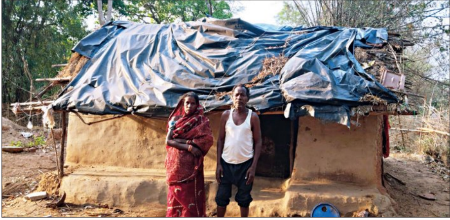
କୁଆମରା, ୨୮ ୧୫ (ସମ୍ପାଦକ)

ଦାରିଦ୍ର୍ୟ ଯାମାରଣେ ଚଳେ ବସବାସ କରୁଥିବା ଲୋକଙ୍କ ପାଇଁ ସରକାର ଆବସ ଯୋଜନା ଯୋଗାଇ ଦେଉଥିବାବେଳେ ଏହାର ପ୍ରକୃତ ହିତାଧିକାରୀ ଯୋଜନାରୁ ବଞ୍ଚିତ ହେଉଛନ୍ତି। ମାତ୍ର ପାଇବା ଉଠାଉଛନ୍ତି ରାଜନେତା ଓ