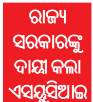
ରାଜ୍ୟ ସରକାରଙ୍କୁ ଦାୟା କଲା ଏସୟସିଆଇ