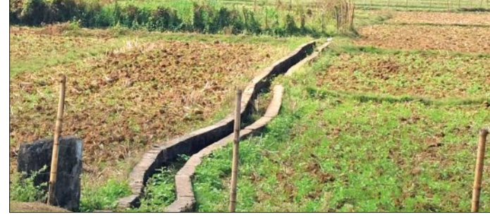
ଭୟ ବଢ଼ାଇ ମରୁଡ଼ି ପରିସ୍ଥିତି

ଅସୁରାଳି, ୨୫.୫ (ସମିପ) ଓଡ଼ିଶାର କୃଷି ପରମ୍ପରା ଅନୁସାରେ ପବିତ୍ର ଅକ୍ଷୟତୀୟା ଖରିପୁରୁ ଅନୁକୂଳ ସମୟ ଆରମ୍ଭ ହୋଇଥିବା ଚାଷୀ ଏହି ଦିନଠାରୁ ଅଖୁମୁଠି ଅନୁକୂଳ କରି କୃଷିକାର୍ଯ୍ୟର ଶୁଭାରମ୍ଭ କରିଥାଏ। ଚଳିତ ବର୍ଷ ଧାମନଗର ବ୍ଲକ୍ରେ ପ୍ରାୟ ୧୫ ହଜାର ହେକ୍ଟର ଜମିରେ ଖରିପୁ ଧାନଚାଷ ପାଇଁ ଲକ୍ଷ୍ୟ ଧାର୍ଯ୍ୟ କରାଯାଇଛି ଏବଂ ସରକାରୀସ୍ତରରେ ବିହନ ଷ୍ଟକ୍ ମଧ୍ୟ ଉପଲବ୍ଧ ରହିଛି। ମାତ୍ର ଚଳିତ ବର୍ଷର ପ୍ରଚଣ୍ଡ ଚୋରାପତ ଓ ଅଧିକାଂଶ ପାଣିର ସାରା ଅଞ୍ଚଳର ଚାଷୀମାନଙ୍କୁ ଚିନ୍ତା ବଢ଼ାଇ ଦେଇଛି। ଆକାଶରୁ ନିଆଁ ବର୍ଷିବା ଭଳି ପରିସ୍ଥିତି ସୃଷ୍ଟି ହୋଇଥିବାରୁ ଚାଷୀ ଜମିରେ ଧାନ ବିହନ ବୁଣିବାକୁ ସାହସ କୁଟାଳପାତୁ ନାହିଁ। ବିହନ ଧାଇଁ ମଧ୍ୟ ବୁଣିବା ନେଇ ଏକ ବଡ଼ ଅନିଶ୍ଚିତତା ଦେଖାଦେଇଛି। ଅଞ୍ଚଳରେ ଜଳସେଚନ ବ୍ୟବସ୍ଥା ବିପର୍ଯ୍ୟୟ ହୋଇପଡ଼ିଛି। କହିବାକୁ ଗଲେ ଜଳସେଚନର ସ୍ଥିତି ବିଶ୍ୱସ୍ତରେ ନ ଚଳି କରିବା ହିଁ ଭଲ। ନାମକୁ ମାତ୍ର କେନାଲ ଏବଂ ପୁଲ୍ ସହ ରହିଛି, ହେଲେ ସେଥିରେ ଗୋପାଏ ପାଣି ନାହିଁ। ବାରମ୍ବାର ଅଭିଯୋଗ ସତ୍ତ୍ୱେ କେନାଲ ତିନିଜନ ପାଣିରେ ଥିବା ଅଧିକାରୀମାନେ ପୁଲ୍ ସହ କୋଣିଶା ସଂସ୍କାରମୂଳକ ପଦକ୍ଷେପ ନେଇନାହାନ୍ତି। ପକରେ କେନାଲ ଉପରେ ନିର୍ଭର କରୁଥିବା ହଜାର ହଜାର ଚାଷୀ ଏବେ ସମ୍ପୂର୍ଣ୍ଣ ଅସହାୟ ହୋଇପଡ଼ିଛନ୍ତି। ଜଳସେଚନର ବିକଳ ବ୍ୟବସ୍ଥା ନ ଥିବାରୁ ଚାଷୀମାନେ ସେମାନଙ୍କ ପାରମ୍ପରିକ ଧାରା ଅନୁସାରେ କେବଳ ଉତ୍ତରଦେବ (ବର୍ଷା) ଉପରେ ଭରସା କରି ବସିଛନ୍ତି। ମାତ୍ର ଜୁନ ମାସ ଆରମ୍ଭ ହେବାକୁ ଥିଲେ ମଧ୍ୟ ପାଗ ଅନୁକୂଳ ହେବାର କୋଣିଶା ଲକ୍ଷଣ ଦେଖାଯାଉନାହିଁ। ବର୍ଷାର ସ୍ୱଚ୍ଛତା ଏବଂ ପ୍ରତୀକ୍ଷା ଯୋଗୁଁ ଚଳିତ ବର୍ଷ ଅଞ୍ଚଳରେ ଏକ ଭୟଙ୍କର 'ମରୁଡ଼ି'ର କରାଳ ଛାୟା ସୃଷ୍ଟି କରିଛନ୍ତି।