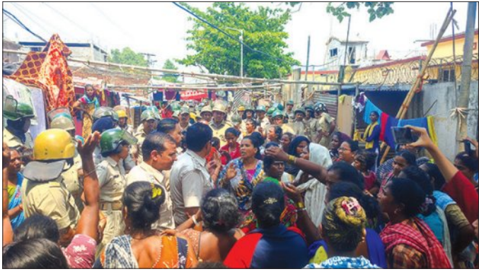
ଅପରାଧ ନିୟନ୍ତ୍ରଣ ପାଇଁ ଜିଲ୍ଲା ପୁଲିସର ପଦକ୍ଷେପ

ରାୟଗଡ଼, ୨୪।୫ (ସମିପ): ଚଳିତ ମାସ ୯ ତାରିଖରେ ରାୟଗଡ଼ ସହର ଆନ୍ଦୋଳନ (ରେଲି ସାହି) ସାହିର ହାତୁଡ଼ା ନିଖୁଳ ହତ୍ୟା ମାମଲାରେ ପୋଲିସ୍ ବର୍ତ୍ତମାନ ପୁଣି ୧୨କଣକୁ ଗିରଫ କରିଥିବା ବେଳେ ଏଥିରେ ଜଡ଼ିତ ଥିବା ଅନ୍ୟ ଅପରାଧୀଙ୍କୁ ଧରିବାକୁ ତଦନ୍ତ ଜାରି ରଖିଛି । ତେବେ ନିଖୁଳ ହତ୍ୟା ଘଟଣାକୁ ନେଇ ପରିସ୍ଥିତି ଉପରେ ନିୟନ୍ତ୍ରଣ ପାଇଥିବା ବେଳେ ଘଟଣାର ୧୬ଦିନ ପରେ ପୁଣି ଗତ ଶୁକ୍ରବାର ରାତିରେ ରେଲି ସାହି ଓ ପିଟଲା ସାହି ମଧ୍ୟରେ ଗୋଷ୍ଠୀ ସଂଘର୍ଷ ହୋଇଥିଲା । ଯାହାକୁ ଶନିବାର ଦିନ ପୋଲିସ୍ ପକ୍ଷରୁ ରେଲି ସାହି ଏବଂ ପିଟଲା ସାହିରେ ଫୁଲ ମାଟି କରାଯାଇଥିଲା । ଏଥି ସହିତ ମୃତ ନିଖୁଳଙ୍କ ବାପା ହାତୁଡ଼ା