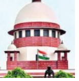
ୟୁଏପିଏ ମାମଲାରେ ବି ଜାମିନ ମିଳିପାରିବ

■ ନୂଆଦିଲ୍ଲୀ, ୧୮।୫ (ଏକେନ୍ଦ୍ରି): କଠୋର ଦେଆଇନ କାର୍ଯ୍ୟକଳାପ (ନିଷ୍ପେଧ) ଆଇନ (ୟୁଏପିଏ) ଅନ୍ତର୍ଗତ ମାମଲାଗୁଡ଼ିକରେ ମଧ୍ୟ ଅଭିଯୁକ୍ତଙ୍କୁ ଜାମିନ ମିଳିପାରିବ। ଏହି ମାମଲାରେ 'ଜାମିନ ଏକ ନିୟମ ଏବଂ ଜେଲ ଏକ ବ୍ୟତିକ୍ରମ' ବୋଲି ସୁପ୍ରିମ କୋର୍ଟ ପୂର୍ବରୁ ନିର୍ଦ୍ଧାରିତ କରିଥିବା ଆଇନଗତ ନୀତି ମଧ୍ୟ ପ୍ରଯୁଜ୍ୟ। ଦ୍ୱିତୀୟ ଶ୍ରେଣୀ ଏବଂ ଜାମିନ ମାମଲାରେ ଭାରତୀୟ ସମ୍ବିଧାନ ଦ୍ୱାରା ପ୍ରଦତ୍ତ ଅଧିକାରକୁ କୌଣସି ନାଗରିକଙ୍କୁ ବଞ୍ଚିତ