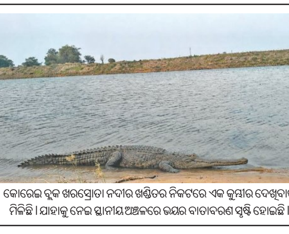
କୋରେଇ ବୁକ୍ ଖରସୋତା ନଦୀର ଖଣ୍ଡିତର ନିକଟରେ ଏକ କୁସୀର ଦେଖିବାକୁ ମିଳିଛି । ସାହାଯ୍ୟ ନେଇ ସ୍ଥାନୀୟ ଅଞ୍ଚଳରେ ଭୟର ବାତାବରଣ ସୃଷ୍ଟି ହୋଇଛି ।

ଧର୍ମଶାଳା, ୧୮।୫ (ସମିପ): ଧର୍ମଶାଳା ଥାନା ଅନ୍ତର୍ଗତ ଚଣ୍ଡିଖୋଲ-ପାରାଦୀପ ୫୩ନଂ ଜାତୀୟ ରାଜପଥ ବୁଢ଼ପୁର ନିକଟରେ ରାଷ୍ଟ୍ର ପାଖରେ ଏକ କେବିନ ପକାଇ ଚୋରିକ ବ୍ୟକ୍ତି ପ୍ରତିଦିନ ହଜାର ହଜାର ଲିଟର ପେଟ୍ରୋଲ ଓ ଡିଜେଲ ବିଭିନ୍ନ ଗାଡ଼ି ଗୁଡ଼ିକରୁ ଚୋରାକରି କାଢ଼ି ବିକ୍ରି କରୁଥିବା ସ୍ଥାନୀୟ ଲୋକେ ଅଭିଯୋଗ କରିଛନ୍ତି । ସୂଚନା ମୁତାବକ ବ୍ୟକ୍ତି ଜଣକ ବୁଢ଼ପୁର ନିକଟ ୫୩ନଂ ରାଜପଥ କଡ଼ରେ ଦୀର୍ଘ ଏକମାସ ହେବ ଏକ କେବିନ ପକାଇ ରାଜପଥରେ ଯାତାୟତ କରୁଥିବା ତେଲ ଚ୍ୟାକର ସହ ବିଭିନ୍ନ ଗାଡ଼ି ଗୁଡ଼ିକରୁ ତ୍ରାଉଭରମାନଙ୍କୁ ହାତକରି ଖୋଲାମାଖୁଳା ଭାବରେ ଦିନ ଓ ରାତି ନିର୍ଭୟରେ ଚୋରାକରି ପେଟ୍ରୋଲ ଓ ଡିଜେଲ କାଢ଼ି ବିକ୍ରି କରୁଥିବା ଦେଖିବାକୁ ମିଳୁଛି । ଜାତୀୟ ରାଜପଥର କଣ୍ଠିଗଡ଼ିଆ, ବୁଢ଼ପୁର ଓ ଶ୍ରୀରାମପୁର ଛକ ଗୁଡ଼ିକରେ ଗାଡ଼ି ଛିଡ଼ା କରି ତେଲ ଫାନ୍ତ କରି ସ୍ଥାନୀୟ ଅଞ୍ଚଳର ଟ୍ରାକ୍ଟର ମାଲିକଙ୍କ ସହ ବିଭିନ୍ନ ସ୍ଥାନରେ ତେଲ ବିକ୍ରି କରୁଛନ୍ତି । ଏଥିଲାଗି ସେ କିଛି ଲୋକଙ୍କୁ ନିୟୁକ୍ତି ଦେଇ ମୋଟା ଅଞ୍ଚଳ ଦରମା ଦେଇ ଏହି ଚୋରା ତେଲ ବେପାର ଚଳାଇଥିବା ନେଇ ସ୍ଥାନୀୟ ଲୋକେ ଅଭିଯୋଗ କରିଛନ୍ତି । ବରମାନ ଦେଶରେ ତେଲ ଅଭାବ ସମୟରେ ବ୍ୟକ୍ତି ଜଣକ ହଜାର ହଜାର ଲିଟର ଚୋରା ତେଲ ବ୍ୟବସାୟ କରୁଥିବା ସାଧାରଣରେ ଅଲୋଚନା ହେଉଛି । ପୁଲିସ ପ୍ରଶାସନ ତରଫରୁ ପାଟ୍ରୋଲି ଜାରି ରହିଥିବା ବେଳେ ଏପରି ଖୋଲାମାଖୁଳା ଭାବେ କେବିନ ଓ ରାଷ୍ଟ୍ର ଉପରେ ବହୁତ ତଦା ରଖି ବ୍ୟକ୍ତି ଜଣକ କିପରି ଚୋରା ତେଲ ବେପାର କରୁଛନ୍ତି ତାହା ସାଧାରଣରେ ପ୍ରଶ୍ନବାଚି ସୃଷ୍ଟି କରିଛି । ଏଥିପ୍ରତି ଜାତୀୟ ରାଜପଥ କର୍ତ୍ତୃପକ୍ଷ ଓ ଯାଜପୁର ଏସ୍ପି ଦୁର୍ଦ୍ଧା ଦେବାକୁ ସାଧାରଣରେ ଦାବି ହୋଇଛି ।