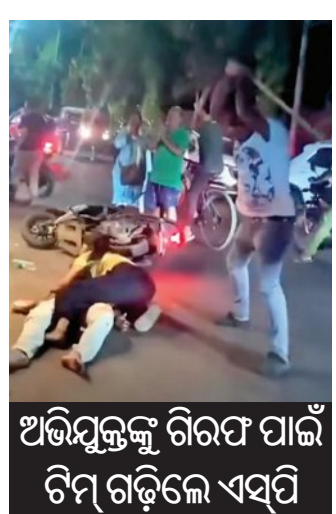
ଅଭିଯୁକ୍ତଙ୍କୁ ଗିରଫ ପାଇଁ ଟିଏ ଗଢ଼ିଲେ ଏସପି

■ ବ୍ରହ୍ମପୁର, ୧୮।୫ (ସମ୍ବିଧ): ରାସ୍ତା ଉପରେ ଗାଳିଗୋରୁକୁ ପିଟିବା ପରି କାଠ ପାଲିଆରେ ଯୁବକଙ୍କୁ ନିଷ୍ପତ୍ତ ମାଡ଼। ଜଣେ ଯୁବକ ସମ୍ପୃକ୍ତ ଯୁବକଙ୍କୁ ରକ୍ଷା କରିବା ପାଇଁ ଉଦ୍ୟମ କରି ବି ବିପଦ ହେଉଛି। ସ୍ଥାନୀୟ ଗିରି ରୋଡ଼ ଅଞ୍ଚଳର ଏହି ଘଟଣାର ବିଡ଼ିଓ ସାରା ରାଜ୍ୟରେ ଆଲୋଚନା ସୃଷ୍ଟି କରିଛି। ଆଉ ପାହାରେ ବୁଲୁ ପାହାରେ ବସିଥିଲେ ବା ଅଜାଗାରେ ମାଡ଼ିବିଏ ହୋଇଥିଲେ ବାଲିଆ ପରି ଆଉ ଗୋଟିଏ ଘଟଣାର ପୁନରାବୃତ୍ତି ହେବା ଏକପ୍ରକାର ନିଶ୍ଚିତ ଥିଲା। ବାଲିଆ ଯୋମରଞ୍ଜନ ସାଇଲ୍ସ ପିଟିପିଟି ହତ୍ୟା କରିବା ପରି ବ୍ରହ୍ମପୁର ସହରରେ ଘଟିଥିବା ଏହି ଘଟଣା ରାଜ୍ୟର ତଳମୁହାଁ ଆଇନଶୁଖିଲା ପରିସ୍ଥିତିକୁ ଦର୍ଶାଇଛି। ବିଡ଼ିଓଙ୍କୁ ହେଉଛି ପୁଲିସର ମିଳିତ ଛବିକୁ ତଳମୁହାଁ କରିବା ପାଇଁ 'ମିଶନ ଏକ୍ସକାର୍ଡ'କୁ ବି ଅପରାଧୀ ଖାତିର କରୁ ନ ଥିବା ପ୍ରମାଣିତ ହୋଇଛି।