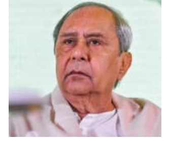
ସରକାର ରାଜ୍ୟକୁ ଅପରାଧୀଙ୍କ ହାତକୁ ଟେକି ଦେବା ପରି ଲାଗୁଛି

■ ଭୁବନେଶ୍ୱର, ୧୯।୫ (ସମ୍ପାଦକ): ବୁଦ୍ଧପୁର ସହରରେ ଦିନକତଳେ ଜଣେ ଯୁବକ ଓ ଯୁବତୀଙ୍କୁ ରାଷ୍ଟ୍ରାତ୍ମକ ପରଶୋକ ଆକ୍ରମଣ ଘଟଣାକୁ ନେଇ କଡ଼ା ପ୍ରତିକ୍ରିୟା ପ୍ରକାଶ କରିଛନ୍ତି ବିରୋଧୀ ଦଳ ନେତା ନବୀନ ପଟ୍ଟନାୟକ। ଓଡ଼ିଶାରେ ବିଜେପି ଶାସନ ନୁହେଁ; ବରଂ ଗୁଣ୍ଡାରାଜ ଚାଲିଛି ବୋଲି ସାମାଜିକ ଗଣମାଧ୍ୟମ 'ଏକ୍ସ'ରେ ଷୋଭା ପ୍ରକାଶ କରିଛନ୍ତି ନବୀନ। ନବୀନ କହିଛନ୍ତି ଯେ ବୁଦ୍ଧପୁରର ବିକ୍ ରାଷ୍ଟ୍ରାତ୍ମକ ଜଣେ ଯୁବକ ଏବଂ ମହିଳାଙ୍କୁ ସର୍ବସମ୍ମୁଖରେ ଅତି ନିର୍ମମ ଭାବେ ପିଟି ପିଟି ପରଶୋକ ଆକ୍ରମଣ କରାଯିବାର ଦୃଶ୍ୟ ଅତ୍ୟନ୍ତ ଅନାଗୁଣ୍ୟ। ସାରା ଓଡ଼ିଶାବାସୀଙ୍କୁ ଏହା ଆତଙ୍କିତ କରିବାକୁ ଚେଷ୍ଟା କରାଯାଉଛି।