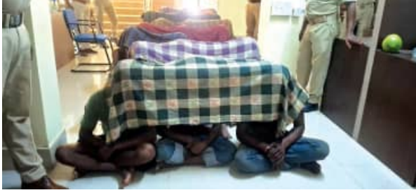
ବସ୍ତାରେ ଶବ ପୁରାଇ ଜଙ୍ଗଲରେ ଘୋଡ଼ିଥିଲେ ୧୦ ଦିନ ପରେ ଜଙ୍ଗଲରୁ ହାଡ଼ ଓ ପାଉଁଶ ଜବତ ୨୫ ଅଭିଯୁକ୍ତ ଗିରଫ; ତାଳପୁଣ୍ଡି ପୁରୁଷଗୁଣ୍ୟ

■ ତିରିଗିଆ/ବଡ଼ମୁଣ୍ଡା, ୧୯।୫ (ସମ୍ପାଦକ): ଗୁଣିଗାରେଡ଼ି ସହରରେ ଯୁବକଙ୍କୁ ଗାଁ ଦାଣ୍ଡରେ ହାଣି ଖଣ୍ଡଖଣ୍ଡ କରିଦେଲେ। ପରେ ପ୍ରମାଣ ଲୁଚାଇବା ପାଇଁ ଖଣ୍ଡଖଣ୍ଡିତ ମୃତଦେହକୁ ବସ୍ତାରେ ପୁରାଇ ଜଙ୍ଗଲ ଭିତରେ ଢାଳିଦେଲେ। ଖାଲି ସେତିକି ନୁହେଁ, ଅଧାପୋଡ଼ା ମୃତଦେହର ଅବଶିଷ୍ଟ ଏବଂ ହାଡ଼ ଓ ପାଉଁଶକୁ ସେହି ଜଙ୍ଗଲ ମଧ୍ୟରେ ମାଟି ତଳେ ଘୋଡ଼ିଦେଲେ। କଟକ ଜିଲ୍ଲା ଅଧୀନ ବଡ଼ମୁଣ୍ଡା ବ୍ଲକ୍ ମାଣିଆବନ୍ଧ ଥାନା ଅଧୀନ ଚାଳିପୁଣ୍ଡି ଗ୍ରାମରେ ଏପରି ଏକ ନୃଶଂସ ହତ୍ୟାକାଣ୍ଡ ଘଟିଛି। ଗତ ୧୦ ତାରିଖରେ ଏହି ଲୋମଟାଳୁରା ହତ୍ୟାକାଣ୍ଡ ଘଟିଥିବା ବେଳେ ଆଜି ପଦାକୁ ଆସିଛି। ଏହି ଘଟଣାରେ