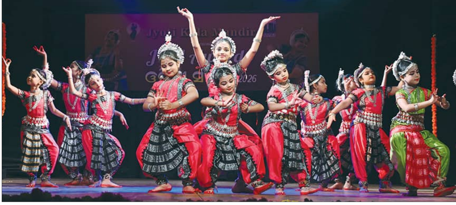
ଭଞ୍ଜକଳା ମଣ୍ଡପଠାରେ ଜ୍ୟୋତି କଳା ମନ୍ଦିର ପକ୍ଷରୁ ଓଡ଼ିଶା ନୃତ୍ୟ ଉତ୍ସବ