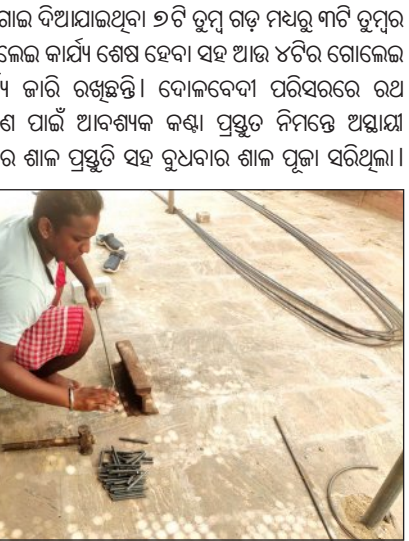
ଏହାର ଶୁଭ ଦେଇ ଓଝା ସେବକ ଅରକଣ୍ଠା ନିର୍ମାଣ ଆରମ୍ଭ କରିଛନ୍ତି। ତିନିରଥର ଅରକଣ୍ଠା ନିର୍ମାଣ ପାଇଁ ୧୦ ଏମ୍‌ଏମ୍‌ ସାଇକଲ ଲୁହାରର କିଟ୍ କାର୍ଯ୍ୟ ଓଝା ସେବକମାନେ ଜାରି ରଖିବା ସହ ଅରକଣ୍ଠା ନିର୍ମାଣ ଆରମ୍ଭ କରିଛନ୍ତି।

ଯୋଗାଇ ଦିଆଯାଇଥିବା ୬ଟି ରୁମ୍ଠ ଗଢ଼ ମଧ୍ୟରୁ ୩ଟି ରୁମ୍ଠ ଗୋଲେଇ କାର୍ଯ୍ୟ ଶେଷ ହେବା ସହ ଆଉ ୪ଟିର ଗୋଲେଇ କାର୍ଯ୍ୟ ଜାରି ରଖିଛନ୍ତି। ବୋଲେଦେବା ପରିସରରେ ରଥ ନିର୍ମାଣ ପାଇଁ ଆବଶ୍ୟକ କଣ୍ଠା ପ୍ରସ୍ତୁତ ନିମନ୍ତେ ଅସ୍ଥାୟୀ କମାର ଶାଳ ପ୍ରସ୍ତୁତ ହେ ବୁଧବାର ଶାଳ ପୂଜା ଅନୁଷ୍ଠାନ। ଏହାର ଶୁଭ ଦେଇ ଓଝା ସେବକ ଅରକଣ୍ଠା ନିର୍ମାଣ ଆରମ୍ଭ କରିଛନ୍ତି। ତିନିରଥର ଅରକଣ୍ଠା ନିର୍ମାଣ ପାଇଁ ୧୦ ଏମ୍‌ଏମ୍‌ ସାଇକଲ ଲୁହାରର କିଟ୍ କାର୍ଯ୍ୟ ଓଝା ସେବକମାନେ ଜାରି ରଖିବା ସହ ଅରକଣ୍ଠା ନିର୍ମାଣ ଆରମ୍ଭ କରିଛନ୍ତି।