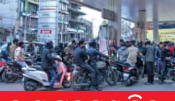
ବାୟୁ ପ୍ରଦୂଷଣ ଚିକ୍ତା

ନୂଆଦିଲ୍ଲୀ, ୧୧/୪ (ଏକେନ୍ଦ୍ର): ରାଜଧାନୀ ଦିଲ୍ଲୀର ବାୟୁ ପ୍ରଦୂଷଣ ସମସ୍ୟାର ସମାଧାନ ପାଇଁ ସରକାର ଏକ ବୈଦ୍ୟୁତିକ ପଦକ୍ଷେପ ଗ୍ରହଣ କରିଛନ୍ତି। ପରିବହନ ବିଭାଗ ପକ୍ଷରୁ ପ୍ରକାଶିତ 'ଇଲେକ୍ଟ୍ରିକ୍ ଭେହିକଲ୍ (ଇଭି) ଡ୍ରାପ୍' ପଲିସି ୨୦୨୬-୨୦୩୦ ଅନୁସାରେ, ଆଗାମୀ ଦିନରେ ଯେତେଲ ଚାଳିତ ଯାନଗୁଡ଼ିକ ଉପରେ କଠୋର କଟକଣା ଲଗାଯିବ ସହ ବୈଦ୍ୟୁତିକ ଯାନ ଚଳାଚଳକୁ ପ୍ରୋତ୍ସାହନ ଦେବା ପାଇଁ ଏକ ବୃହତ୍ ରୋଡମାପ ପ୍ରସ୍ତୁତ କରାଯାଇଛି। ଏହି ନୂତନ ନୀତିରେ ଯେତେଲ ଓ ଡିଜେଲ ଯାନଗୁଡ଼ିକୁ ପର୍ଯ୍ୟାୟକ୍ରମେ ବନ୍ଦ କରିବା ପାଇଁ ସ୍ପଷ୍ଟ ସମୟସୀମା ଧାର୍ଯ୍ୟ କରାଯାଇଛି। ଏହିକ୍ରମରେ ୨୦୨୮ ଏପ୍ରିଲ ପହିଲାରୁ ଦିଲ୍ଲୀରେ କୌଣସି ନୂତନ ଯେତେଲ ଚାଳିତ ଦୁଇ ଚକିଆ ଯାନ ପଞ୍ଜୀକରଣ କରାଯିବ ନାହିଁ। ସେହିପରି ୨୦୨୬ ଜାନୁଆରୀ ୧୫ କେବଳ ବୈଦ୍ୟୁତିକ ଚଳିତକିଆ ଯାନ ପଞ୍ଜୀକରଣ ପାଇଁ ଅନୁମତି ଦିଆଯିବ। ଯାନ ପଞ୍ଜୀକରଣ କରାଯିବ ନାହିଁ। ସେହିପରି ୨୦୨୬ ଜାନୁଆରୀ ୧୫ କେବଳ ବୈଦ୍ୟୁତିକ ଚଳିତକିଆ ଯାନ ପଞ୍ଜୀକରଣ ପାଇଁ ଅନୁମତି ଦିଆଯିବ। ଏହାଛଡା ଯାନ ଉପରେ ବ୍ୟାଟେରୀ ସମତା ଦୁଇ ଚକିଆ ଯାନ ଓ ହାଲୁକା ମାଲବାହୀ ଅନୁସାରେ ସର୍ବସିଡି ପ୍ରଦାନ କରାଯିବ। ପୁରୁଣା ଯାନଗୁଡ଼ିକ ୨୦୨୬ ଜାନୁଆରୀ ୧୫ କେବଳ