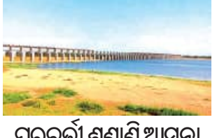
ପରବର୍ତ୍ତୀ ଶୁଖାଣି ଆସନ୍ତା ୨୦ ଚାରିଖକୁ ଧାର୍ଯ୍ୟ