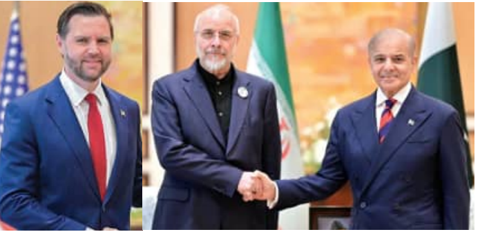
ଆକ୍ରମଣ କରାଯିବ। ଇରାନକୁ ସେ ଏକ ଅନୁଯାୟୀ ଆମେରିକା ଓ ଇରାନର ପ୍ରତିନିଧି ଦଳ ପ୍ରଥମେ ପୃଥକ ପୃଥକ ଭାବେ ପାକିସ୍ତାନର ପ୍ରତିନିଧି ଦଳଙ୍କ ସହ ଆଲୋଚନା କରିଥିଲେ। ଯୁଦ୍ଧବିରତି ଆଲୋଚନା ପାଇଁ ସେମାନେ ନିଜ ନିଜର ସର୍ତ୍ତ ପାକିସ୍ତାନ କରିଥାନ୍ତେ ଅନ୍ୟ ପକ୍ଷକୁ ଦେଖିଥିଲେ। ଏଥିରେ ଅଗ୍ରଗତି ହେବାପରେ ଇରାନ ଓ ଆମେରିକା ପ୍ରତିନିଧି ଦଳଙ୍କ ମଧ୍ୟରେ ସିଧାସଳଖ

ଇସଲାମାବାଦ/ଝାଞ୍ଚିଟନ, ୧୧/୪ (ଏକେନ୍ଦ୍ର): ଯୁଦ୍ଧବିରତି ଘୋଷଣା ହେବାର ତିନି ଦିନ ପରେ ମଧ୍ୟପ୍ରାଚ୍ୟରେ ଶାନ୍ତି ପ୍ରତିଷ୍ଠା ଲାଗି ଇରାନ ଓ ଆମେରିକା ମଧ୍ୟରେ ଆଜି ଆଲୋଚନା ଆରମ୍ଭ ହୋଇଛି। ପାକିସ୍ତାନ ମଧ୍ୟସ୍ତରରେ ରାଜଧାନୀ ଇସଲାମାବାଦରେ କଡ଼ା ସୁରକ୍ଷା ମଧ୍ୟରେ ଆଲୋଚନା ଆରମ୍ଭ ହୋଇଥିବା ବେଳେ ଏହା ଉପରେ ସାରା ବିଶ୍ୱର ନଜର ରହିଛି। କେତେକ ସମସ୍ୟାକୁ ନେଇ କଥାବାର୍ତ୍ତା ୫ ଘଣ୍ଟା ବିଳମ୍ବରେ ଆରମ୍ଭ ହୋଇଥିବାର ସୂଚନା ଦେଇଛନ୍ତି ଆମେରିକାର ରାଷ୍ଟ୍ରପତି ଟ୍ରମ୍ପ। ଇସଲାମାବାଦରେ ଆଲୋଚନା ଚାଲିଥିବା ବେଳେ ବିବୃତ୍ତି କରିଆରେ ସେ ଧମକ ଦେଇଛନ୍ତି ଯେ ଆଲୋଚନା ବିଫଳ ହେଲେ ଇରାନ ଉପରେ ୩୦ ମିନିଟ୍ ମଧ୍ୟରେ ପୁଣି