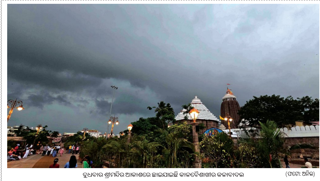
ରୁଧିରା ଶ୍ରୀମନ୍ଦିର ଆକାଶରେ ଛାଇଯାଇଛି କାଳବିଶାଖାର କଳାବାଦଳ