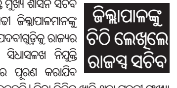
କିଲ୍ଲାପାଳଙ୍କୁ ଟିପ୍ପଣୀ ଦେଲେ ରାଜ୍ୟ ସଚିବ