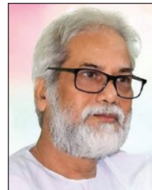
'ପାଦପୁରଣ' କବିତା ପୁସ୍ତକ ପାଇଁ ପୁରସ୍କାର