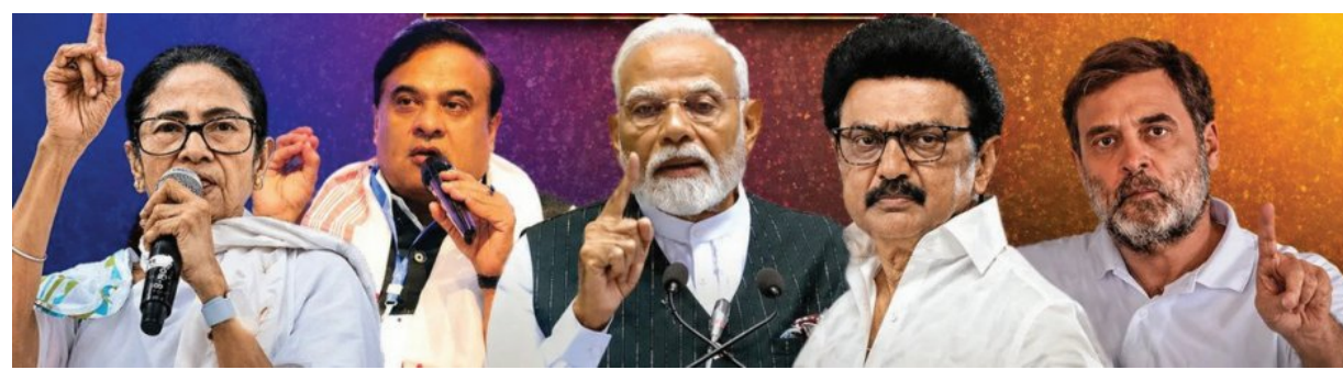
ଦର୍ଶାଯାଇଛି ଯେ ଡିଏମ୍‌ସି ୧୨୭ରୁ ୧୧୦ ଏବଂ ବିଜେପିକୁ ୧୪୬ରୁ ୧୨୭ ଆସନ ମିଳିପାରେ। ସେହିଭଳି ପି-ମାକ୍ ପକ୍ଷରୁ କୁହାଯାଇଛି ଯେ ବିଜେପିକୁ ୧୫୦ରୁ ୧୨୫ ଏବଂ ଡିଏମ୍‌ସିକୁ ୧୧୦ରୁ ୧୩୬ ଆସନ ମିଳିପାରେ। ଜନମତ ପୋଲିସ୍ ପକ୍ଷରୁ କୁହାଯାଇଛି ଯେ ଡିଏମ୍‌ସି ଏଥର ମଧ୍ୟ ବିପୁଲ ବିଜୟ ମିଳିବ। ଦକ୍ଷିଣ ୧୯୫ରୁ ୨୦୫ ପର୍ଯ୍ୟନ୍ତ ଆସନ ମିଳିବ ଏବଂ ବିଜେପି ୮୦ରୁ ୯୦ ଆସନ ମଧ୍ୟରେ ସୀମିତ ରହିବ। ଏହା ତୃତୀୟ ଚର୍ଚ୍ଚା ପୁସ୍ତା-୭

ଏକଜିଏସ୍‌ପୋଲିଟିଏ ଏଭଳି ସଙ୍କେତ ମିଳିଛି। ଅନ୍ୟସତ୍ତ୍ୱେ ଗାଁ ରାଜ୍ୟ ଓ କେନ୍ଦ୍ର ଶାସିତ ଅଞ୍ଚଳ ସଂପର୍କରେ ଏକଜିଏସ୍ ପୋଲିସ୍ ଟିଡିଏ ପ୍ରଦାନ କରିଥିବା ବେଳେ ପଶ୍ଚିମ ବଙ୍ଗ ନେଇ ହୁଇ ପ୍ରକାର ଚିତ୍ର ଆସୁଛି। ମମତାଙ୍କ ଟ୍ରମ୍ପଙ୍କୁ କଂଗ୍ରେସ (ଡିଏମ୍‌ସି) ବିଜୟ ହେବ ବୋଲି କିଛି ସଂସ୍ଥା କହୁଥିବା ବେଳେ ଆଉ କିଛି ସଂସ୍ଥା ବିଜେପି ସମ୍ପର୍କରେ ରିପୋର୍ଟ ଦେଇଛନ୍ତି। ପିପୁଲ୍ସ ପାର୍ଟିରୁ କରାଯାଇଥିବା ସର୍ବେକ୍ଷଣରେ ଦର୍ଶାଯାଇଛି ଯେ ରାଜ୍ୟରେ ୧୯୪୪ ଆସନ ମଧ୍ୟରୁ ଡିଏମ୍‌ସି ୧୨୭ରୁ ୧୮୬ ଆସନ ମିଳିବାକୁ ଥିବା ବେଳେ ବିଜେପିକୁ ୯୫ରୁ ୧୧୦ ମଧ୍ୟରେ ଆସନ ମିଳିପାରେ। ତେବେ ମାଟ୍ରିକ୍ ପକ୍ଷରୁ କରାଯାଇଥିବା ସର୍ବେକ୍ଷଣ