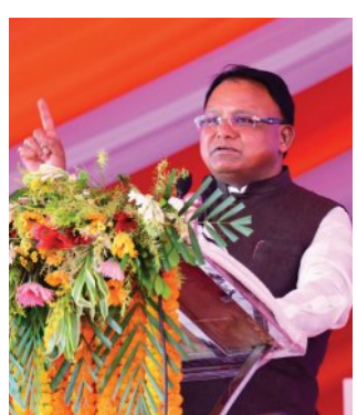
ଜିଲ୍ଲାର ବିଭିନ୍ନ ପ୍ରାନ୍ତରେ ପ୍ରାୟ ୭୦୫ କୋଟି ଟଙ୍କାର ୬୨ଟି ପ୍ରକଳ୍ପର ଭିଡିପ୍ରସ୍ତର ସ୍ଥାପନ କରାଯାଇଥିବା ବେଳେ, ପ୍ରାୟ ୨୫୧ କୋଟି ଟଙ୍କା ବ୍ୟୟରେ ପୁସ୍ତା-୭

ଭୁବନେଶ୍ୱର, ୨୯ ୪ (ସମିପ): ଅକେଳରେ ମୋଟ ୧୮୭ଟି ପ୍ରକଳ୍ପର କେନ୍ଦ୍ରରେ ଜିଲ୍ଲାର ସାମଗ୍ରିକ ବିକାଶ ଲୋକାର୍ପଣ, ଭିଡିପ୍ରସ୍ତର ସ୍ଥାପନ ସହ ଲକ୍ଷ୍ୟରେ ମୁଖ୍ୟମନ୍ତ୍ରୀମୋହନ ଚରଣମାଝୀ ନୂତନ ପ୍ରକଳ୍ପ ଘୋଷଣା କରିଛନ୍ତି। ରୂପବାର କେନ୍ଦ୍ରରେ ଖାଲି ଲିଭାବାସୀଙ୍କୁ ସ୍ମାର୍ଟ ପବ୍ଲିକ ଗ୍ରାନ୍ଦିପୋର୍ଟ ୭୦୫ କୋଟିର ୬୨ଟି ପ୍ରକଳ୍ପର ଭିଡିପ୍ରସ୍ତର ସ୍ଥାପନ ୨୫୧ କୋଟି ବ୍ୟୟରେ ନିର୍ମିତ ୨୪୮ଟି ପ୍ରକଳ୍ପର ଲୋକାର୍ପଣ ୧୦୧ଟି ନୂତନ ପ୍ରକଳ୍ପ ପାଇଁ ୩୨୫ କୋଟିର ପ୍ୟାକେଜ ଘୋଷଣା ୨୫୮ଟି ଇ-ସ୍ୱ ସେବାର ଶୁଭାରମ୍ଭ: ମାତ୍ର ୫ ଟଙ୍କାରେ ସ୍ମାର୍ଟ ବସ୍ ଯାତ୍ରା