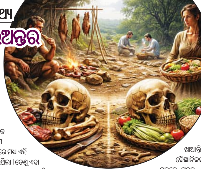
ଖାଆନ୍ତି। ବୈଜ୍ଞାନିକଙ୍କ ମତରେ, ଘରର ପୁରୁଷମାନଙ୍କୁ ସୁସ୍ଥ ଖାଦ୍ୟ ଯୋଗାଇଦେବା ପରମ୍ପରା ବାସ୍ତବରେ ୧୦ ହଜାର ବର୍ଷ ପୂର୍ବରୁ ସାମାଜିକ କାର୍ଯ୍ୟକ୍ରମର ଏକ ଅଂଶ। ସେତେବେଳେ ଖାଦ୍ୟଯୋଗ ପାର୍ଥକ୍ୟ ମହିଳାଙ୍କ ସ୍ୱାସ୍ଥ୍ୟ ଏବଂ ଜୀବନକୁ ପ୍ରଭାବିତ କରିଥାଇପାରେ। କାରଣ ପ୍ରୋଟିନ୍ ଅଭାବକୁ ପ୍ରାଚୀନକାଳରେ ମହିଳାମାନେ ପୁରୁଷମାନଙ୍କ ତୁଳନାରେ ଅଧିକ ଶାରୀରିକ ଆବଶ୍ୟକତା ଥିଲା। ଏହି ଦିବସ ପାଳନ ଆଜିକାଲି ସ୍ୱଚ୍ଛତା ବ୍ୟବହାର କରିଛନ୍ତି। ଏହି ଦିବସରେ ଜଣେ ବ୍ୟକ୍ତି ତାର ଜୀବନକାଳରେ କ’ଣ ଖାଉଥିଲା ତାହା ଜଣା ପଡ଼ିଯାଏ।