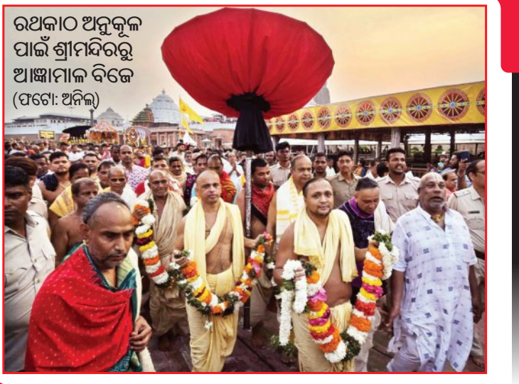
ରଥକାଠ ଅନୁକୂଳ ପାଇଁ ଶ୍ରୀମଦିରରୁ ଆଜ୍ଞାମାଳ ବିଜେ