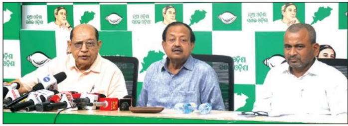
୧୨ ରାଜ୍ୟ ଓ କେନ୍ଦ୍ରଶାସିତ ଅଞ୍ଚଳରୁ ୫ କୋଟିରୁ ଊର୍ଦ୍ଧ୍ୱ ବାଦ୍

ଭୋଟରଙ୍କୁ ବାଦ୍ ଦିଆଯିବା ସନ୍ଦେହଜନକ। ଓଡ଼ିଶାରେ ଏହାକୁ ନେଇ ବିଜେଡିର ସମ୍ପର୍କିତ ଲୋକେ ସନ୍ଦେହ ପ୍ରକାଶ କରିଛନ୍ତି।