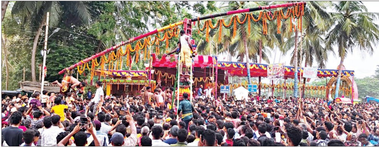
ସାକ୍ଷୀଗୋପାଳ, ୧୪୪୪ (ସମ୍ବିଧ)

ପୁରୀ ଜିଲ୍ଲା ସାକ୍ଷୀଗୋପାଳ ନିକଟବର୍ତ୍ତୀ ଭାମପୁର ଓ ଦାସବିଦ୍ୟାଧରପୁର ଗ୍ରାମରେ ପ୍ରସିଦ୍ଧ ଖାଇପୋଡ଼ା ଯାତ୍ରା ମଙ୍ଗଳବାର ପଣା ଫାକ୍ତାନ୍ତରେ ଅନୁଷ୍ଠିତ ହୋଇଯାଇଛି। ମାନସିକ ପୂରଣ ପାଇଁ ଜଣେ ଜଣେ ପାରୁଆ ଥରୁ ୧୦ ଲକ୍ଷ