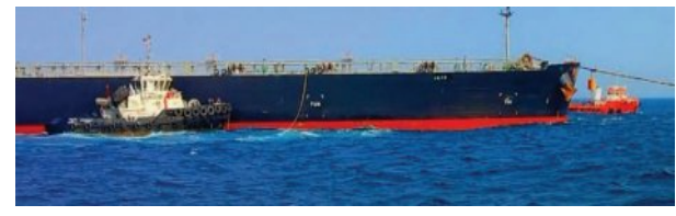
ପାରାଦୀପ ବନ୍ଦରରେ ଲାଗିଥିବା ତୈଳ ଜାହାଜ ।

ପାରାଦୀପ, ୧୩୪ (ସମ୍ବିଧା): ଯୁଦ୍ଧ ସମୟରେ ଆମେରିକାର ଅସ୍ତ୍ରାୟା କଟକଣା ଛାଡ଼ି ପରେ ଦୀର୍ଘ ସାତ ବର୍ଷ ପରେ ଭାରତୀୟ ବନ୍ଦରରେ ପହଞ୍ଚିଛି ଦୁଇଟି ଇରାନୀ ତୈଳ ଟ୍ୟାଙ୍କର ଜାହାଜ ଟେଲିସିଟି ଓ ଜୟା ମିଲିଥିବା ତଥ୍ୟ ଅନୁଯାୟୀ, ଜାହାଜ ଜୟ ଭରାନରୁ ତୈଳ ବୋହେଇ କରି ପାରାଦୀପ ବନ୍ଦରରେ ଲାଗିବା ପରେ ଆଉ ଏକ ତୈଳ ଟ୍ୟାଙ୍କର ଜାହାଜ ଗୁଜରାଟର ଶିକ୍ୱା ବନ୍ଦରରେ ଲାଗିଥିବା ସୂଚନା ମିଳିଛି । ଗତ ମାସରେ ଆମେରିକା ଦ୍ୱାରା କଟକଣା ଛାଡ଼ି ଘୋଷଣା ପରେ ପ୍ରାୟ ସାତବର୍ଷ ବ୍ୟବଧାନରେ ଭାରତୀୟ ବନ୍ଦରରେ ପହଞ୍ଚିଛି ଇରାନୀ ତୈଳ ଟ୍ୟାଙ୍କର ବିଶିଷ୍ଟ କାରଗୋ ଜାହାଜ । ବିଶ୍ୱ ବଜାରରେ ତୈଳ ସଙ୍କଟକୁ ଦୂର କରିବା ସହ ତୈଳ ମୂଲ୍ୟକୁ ନିୟନ୍ତ୍ରଣରେ ରଖିବା ପାଇଁ ଯୁଦ୍ଧ କଟକଣାରେ ଏକ ମାସର ଛାଡ଼ି ଯୋଗୁ ପୂର୍ବରୁ ସାମୁଦ୍ରିକ ଜଳପଥରେ ରହିଥିବା ଇରାନୀ ତୈଳ ଜାହାଜଗୁଡ଼ିକୁ ବିକ୍ରୟ କରିବାକୁ ଅନୁମତି ପ୍ରଦାନ କରାଯାଇଥିଲା । ସଂସ୍ଥାପକରେ ଶାନ୍ତି ଆଲୋଚନା ବିଫଳ ହେବା ପରେ, ବର୍ତ୍ତମାନ ଆମେରିକା ତୈଳ ରଞ୍ଜନାରେ ତେହେରାନର ରାଜସ୍ୱକୁ ସୀମିତ କରିବା ପାଇଁ ଇରାନୀ ବନ୍ଦରଗୁଡ଼ିକୁ ଅବରୋଧ ଘୋଷଣା କରିଛି । ଆମେରିକା କଟକଣା ଛାଡ଼ି