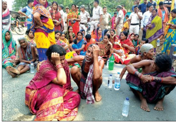
ପାଟଣା ଗ୍ରାମବାସୀ ଓ ଆଖପାଖ ଗ୍ରାମର ବହୁ ଜନସାଧାରଣ ସାତପାଟଣା ଦେଇ ଯାଇଥିବା ପୁରୁଣା କଟକ-ସମ୍ବଲପୁର ରାସ୍ତା ଅବରୋଧ କରିଥିଲେ ।

ହିନ୍ଦୋଳ, ୧୩୪ (ସମ୍ବିଧା): ହିନ୍ଦୋଳ ଉପଖଣ୍ଡ ବାଲିନି ଆନା ଅନ୍ତର୍ଗତ ପାଟଣା ଗ୍ରାମରେ ରବିବାର ସନ୍ଧ୍ୟାରେ ବିଦ୍ୟୁତ୍ ଆଘାତରେ ୩ ଦଣ୍ଡୁଆଙ୍କ ମୃତ୍ୟୁ ହୋଇଥିବା ବେଳେ ଦୁଇଜଣ ଗୁରୁତର ହୋଇଥିଲେ । ମୃତାହତକ ପରିବାରକୁ କ୍ଷତିପୂରଣ ଦାବିରେ ଯୋଗଦାନ ସକାଳ ୮ଟାରେ ପାଟଣା ଗ୍ରାମବାସୀ ଓ ଆଖପାଖ ଗ୍ରାମର ବହୁ ଜନସାଧାରଣ ସାତପାଟଣା ଦେଇ ଯାଇଥିବା ପୁରୁଣା କଟକ-ସମ୍ବଲପୁର ରାସ୍ତା ଅବରୋଧ କରିଥିଲେ । ପାଟଣାରେ ଦୀର୍ଘ ୬ ଘଣ୍ଟା ପର୍ଯ୍ୟନ୍ତ ଏହି ରାସ୍ତାରେ ଯାତାୟତ ଠିକ୍ ହୋଇଯାଇଥିଲା । ପ୍ରଶାସନ ପକ୍ଷରୁ ପ୍ରତିଶ୍ରୁତି ମିଳିବା ପରେ ଲୋକେ ଆୟୋଜନରୁ ଠିକ୍ ହେଲେ । ସୂଚନାମୁତାୟୀ, ରବିବାର ସନ୍ଧ୍ୟାରେ ଦଣ୍ଡୁଆତ ପୂର୍ବରୁ କିଛି ମାନସିକଧାରା ଟେଣ୍ଡ ଭିତ୍ତୁଥିବା ସମୟରେ ୧୧ଟାରେ ବିଦ୍ୟୁତ୍ ତାର ସଂସ୍ପର୍ଶରେ ୫ ଜଣ ଗୁରୁତର ହୋଇଥିଲେ । ସମସ୍ତଙ୍କୁ ପ୍ରଥମେ ଅନୁରୋଧ ଡାକ୍ତରଖାନା ନିଆଯାଇଥିଲା । ସେଠାରେ ପାଟଣା