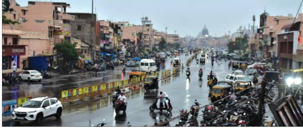
ପୁରୀ, ୫/୪ (ସମ୍ବାଦ)

ପୁରୀରେ କାଳବୈଶାଖୀ ପ୍ରଭାବରେ ହାଲୁକା ପବନ ଓ ବର୍ଷା ହୋଇଛି। ବିଜୁଳି ଓ ଘଡ଼ଘଡ଼ି ବି ମାରିଥିଲା। ଫଳରେ ଗ୍ରାହ୍ୟ ତାତିରୁ ସାମୟିକ ଭାବେ ମିଳିଛି ଆଶ୍ୱସ୍ତି। ରବିବାର ସବୁକିଛି ସ୍ୱାଭାବିକ ଥିଲା। କିନ୍ତୁ ଖରା ଯୋଗୁଁ ତାତିରେ ଅସ୍ୱଚ୍ଛବ୍ୟ ହେଉଥିଲେ ପୁରୀବାସୀ, ଭକ୍ତ ଓ ଯତ୍ନୀକ। ଅପରାହ୍ଣ