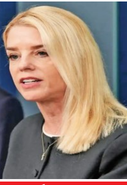
ଆର୍ଟି ଡେନେରାଲ ବି ବହିଷ୍କୃତ

ଓଫିସ୍‌ନ, ୩୩୪(ଏକେନ୍ଦ୍ର): ଇରାନ ସୂକ୍ଷ୍ମରେ ବିଫଳତା ପରେ ଆମେରିକାର ରାଷ୍ଟ୍ରପତି ଡୋନାଲ୍ଡ ଟ୍ରମ୍ପ ତାଙ୍କର ସବୁ ରାଗ ସେନା ମୁଖ୍ୟଙ୍କ ଉପରେ ସୁସ୍ଥକରିଛନ୍ତି। ବିଫଳତା ପାଇଁ ପରୋକ୍ଷରେ ତାଙ୍କୁ ଦାୟୀ କରି ସେନା ମୁଖ୍ୟ ପଦରୁ ରେଣ୍ଡି ଜର୍ଜଙ୍କୁ ହଟାଇ ଦେଇଛନ୍ତି। ଏହାସହିତ ଏପ୍ରିଲ ପାଇଁ ଆର୍ଟି ଡେନେରାଲଙ୍କୁ ମଧ୍ୟ ବହିଷ୍କାର କରିଛନ୍ତି। ମାତ୍ର ୨୪ ଘଣ୍ଟା ମଧ୍ୟରେ ସେନା ମୁଖ୍ୟ ଏବଂ ଆର୍ଟି ଡେନେରାଲଙ୍କୁ ପଦରୁ ହଟାଇଛନ୍ତି। ଇରାନ ସହ ଚାଲିଥିବା ସୂକ୍ଷ୍ମ ମଧ୍ୟରେ ଟ୍ରମ୍ପ ଆମେରିକା ସେନା ମୁଖ୍ୟ ଡେନେରାଲ ରେଣ୍ଡି ଜର୍ଜଙ୍କୁ ତୁରନ୍ତ ଅବସର ନେବାକୁ କୁହାଯାଇଛି। ଜର୍ଜଙ୍କ କାର୍ଯ୍ୟକାଳ ୨୦୨୬ରେ ଶେଷ ହେବାର ଥିଲା। କିନ୍ତୁ ଟ୍ରମ୍ପ ସରକାର ନିଜର ବିଶ୍ୱସ୍ତ ଲୋକଙ୍କୁ ସେନାର ଶୀର୍ଷ ପଦରେ ରଖିବାକୁ ଚାହୁଁଛନ୍ତି। ସେହିପରି ଦେଶର ଆର୍ଟି ଡେନେରାଲ ଫୋର୍ସ୍ ବଣ୍ଡିଙ୍କୁ ମଧ୍ୟ ବହିଷ୍କାର କରାଯାଇଛି। କୁହାଯାଉଛି ଯେ, ବଣ୍ଡି ଏପ୍ରିଲ ପାଇଁ ମାମଲାକୁ ଠିକ୍ ଭାବେ ପରିଚାଳନା କରିପାରି ନଥିଲେ। ଲୋକଙ୍କ ଆଶା ଥିଲା ଯେ ଏହି ପାଇଲୁକୁ କିଛି ବଡ଼ ରହସ୍ୟ ଖୋଲିବ, କିନ୍ତୁ ବଣ୍ଡିଙ୍କ ଦ୍ୱାରା ଜାରି ତଥ୍ୟରେ କିଛି ନୂଆ ନଥିଲା, ଯାହାକୁ ସରକାରଙ୍କୁ ଅହୁଆରେ ପଚାରିଥିଲା। ଏବେ କଥା ଉପରେ କିଛି ନିଶ୍ଚିତ ନିଆଯାଇଛି। ରିପୋର୍ଟ ଅନୁଯାୟୀ ରାଷ୍ଟ୍ରପତି ଟ୍ରମ୍ପ ଏବଂ ସୂକ୍ଷ୍ମ ସଚିବ ପିଟ୍ ହେଗସେଥ ସେନାକୁ ନିଜର ନୂତନ