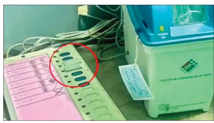
ଇଲିଏମ୍‌ର ବିଜେପି ବଟନରେ ସେଲେ ଟେପ୍