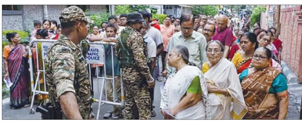
ରୁଥିରେ କଡ଼ା ସୁରକ୍ଷା ବଳୟରେ ଭୋଟ ଦେବାକୁ ଅପେକ୍ଷାରତ ମତଦାତା

ଅସ୍ତ୍ରଶସ୍ତ୍ର ବଜାଉଛି, ତେଣୁ ଅନ୍ୟ ଶିକ୍ଷା ଦେବାର ଅଧିକାର ତା'ର ନାହିଁ । ପରମାଣୁ ଅପ୍ରସାର ସଚି ୧୯୭୦ ମସିହାରୁ ଲାଗୁ ହୋଇଥିଲା । ଏହା ବିଶ୍ୱରେ ପରମାଣୁ ଅସ୍ତ୍ରର ପ୍ରସାରକୁ ରୋକିବା ପାଇଁ ସବୁଠାରୁ ଗୁରୁତ୍ୱପୂର୍ଣ୍ଣ ବ୍ୟବସ୍ଥା । ଏହି ସଚିର ମୁଖ୍ୟ ସର୍ତ୍ତ ହେଉଛି- ଯେଉଁ ଦେଶମାନଙ୍କ ପାଖରେ ପରମାଣୁ ଅସ୍ତ୍ର ନାହିଁ, ସେମାନେ ଏହା ତିଆରି କରିବେ ନାହିଁ । ଯେଉଁମାନଙ୍କ ପାଖରେ ଅଛି, ସେମାନେ ଧାରଣାରେ ଏହାକୁ ଶେଷ କରିବେ । ଏହା ବଦଳରେ ସମସ୍ତ ଦେଶକୁ ଶାନ୍ତିପୂର୍ଣ୍ଣ କାର୍ଯ୍ୟ ପାଇଁ ପରମାଣୁ ପ୍ରଯୁକ୍ତି ବ୍ୟବହାର କରିବାର ଅଧିକାର ମିଳିବ । ବର୍ତ୍ତମାନ କାଟିଫର ୧୯୫୮ ଦେଶ ମଧ୍ୟରୁ ୧୯୯୧ ହିଁ ଏହି ସଚିର ଅଂଶବିଶେଷ । ଭାରତ, ପାକିସ୍ତାନ, ଇନ୍ଦୋନେସିଆ ଏବଂ ଦକ୍ଷିଣ ସୁଦାନ ଏଥିରେ ସାମିଲ ନାହାନ୍ତି ।