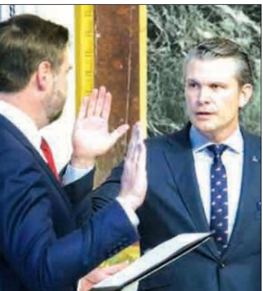
ସାମାଜିକ ସଂଘର୍ଷ ଯେଉଁ ଅତିରକ୍ଷିତ ଚିତ୍ର ଉପସ୍ଥାପନ କରାଯାଇଛି, ତାହା ପ୍ରକୃତରେ ସତ କି ନୁହେଁ ଏବଂ ଆମେରିକାର ମିଆଇଲ୍ ଉତ୍ପାଦନ କରିପାରୁଥିବା କଥାକୁ