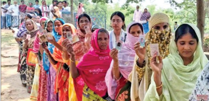
ଭାରତର ନିର୍ବାଚନ କମିସନ ସେମାନଙ୍କୁ ଅଭିନନ୍ଦନ ଜଣାଇଛନ୍ତି । ସୂଚନାଯୋଗ୍ୟ ଯେ ଗତ ୨୦୨୧ ବିଧାନସଭା ନିର୍ବାଚନରେ ପଶ୍ଚିମବଙ୍ଗରେ ସର୍ବାଧିକ ୮୨.୩୦ ପ୍ରତିଶତ ମତଦାନ ହୋଇଥିଲା । କୋଭିଡ଼ ଜଟିଳ ମଧ୍ୟରେ ହୋଇଥିବା ଏହି ନିର୍ବାଚନରେ ମମତା ବାନାର୍ଜୀଙ୍କ ତୃଣମୂଳ କଂଗ୍ରେସ କ୍ରମାଗତ ତୃତୀୟ

କୋଲକାତା/ଚେନ୍ନାଇ, ୨୩।୪ (ଏକ୍ସପ୍ରେସ୍): ପ୍ରବଳ ଉତ୍ସାହ ଓ ଉତ୍ତେଜନା ମଧ୍ୟରେ ଆଜି ପଶ୍ଚିମବଙ୍ଗ ବିଧାନସଭା ପାଇଁ ପ୍ରଥମ ପର୍ଯ୍ୟାୟ ଭୋଟ ଗ୍ରହଣ ଶେଷ ହୋଇଥିବା ବେଳେ ତାମିଲନାଡୁର ସମସ୍ତ ୨୩୪ଟି ନିର୍ବାଚନମଣ୍ଡଳରେ ମତଦାନ ହୋଇଛି । ଉଭୟ ରାଜ୍ୟରେ ରେକର୍ଡ ମତଦାନ ହୋଇଛି । ପଶ୍ଚିମବଙ୍ଗରେ ୯୧.୫୮ ପ୍ରତିଶତ ମତଦାନ ହୋଇଥିବା ବେଳେ ତାମିଲନାଡୁରେ ୮୪.୨୯ ପ୍ରତିଶତ ମତଦାନ ହୋଇଛି । ସ୍ୱାଧୀନ ଭାବେ ଭୋଟ ଦେବାରେ ଏହି ଦୁଇ ରାଜ୍ୟରେ ଏମିତି ରେକର୍ଡ ମତଦାନ କେ ୧୧ ବେ ହୋଇନଥିଲା । ଗୁଜୁ ରାଜ୍ୟରେ ମତଦାନ ସେମାନଙ୍କର ଗଣତାନ୍ତ୍ରିକ ଅଧିକାର ସାବ୍ୟସ୍ତ କରିବାରେ ଭବିଷ୍ୟତ ସୃଷ୍ଟି କରିଛନ୍ତି । ଏଥିପାଇଁ