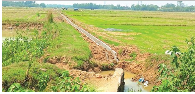
ହାଟଡ଼ିହା, ୨୩୫୪ (ସମ୍ବିଧ):

ରାଷ୍ଟ୍ରୀୟ ସ୍ୱାସ୍ଥ୍ୟ ଗୁରୁତ୍ୱ ଦେଇ ସରକାର ବିଭିନ୍ନ ଯୋଜନା ବାବଦରେ କୋଟି ଟଙ୍କା ବ୍ୟୟବହାବ କରୁଛନ୍ତି। ମାତ୍ର ଏଥିପାଇଁ ରହିଥିବା ସିଏଡ଼ିଡ଼ିଏମ୍ (କମାଣ୍ଡ ଏରିଆ ଡେଭେଲପମେଣ୍ଟ ଓ ଓପେନ ମ୍ୟାନେଜମେଣ୍ଟ) ଯୋଜନା ଏବେ ବାଟବନ୍ଦୀ ହୋଇଛି। ଏହି ଯୋଜନାରେ ପାଣିପଞ୍ଚାୟତଗୁଡ଼ିକ ଦ୍ୱାରା ପାଣି ଯୋଗାଣ ନିମନ୍ତେ କାଡ଼ା ନାଳ ନିର୍ମାଣ କାର୍ଯ୍ୟ ହେଉଛି। କିନ୍ତୁ ପ୍ରକଳ୍ପ ଅନୁମୋଦନ ଏବଂ ବ୍ୟୟବହାବ ନେଇ ଏଗ୍ରିମେଣ୍ଟ ହେବା ପୂର୍ବରୁ ବିନା ନାମପତ୍ରକରେ ନିର୍ମାଣ କାର୍ଯ୍ୟ ହେଉଥିବା ନେଇ ଲୋକପ୍ରତିନିଧିମାନେ ଅଭିଯୋଗ ଆଣିଛନ୍ତି। ଅଭିଯୋଗକୁ ଭିତ୍ତିକରି ସିଏଡ଼ି