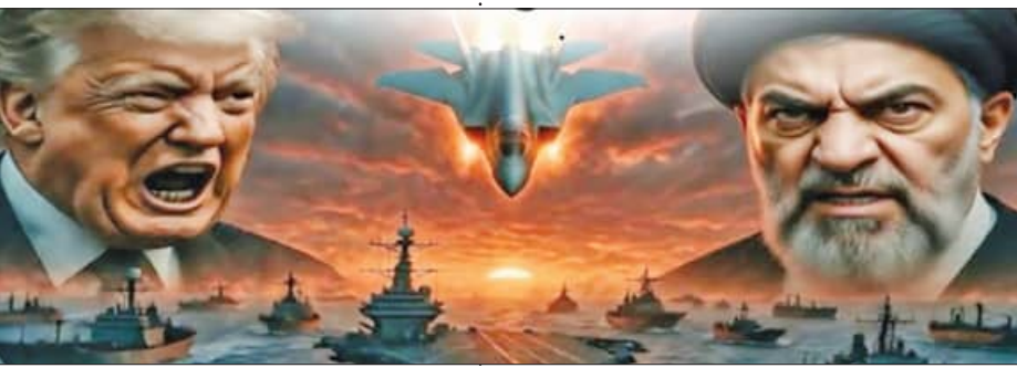
ଉପରୁ ଦୂରଦର୍ଶନ କରିବାକୁ ଚାହୁଁଛନ୍ତି। ଯଦି ଇରାନର ଟେକି କୁଅଷ୍ଟିକୁ ସବୁଦିନ ପାଇଁ ନଷ୍ଟ ହୋଇଯାଏ, ତେବେ ଇରାନର ଅର୍ଥନୀତି ସମ୍ପୂର୍ଣ୍ଣ ରୂପେ ଲୁହୁଡ଼ି ପଡ଼ିବ। ଏହି ରଣନୀତି ଇରାନକୁ ଆମେରିକାର ସହିତ ମାନବିକ ବାଧ୍ୟ କରିବ ବୋଲି ହୁଲ୍‌ଜ୍ ହାତସ୍ୱ ଆଶା ରଖିଛି।

ୱାସିଂଟନ/ଡେହ୍ରୋରା, ୨୨୧୪(ଏକେନ୍ଦ୍ରି): ଦଶନ୍ଧି ଦଶନ୍ଧି ଧରି ଆମେରିକା ଏବଂ ଇସ୍ରାଏଲ୍, ଇରାନର ପରମାଣୁ କାର୍ଯ୍ୟକ୍ରମକୁ ରୋକିବା ପାଇଁ ରଣନୀତି ପ୍ରସ୍ତୁତ କରିଆସୁଛନ୍ତି। ମାତ୍ର ବର୍ତ୍ତମାନର ମୁଖ୍ୟ ଛିଡ଼ି ଏହା ପ୍ରମାଣ କରିଛି ଯେ ଇରାନ ପାଖରେ ପରମାଣୁ ବୋମା ଅପେକ୍ଷା ଅଧିକ ଶକ୍ତିଶାଳୀ ଏକ ଅସ୍ତ୍ର ରହିଛି, ତାହା ହେଉଛି ହର୍ମୁଜ ପ୍ରଣାଳୀ। ବିଶେଷତାମାନେ ଏହାକୁ ଇରାନର ପରମାଣୁ ଅସ୍ତ୍ର ପଲରେ ପାଣି ପରିସ୍ରାବର ଭୟ ଥାଏ, ଯାହାପଛରେ ଭବିଷ୍ୟତରେ ଏହାକୁ ପୁଣି ଥରେ କାର୍ଯ୍ୟକ୍ଷମ କରିବା ଅତ୍ୟନ୍ତ କଷ୍ଟକର ହେବ। ଆମେରିକାର ଟ୍ରେଜରୀ ସଚିବ ସ୍କଟ୍ ବେଭେଣ୍ଟଙ୍କ ସୂଚନା ଅନୁଯାୟୀ, ଇରାନ ଦୈନିକ ପ୍ରାୟ ୩ ଲକ୍ଷ ବ୍ୟାରେଲ ଟେକି ଉତ୍ପାଦନ କ୍ଷମତା ହରାଇବ। ଏହାଦ୍ୱାରା ଇରାନ ବାର୍ଷିକ ପ୍ରାୟ ୯ ଲକ୍ଷ ବିଲିୟନ ଡଲାର (୨୫, ୦୦୦ କୋଟିରୁ ୧୨୫ ଲକ୍ଷ କୋଟି ଟଙ୍କା) ର ରାଜସ୍ୱ ହରାଇବ। ବୋମା ପକାଇ ଇରାନକୁ ଦମନ କରିବା ଅପେକ୍ଷା ଟ୍ରମ୍ପ ଏବେ ଇରାନକୁ