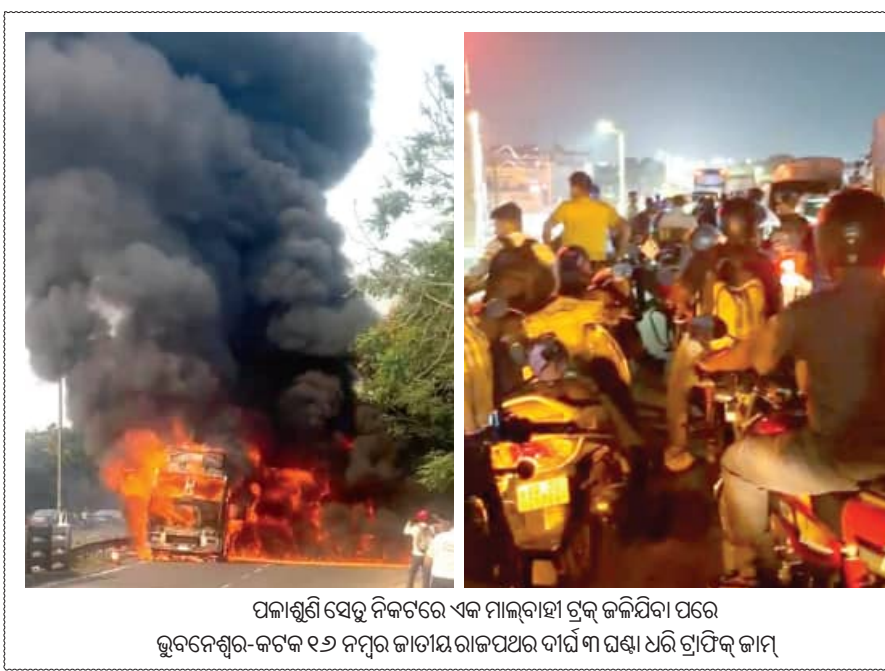
ପକାଣ୍ଡି ସେତୁ ନିକଟରେ ଏକ ମାଲକିଆ ଟ୍ରକ୍ ଜଳିଯିବା ପରେ ଭୁବନେଶ୍ୱର-କଟକ ୧୬ ନମ୍ବର ଜାତୀୟ ରାଜପଥର ଦୀର୍ଘ ଯାତ୍ରା ଧରି ଗ୍ରାମିକ ଜାମ୍