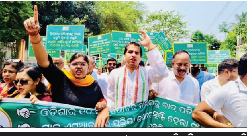
ଏସଆଇଆର ମାଧ୍ୟମରେ ଯୋଗ୍ୟ ଭୋଟରମାନଙ୍କୁ ବାଦ୍ ଦିଆଯିବାର ଆଶଙ୍କା ସୃଷ୍ଟି ଏବଂ ସ୍ୱଳ୍ପ ଓ ନିର୍ଭୁଲ ଯାଞ୍ଚ କରି ବାଦ୍ ପଡ଼ିଥିବା ଭୋଟରଙ୍କୁ ପୁଣି ତାଲିକାରୁକୁ କରାଯାଉ

ପ୍ରତିନିଧି ମଣ୍ଡଳୀର ଅଭିଯୋଗର ଦାବି ଅନୁଯାୟୀ କୌଣସି ଭୋଟରଙ୍କୁ ବାଦ୍ ଦେବା ପୂର୍ବରୁ ରୂପ ଲେଖା ଅଧିକାରୀଙ୍କ ଦ୍ୱାରା ଶୁଣାବୁଝିବାକୁ ନିର୍ଦ୍ଦିଷ୍ଟ କରାଯାଇ ନାହିଁ । ସମ୍ପୂର୍ଣ୍ଣ ପାରଦର୍ଶିତା ପାଇଁ ନିର୍ବାଚନମଣ୍ଡଳୀ ଭିତ୍ତିକ ତଥ୍ୟ ପ୍ରକାଶ,