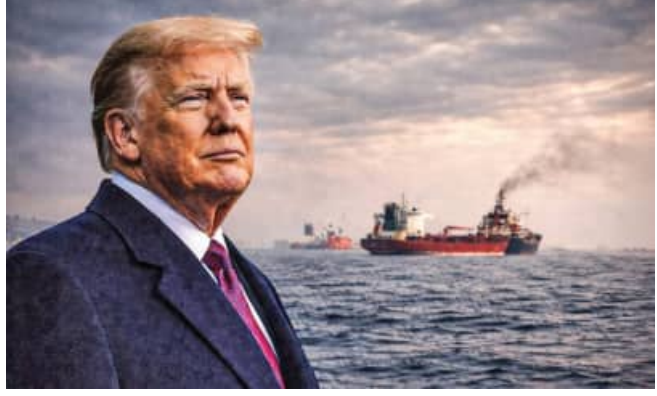
ଆମେରିକା ସେନାର ହର୍ମୁଜ ଅବରୋଧ ଜାରି ତିନି ଜାହାଜ ଉପରେ ଗୁଳିମାଡ଼ କରୁଛି ଭରାନ

■ ଖାସିନେ/ଇସଲାମାବାଦ, ୨୨।୪ (ଏକେନି): ଭରାନ ଓ ଆମେରିକା ମଧ୍ୟରେ ୧୫ ଦିନିଆ ଯୁଦ୍ଧ ବିରତି ଆଜି ଶେଷ ହୋଇଥିବା ବେଳେ ଏହାର ଅବଧିକୁ ଅନିର୍ଦ୍ଧିତ କାଳ ପାଇଁ ବୃଦ୍ଧି କରିବାକୁ ଘୋଷଣା କରିଛନ୍ତି ଆମେରିକାର ରାଷ୍ଟ୍ରପତି ଡୋନାଲ୍ଡ ଟ୍ରମ୍ପ। ଶାନ୍ତି ଆଲୋଚନା ପ୍ରକଳ୍ପ ନହେବା ପର୍ଯ୍ୟନ୍ତ ଯୁଦ୍ଧବିରତି ଜାରି ରହିବ। ଏହି ସମୟରେ ଦୁଇ ଦେଶ ମଧ୍ୟରେ ସାମରିକ ସଂଘର୍ଷ ହେବ ନାହିଁ, ତେବେ ହର୍ମୁଜରେ ଆମେରିକାର ନୌସେନା ଅବରୋଧ ଜାରି ରହିବ। ଆମେରିକାର ଏଭଳି ଆଭିମୁଖ୍ୟକୁ ନେଇ ଭରାନ ଭୀଷଣ ପ୍ରତିକ୍ରିୟା ପ୍ରକାଶ କରିବା ସହିତ ହର୍ମୁଜରେ କେତେକ ଜାହାଜ ଉପରେ ଗୁଳିମାଡ଼