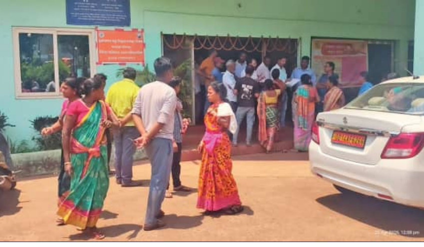
ଅନ୍ୟ ଏକ ସୁରକ୍ଷିତ ଜାଗାକୁ ସ୍ଥାନାନ୍ତର କରାଯାଇଥିବା ସମୟରେ ଦୋକାନୀଙ୍କୁ ଠେଲୀପେଲୀ କରିବାକୁ ବାଧ୍ୟ କରାଯାଇଥିଲା । କିନ୍ତୁ କିଛି ଅନାମିତା ବେପାରୀ ବାରମ୍ବାର ରାଷ୍ଟ୍ରାକଡ଼ରେ ଦୋକାନୀଙ୍କୁ ଠେଲୀପେଲୀ କରିବାକୁ ଗତ ୨୯ ତାରିଖ ପତ୍ର ସଂଖ୍ୟା-୧୫୯-୫ ମାଧ୍ୟମରେ

କେନ୍ଦୁଝର ଜିଲ୍ଲା ଯୋଡ଼ା ପୌରପାଳିକା ଅନ୍ତର୍ଗତ ବସଷାଣ୍ଡ ନିକଟରେ ଥିବା ପୁଲିଓଡର ରାଷ୍ଟ୍ରାକଡ଼ରେ ବିପଦଜନକ ଆବସ୍ଥାରେ ବସୁଥିବା ଉଠା ଦୋକାନୀଙ୍କୁ ପୌରପାଳିକା ତରଫରୁ ସ୍ଥାନାନ୍ତର କଲା ବେଳେ ଉତ୍ତେଜନାପୂର୍ଣ୍ଣ ପରିସ୍ଥିତି ସୃଷ୍ଟି ହୋଇଛି । ଏଥିରେ କିଛି କର୍ମଚାରୀଙ୍କୁ ଠେଲୀପେଲୀ ସହ ବୁଦ୍ଧିବନ୍ଧୁତାରେ କରୁଥିବା ନେଇ ପୌରପାଳିକା ପକ୍ଷରୁ ଆନାରେ ଲିଖିତ ଅଭିଯୋଗ ହୋଇଛି । ଅଭିଯୋଗ ମୁତାବକ, କିଛି ନାଏବହେବ ଉଠା ଦୋକାନୀମାନେ ପୁଲିଓଡରର ସର୍ବିସ ରୋଡ଼ ଉପରେ ଅସୁରକ୍ଷିତ ଅବସ୍ଥାରେ ଦୋକାନ ବଜାର ବସାଇଥିଲେ । ଯାହାଫଳରେ ଅନେକ ସମୟରେ ଗ୍ରାହକ ସମସ୍ୟା ଉତ୍ପନ୍ନ ହୁଏ । ସହ ବୁଦ୍ଧିବନ୍ଧୁତା କାରଣ ପାଲଟିଥିଲା । ଏନେଇ ପୂର୍ବରୁ ବିଭିନ୍ନ ଗଣମାଧ୍ୟମରେ ଖବର ମଧ୍ୟ ପ୍ରକାଶ ପାଇଥିଲା । ତେବେ ଲୋକଙ୍କ ସୁରକ୍ଷା ଏବଂ ଗ୍ରାହକ ସମସ୍ୟାକୁ ଦୃଷ୍ଟିରେ ରଖି ଯୋଡ଼ା ପୌରପାଳିକା ତରଫରୁ