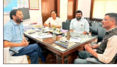
ଆବଶ୍ୟକୀୟ ପଦକ୍ଷେପ ପାଇଁ ଜିଲ୍ଲାପାଳଙ୍କୁ ନିର୍ଦ୍ଦେଶ ଗଣନାକାରୀଙ୍କ ସୁରକ୍ଷା ପାଇଁ ପୁଲିସ୍ ପ୍ରଶ୍ନାବନକୁ ଦାୟିତ୍ୱ ବିଭିନ୍ନ ଅଘଟଣ ପରେ ଶ୍ରେଣି ସମାକ୍ଷା କଲେ ରାଜ୍ୟ ମନ୍ତ୍ରୀ