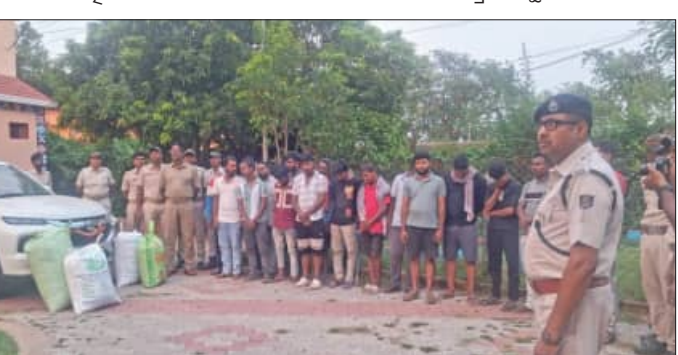
ଗୋଟିଏ ବୁକା ଗାଡ଼ିରେ ଗଞ୍ଜେଇ ନେଇ ଯାଇଥିବା ସୁତରା ପାଇଁ ଘଷିପୁରା ପୁଲିଓ ଟିମ୍ ବିଭିନ୍ନ ସ୍ଥାନରେ ଖାନପଲାଇ

କରିଥିଲେ । ଗୋଟିଏ ବୁକା ଗାଡ଼ିରୁ ୬୯ କେଜି ୪୫୦ ଗ୍ରାମ ଗଞ୍ଜେଇ ଜବତ ହେବା ସହ ୬୪୦୦ ଟଙ୍କା ମଧ୍ୟ ଜବତ କରାଯାଇଥିଲା । କୋଡ଼େଇ ଥାନା ଅନ୍ଧାରି ନିକଟରେ ଚଢ଼ଢ଼ କରି ଗାଡ଼ି ଶହ ଗଞ୍ଜେଇ ଜବତ କରାଯାଇଛି । ସୁତରା ଅନୁସାରେ ଆନନ୍ଦପୁର ଅଞ୍ଚଳରେ ତୋରା ଗଞ୍ଜେଇ ଓ ବ୍ରାଉନସୁଗରର କାରବାର