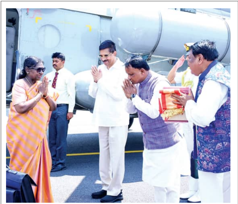
ଦିନିକିଆ ଓଡ଼ିଶା ଗସ୍ତରେ ଆସିଥିବା ରାଷ୍ଟ୍ରପତି ଚୌପଦୀ ମୁର୍ମୁଙ୍କୁ ମଙ୍ଗଳକାର ଝାରସୁଗୁଡ଼ା ବିମାନବନ୍ଦରରେ ରାଜ୍ୟପାଳ ହରିବାବୁ କମ୍ପ୍ୟୁଟି, ମୁଖ୍ୟମନ୍ତ୍ରୀ ମୋହନ ଚରଣ ମାଝୀ ଓ ସାମ୍ବଲ ଜୁଏଲ୍ ଓରାଓ ପୁରୀର ସ୍ୱାଗତ କରୁଛନ୍ତି