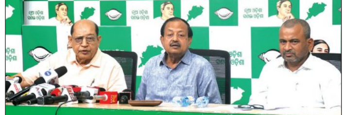
୧୨ ରାଜ୍ୟ ଓ କେନ୍ଦ୍ର ଶାସିତ ଅଞ୍ଚଳରୁ ୫ କୋଟିରୁ ଊର୍ଦ୍ଧ୍ୱ ବାଦ