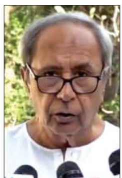
ଓଡ଼ିଶାବାସୀଙ୍କ ନିକଟରେ ବିଜେପିର ମୁଖ୍ୟ ଖୋଲି ଯାଇଛି ଅନ୍ୟାୟ ବିରୋଧରେ ବିଜେପିର ଜଣେ ବି ସାଂସଦ ସ୍ୱର ଉଠାଇଲେ ନାହିଁ ଓଡ଼ିଶାର ଅଧିକାର ପାଇଁ ବିଜେପି ସର୍ବଦା ଲଢ଼େଇ ଜାରି ରଖିବ

■ ଭୁବନେଶ୍ୱର, ୧୮ (ସମ୍ପାଦକ): କେନ୍ଦ୍ର ସରକାର ଆଣିଥିବା ସମ୍ବିଧାନର ୧୩୧ ତମ ସଂଶୋଧନ ବିଲ୍ ୨୦୨୬କୁ ନେଇ ବିଭିନ୍ନ ରାଜନୈତିକ ଦଳ କେନ୍ଦ୍ର ସରକାରଙ୍କୁ କଢ଼ା ସମାଲୋଚନା କରୁଛନ୍ତି । ଏପରିକି ଶୁକ୍ରବାର ମହିଳା ସଂରକ୍ଷଣ ବିଲ୍ ସଂସଦରେ କାର୍ତ୍ତ୍ୱ ଶାଲବା ପରେ ଏହା ବିରୋଧୀଙ୍କ ନୈତିକ ବିଜୟ ଏବଂ ସରକାରଙ୍କର ପରାଜୟ ବୋଲି ବିରୋଧୀ ଦଳ ମତବ୍ୟକ୍ତ କରିଛନ୍ତି । ଏପରିକି ମହିଳା ସଂରକ୍ଷଣ ବିଲ୍ ସହ ସୀମା ପୁନଃ ନିର୍ଦ୍ଧାରଣ ବିଲ୍କୁ ଯୋଡ଼ିବା ପଛରେ କେନ୍ଦ୍ର ସରକାରଙ୍କ ମନ୍ଦ ଉଦ୍ଦେଶ୍ୟ ଥିବା ବୋଲି ସାଧାରଣରେ ମତପ୍ରକାଶ ଯାଇଛି । ଏହିକ୍ରମରେ ସୀମା ପୁନଃନିର୍ଦ୍ଧାରଣ ବିଲ୍ ପ୍ରତିଯୋଗୀରେ ବିଜେପି କିପରି ଓଡ଼ିଶାର ଅଧିକାର, ସ୍ୱାର୍ଥ ସହ ସାଲିସ୍ କଲା, ତାହା ରାଜ୍ୟବାସୀ ଦେଖିଲେ ବୋଲି କହି କଢ଼ା ସମାଲୋଚନା କରିଛନ୍ତି ବିଜେପି ସଭାପତି ତଥା ବିରୋଧୀ ଦଳ ନେତା ନବୀନ ପଟ୍ଟନାୟକ । ଏପରିକି ଏହି ଅନ୍ୟାୟ ବିରୋଧରେ ଓଡ଼ିଶାର ଜଣେ ହେଲେ ବି ବିଜେପି ସାଂସଦ ସ୍ୱର ଉଠାଇବାକୁ ନବୀନଙ୍କୁ ରାଜ୍ୟବାସୀଙ୍କୁ ଚକିତ କରିଛି ବୋଲି ନବୀନ ମତବ୍ୟକ୍ତ କରିଛନ୍ତି । ଶନିବାର ଗଣମାଧ୍ୟମ ପ୍ରତିନିଧିଙ୍କୁ ଏନେଇ ପ୍ରତିକ୍ରିୟା ଦେଇ ନବୀନ କହିଛନ୍ତି ଯେ ବିଜେପି ସର୍ବଦା ପଞ୍ଚାୟତ ସ୍ତରରୁ ସଂସଦ ପର୍ଯ୍ୟନ୍ତ ମହିଳା ସଂରକ୍ଷଣ ବିଲ୍ ଠିକ୍ ହୋଇଛି । ମାତ୍ର ଆମେ ସୀମା ନିର୍ଦ୍ଧାରଣ ମାଧ୍ୟମରେ ଓଡ଼ିଶାର ରାଜନୈତିକ ଶକ୍ତି ହ୍ରାସ କରିବା ବିରୁଦ୍ଧରେ ସମ୍ପୂର୍ଣ୍ଣ ବିରୋଧ କରୁଛୁ । ଓଡ଼ିଶାର ଲୋକମାନେ ଦେଖିଛନ୍ତି ଯେ ସେମାନଙ୍କ ଅଧିକାର ପାଇଁ କିଏ ଲଢ଼ିଛି ଏବଂ ବିଜେପି । ପୃଷ୍ଠା-୭