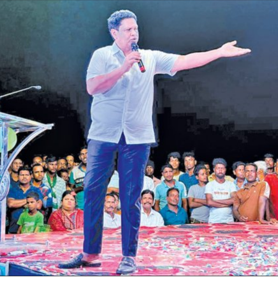
ସମାଲୋଚନା କରି ଯଦି ନିଜ ଭିତରେ ଏତେ ସାଜିମାନ ଥିଲା ସାଧାନ ଭାବେ କହି ନିଜର ପଡିଆରା ଦେଖାଇଥାନ୍ତ। ୨୦୦୪ରେ ସାଧାନ ଭାବେ