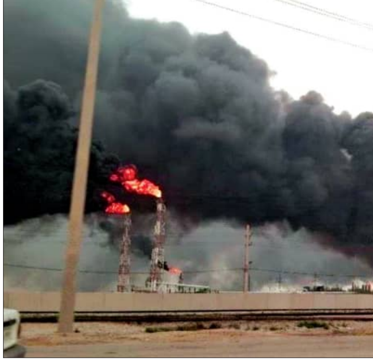
ଏକେଡି (ଆଇଏଲଏ) ଗଭୀର ଚିନ୍ତା ପ୍ରକଟ କରିଛି। ଆଇଏଲଏ ମୁଖ୍ୟ ରାଷ୍ଟ୍ରପତି ଗ୍ରୋସି ଚେତାବନୀ ଦେଇ କହିଛନ୍ତି ଯେ, କୌଣସି ପରିସ୍ଥିତିରେ ପରମାଣୁ କେନ୍ଦ୍ରକୁ ଟାଣେଟି କରାଯିବାର ଉଚିତ ନୁହେଁ, କାରଣ ଏହାଦ୍ୱାରା

ଇରାନ ଧୂସ ପାଇଁ ପ୍ରସ୍ତୁତ ରହୁ ବୋଲି ଧମକ ଦେଇଛନ୍ତି ଟ୍ରମ୍ପ। ଇତିମଧ୍ୟରେ ଗୋଟିଏ ପରେ ଗୋଟିଏ ବିପଲତା ପରେ ଇରାନର ବେସାମରିକ ଭିକିରଣକୁ ଟାଣେଟି କରିବା ସହିତ ଇରାନର ପରମାଣୁ କେନ୍ଦ୍ର ଉପରେ ଆକ୍ରମଣ ଚଳାଇଛନ୍ତି ଟ୍ରମ୍ପ। ଇସ୍ରାଏଲ ସହ ମିଶି ଆଜି ଇରାନର ଦକ୍ଷିଣ-ପଶ୍ଚିମରେ ଅବସ୍ଥିତ ବୁଶେହର ପରମାଣୁ କେନ୍ଦ୍ର ପରିସରରେ କ୍ଷେପଣାସ୍ତ୍ର ମାଡ଼ କରିଛି ଆମେରିକା। ଏଥିରେ ଜଣେ ବ୍ୟକ୍ତିଙ୍କର ମୃତ୍ୟୁ ହୋଇଥିବା ବେଳେ ଏକ ସହାୟକ ବିଲ୍ଡିଂ କ୍ଷତିଗ୍ରସ୍ତ ହୋଇଛି। ତେବେ ମୁଖ୍ୟ ପରମାଣୁ କେନ୍ଦ୍ର ସୁରକ୍ଷିତ ରହିଛି ଏବଂ ସେଠାରେ ସାଭାସିକ କାର୍ଯ୍ୟ ଚାଲୁ ରହିଛି। ଏହି ଘଟଣାକୁ ନେଇ ଅନ୍ତର୍ଜାତୀୟ ପରମାଣୁ ଶକ୍ତି