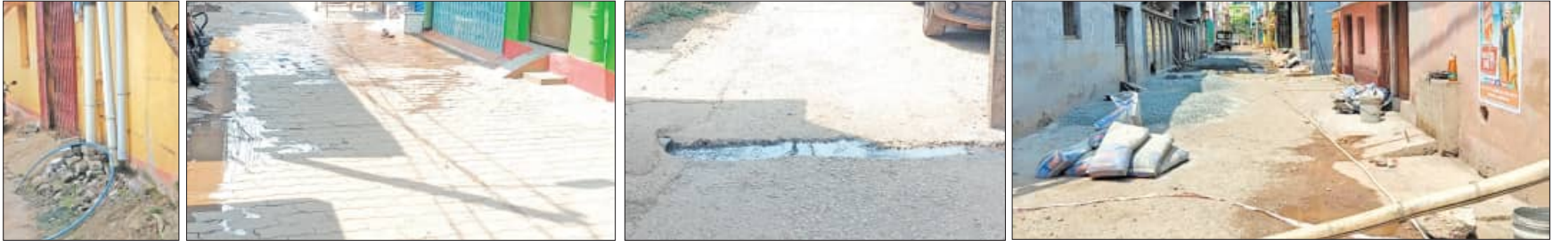
ଯୋଡ଼ା, ୪୪ (ସମ୍ପାଦକ):

କେନ୍ଦ୍ରୀୟ ଜିଲ୍ଲା ଯୋଡ଼ା ପୌରପାଳିକା ବିଭିନ୍ନ ଖର୍ଚ୍ଚରେ ପୌରପାଳିକା ନିୟମଗୁଡ଼ିକୁ ଖୋଲାଖୋଲି ଭଙ୍ଗି ଦେଇଛନ୍ତି। ସେଥିପାଇଁ ପୌରପାଳିକା ନିୟମ ଚ୍ୟୁତ ହେଉଛି।